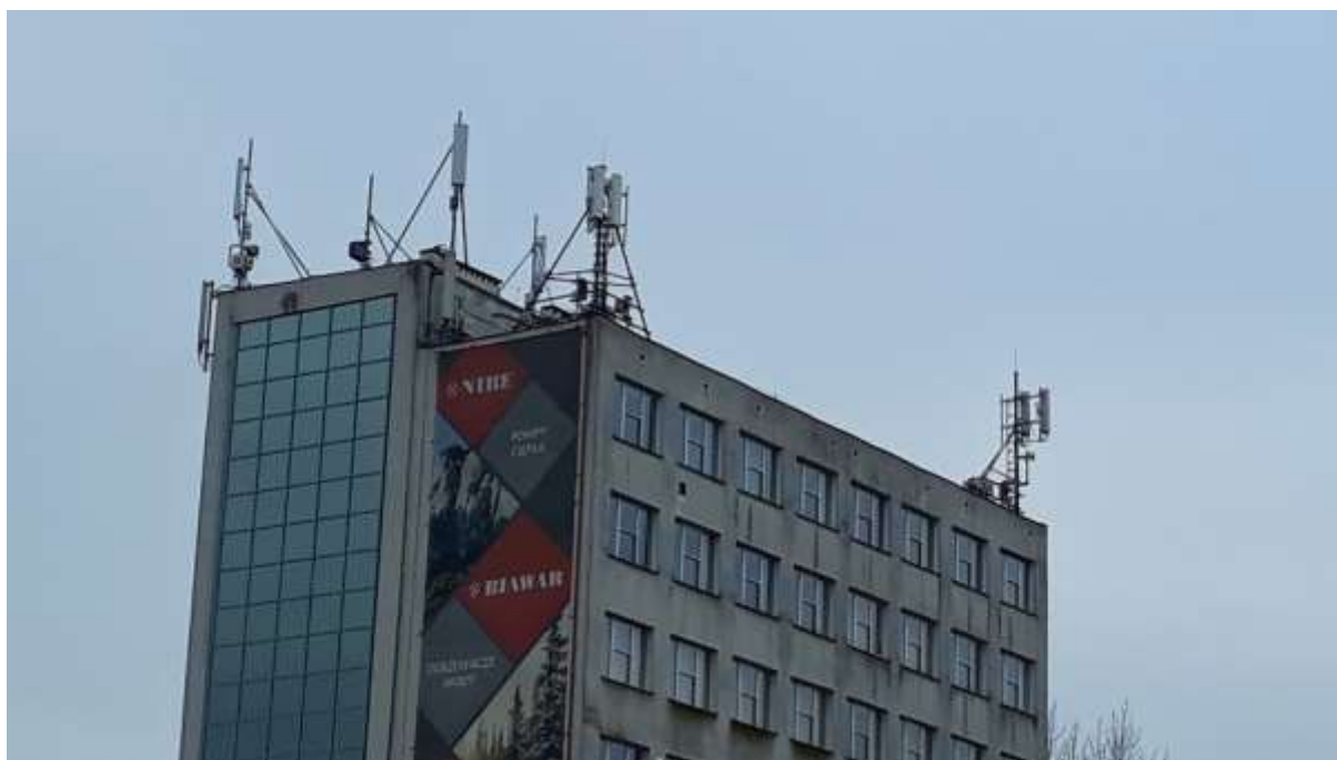
Fot. 1: Widoki anten stacji bazowych ID: BT11151 oraz ID: 0592, zlokalizowanych: ul. Jana Pawła II 57, 15-703 Białystok