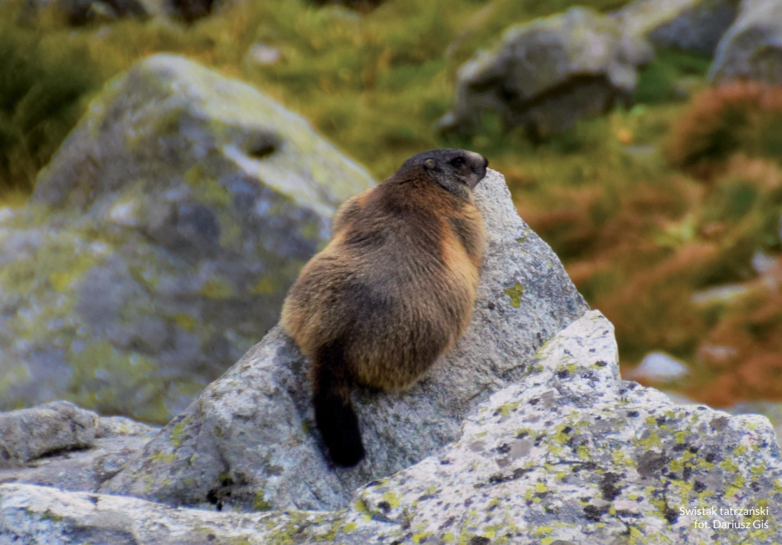
Swistak tatrzański