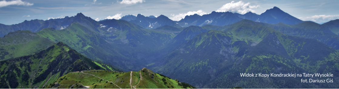
Widok z Kopy Kondrackiej na Tatry Wysokie