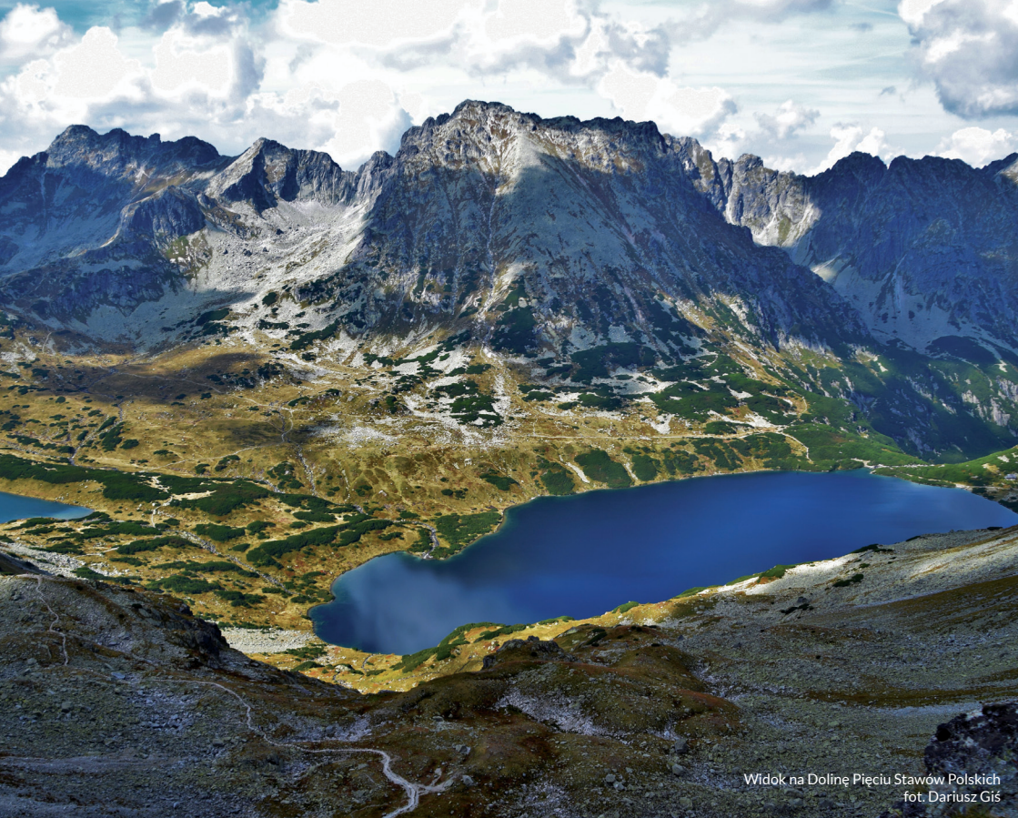
Widok na Dolinę Pięciu Stawów Polskich