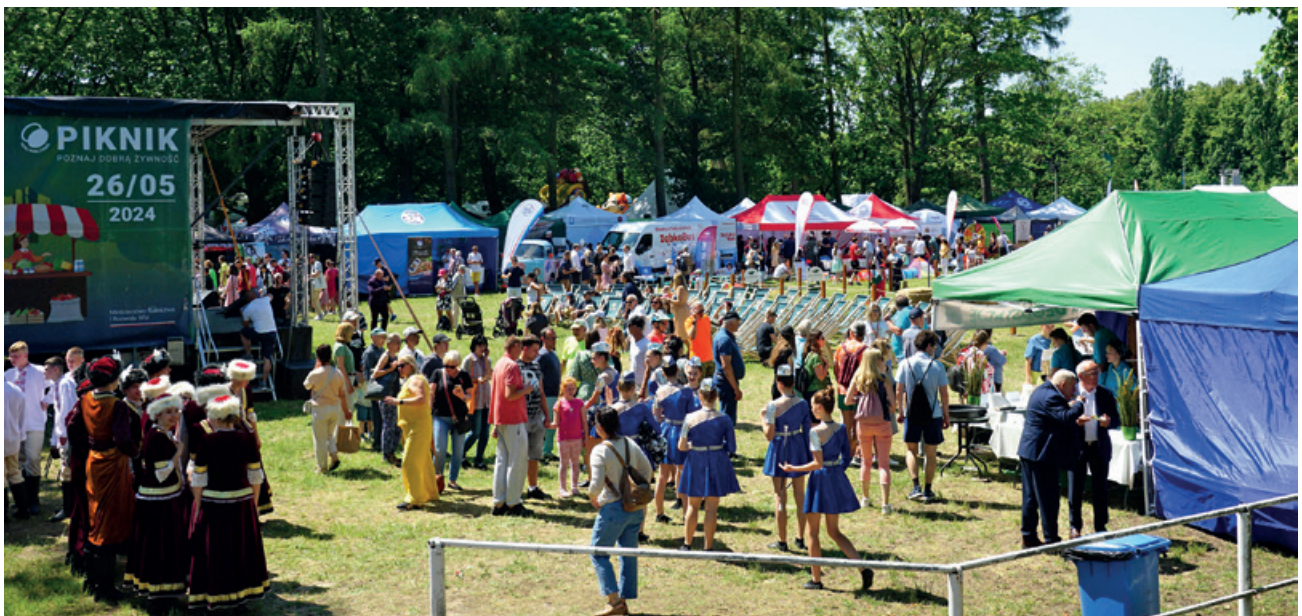
Tegoroczny piknik Poznaj Dobrą Żywność zgromadził ponad 70 wystawców i 10 tys. uczestników

Departament Rolnictwa Ekologicznego i Jakości Żywności MRiRW tel. 22 623 16 32