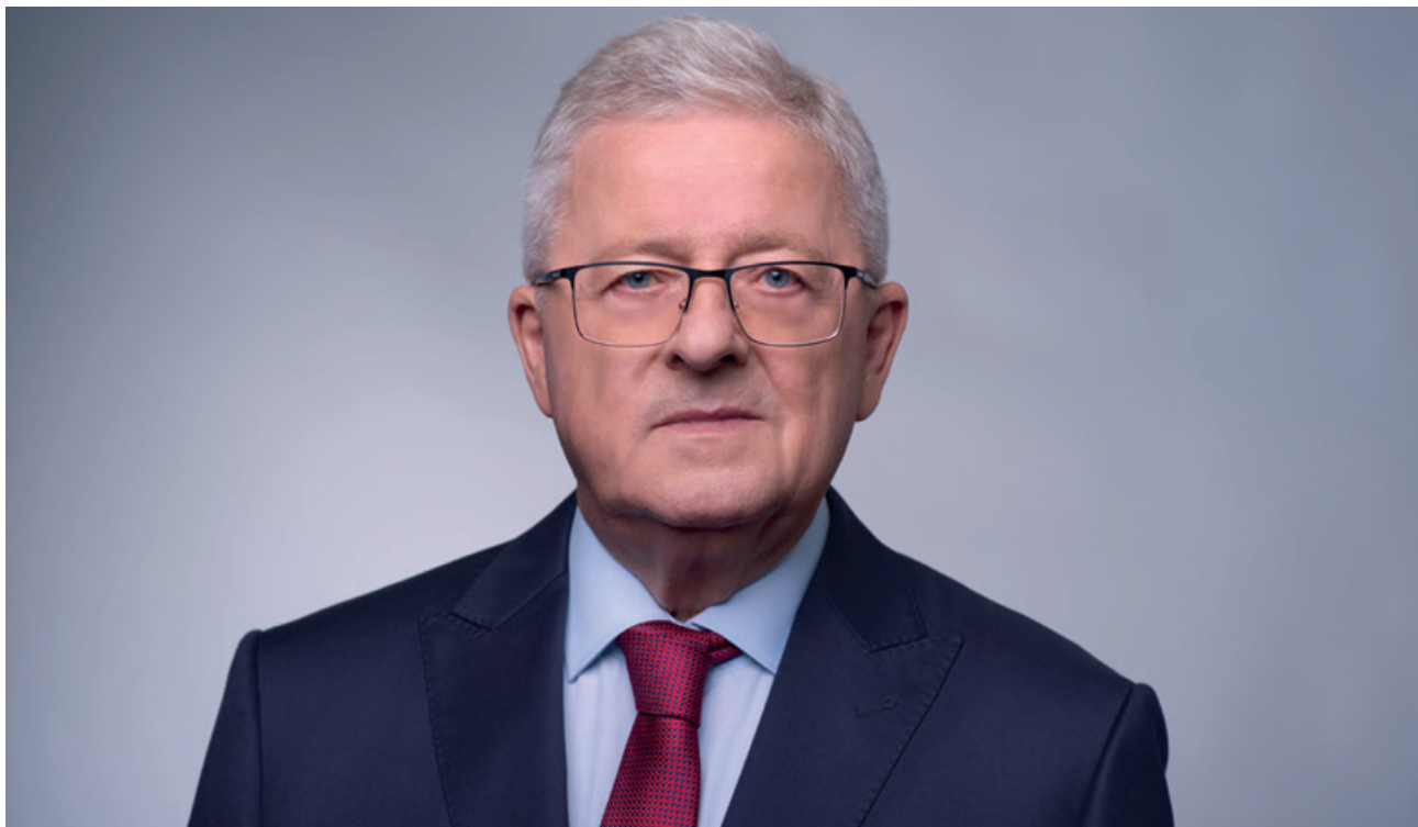
CZESŁAW SIEKIERSKI, minister rolnictwa i rozwoju wsi