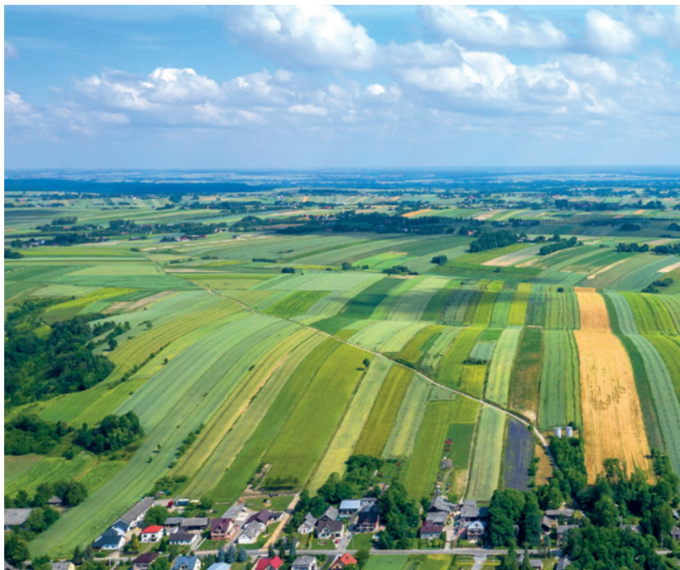
Ekoschematy to dobrowolna i płatna dla rolników interwencja

żliwe było zniesienie już w 2024 r. obowiązku ugorowania 4 proc. gruntów ornych w ramach normy GAEC 8.