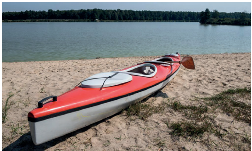
Zbiornik Klekot stał się miejscem, gdzie można uprawiać sporty wodne

Wydatki kwalifikowalne zrealizowanej przez gminę Włoszczowa operacji „Utworzenie ogólnodostępnej infrastruktury turystycznej i rekreacyjnej przeznaczonej na użytek publiczny w otoczeniu stawów rybnych i zbiornika Klekot w gminie Włoszczowa” wyniosły ogółem 460 635 zł, w tym ze środków z Eu-