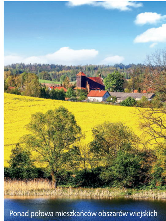
Ponad połowa mieszkańców obszarów wiejskich

obszarach wiejskich w ostatnich latach. Największe zadowolenie mieszkańcy wsi wyrażają w związku z dostępem do sieci wodociągowej (67,6 proc.) i do internetu (61,1 proc.). Najmniej zadowoleni są natomiast z dostępu do sieci gazowej (34,1 proc. zadowolonych i 52,4 proc. niezadowolonych), a także z dostępu do sieci kanali-