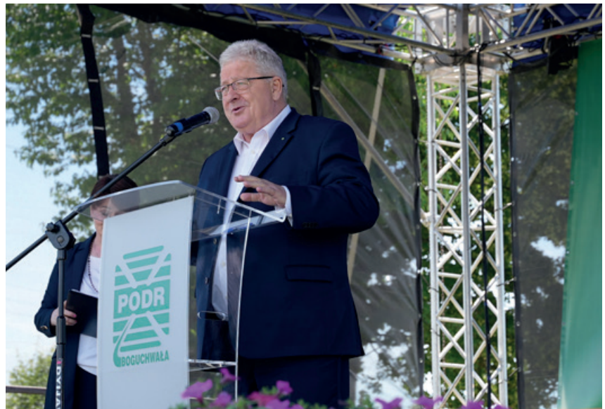
Rolnictwo to żywność, rolnictwo to wyżywienie, rolnictwo to zdrowie – podkreślał minister rolnictwa i rozwoju wsi Czesław Siekierski podczas uroczystego otwarcia V Krajowych Dni Pola w Boguchwale

Na poletkach, oprócz zbóż, znajdują się: kolekcja ziół i roślin