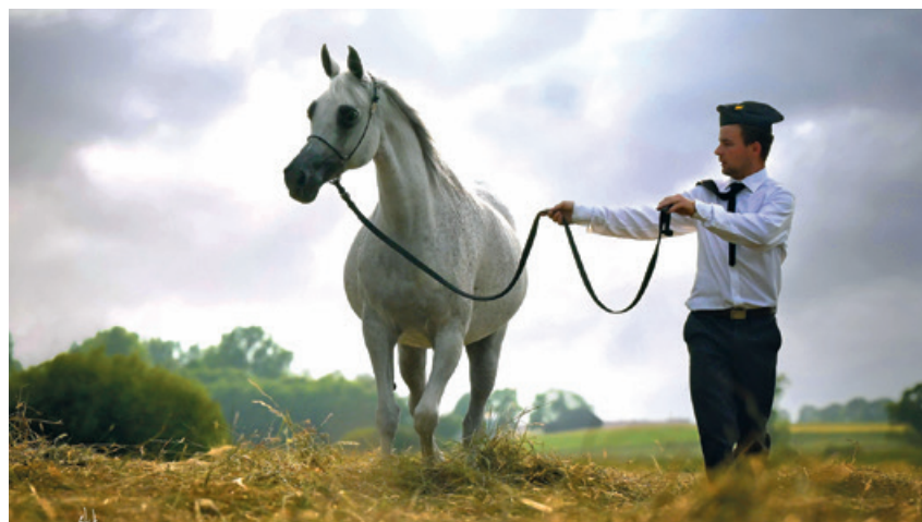
Zigi Zana, siwa klacz z Michałowa

Po Pokazie Narodowym, Pride of Poland oraz Summer Sale, odbywają się parady hodowlane w stadniach (12–13 sierpnia). Klacze wraz z przychowkiem prezentowane są w kameralnej atmosferze stadnin, a goście, spacerując po stajniach, mają okazję poznać nowe pokolenia wywodzące się od ich ulubionych koni.