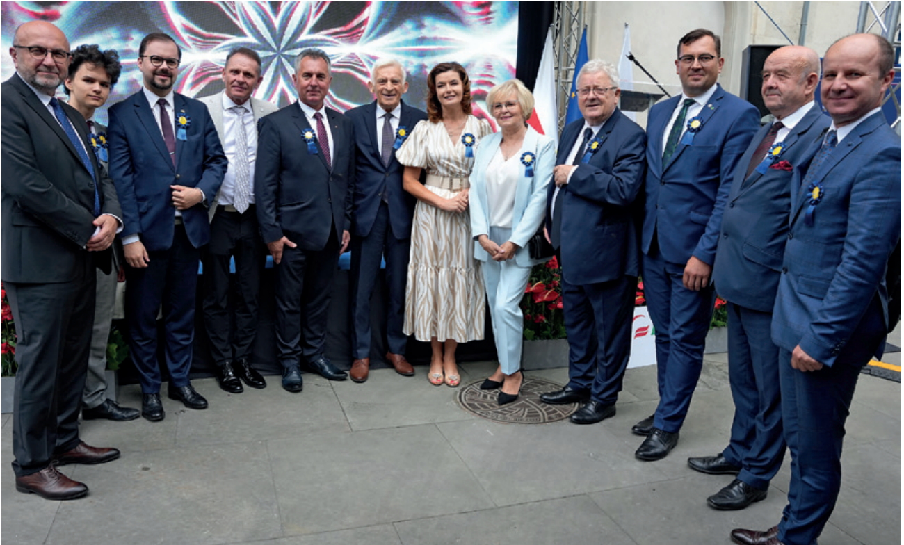
Wspólne zdjęcie gości biorących udział w uroczystości