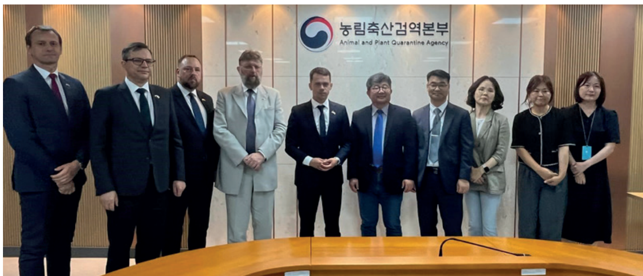
Uczestnicy rozmów w Agencji Kwarantanny Zwierząt i Roślin

Sekretarz stanu Michał Kołodziejczak 9–14 czerwca 2024 r. przebywał z wizytą w Korei Południowej. Celem wizyty było wsparcie polskich przedsiębiorców w ramach projektu „Mięso z Polski w Republice Korei Południowej”. Wiceminister otworzył polskie stoisko na targach Seoul Food & Hotel i odbył szereg spotkań z przedstawicielami administracji koreańskiej.