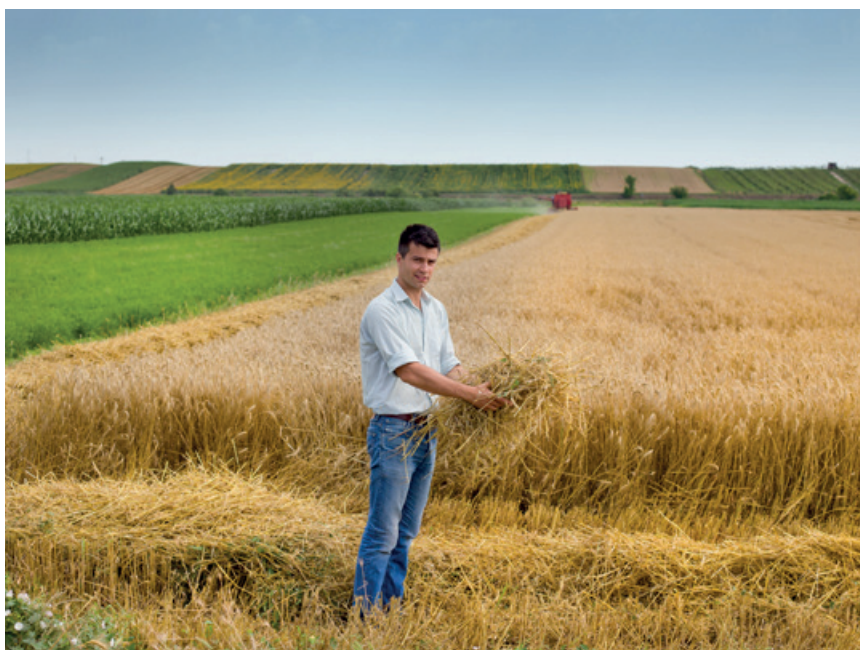
Pomoc ma formę premii, a jej kwota to 200 tys. zł

Premie przyznaje się na rozpoczęcie i rozwój działalności rolniczej w gospodarstwie przez