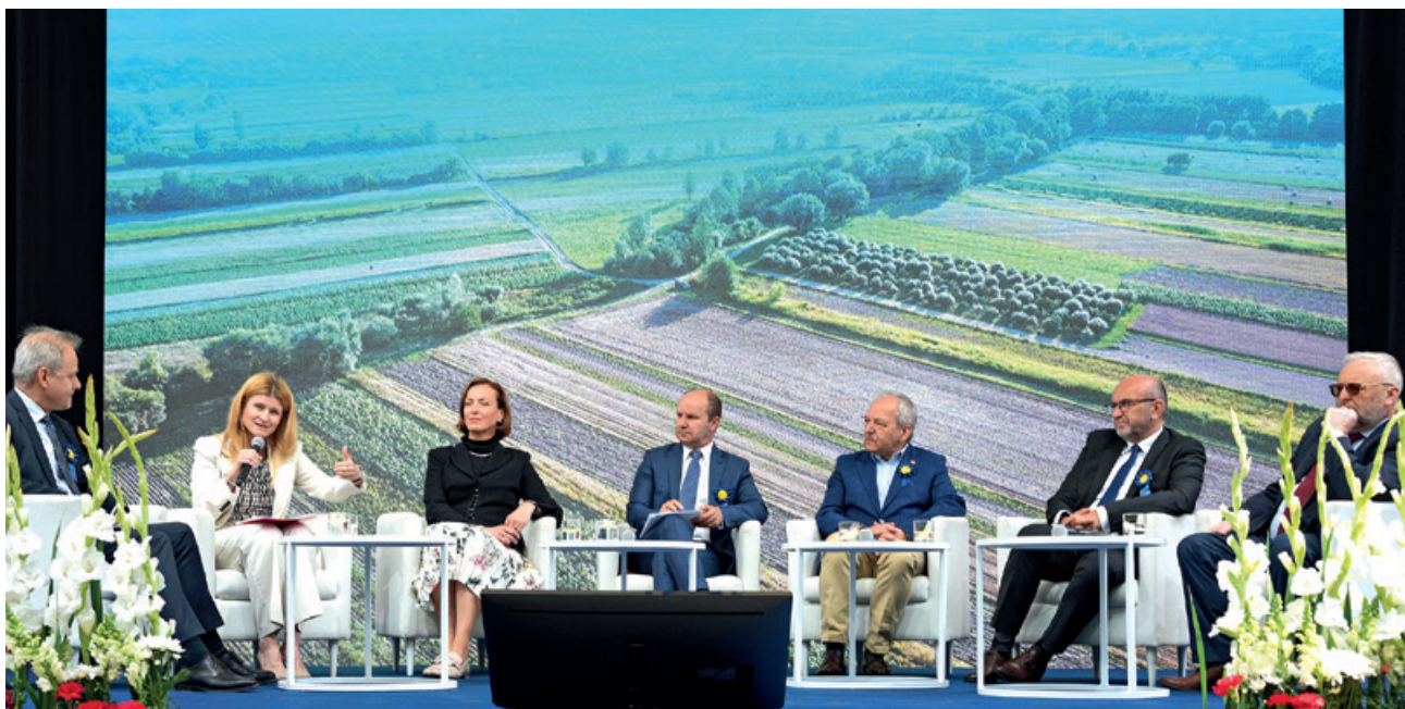
Panel dyskusyjny w ramach uroczystości upamiętniającej wejście Polski do UE

otwarcie i wsparcie po stronie państw zachodnich na rzecz naszego członkostwa w NATO i UE.