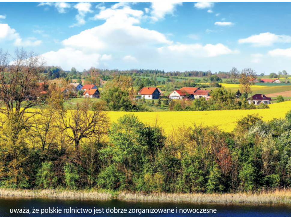
uważa, że polskie rolnictwo jest dobrze zorganizowane i nowoczesne