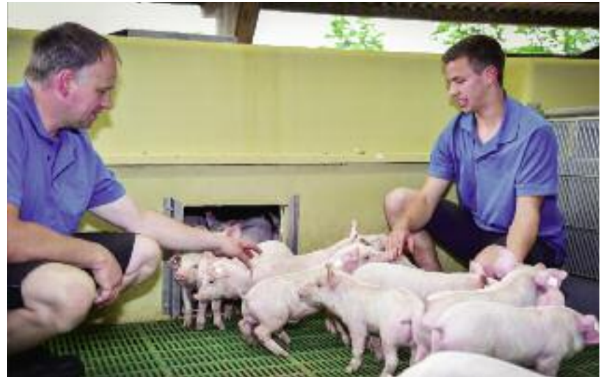
W związku z wystąpieniem na terenie Polski wirusa ASF wprowadzono w ramach PROW 2014-2020 możliwość wsparcia działań prewencyjnych w gospodarstwach utrzymujących trzodę chlewną