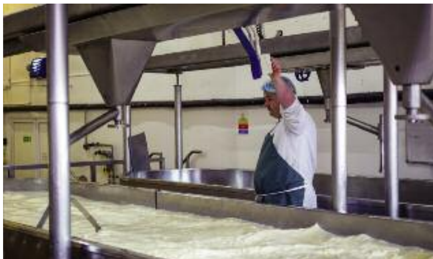
W marcu ma być również uruchomiony nabór wniosków o wsparcie dla firm z branży przetwórstwa produktów rolnych lub zajmujących się ich sprzedażą hurtową

O premie w wysokości 100 tys. zł będą mogli ubiegać się rolnicy, domownicy, małżonkowie rolnika, którzy m.in. udokumentują fakt podlegania ubezpieczeniu KRUS z mocy ustawy i w pełnym zakresie. Firma, która zostanie założona dzięki temu wsparciu, może zajmować się m.in. przetwórstwem i sprzedażą produk-