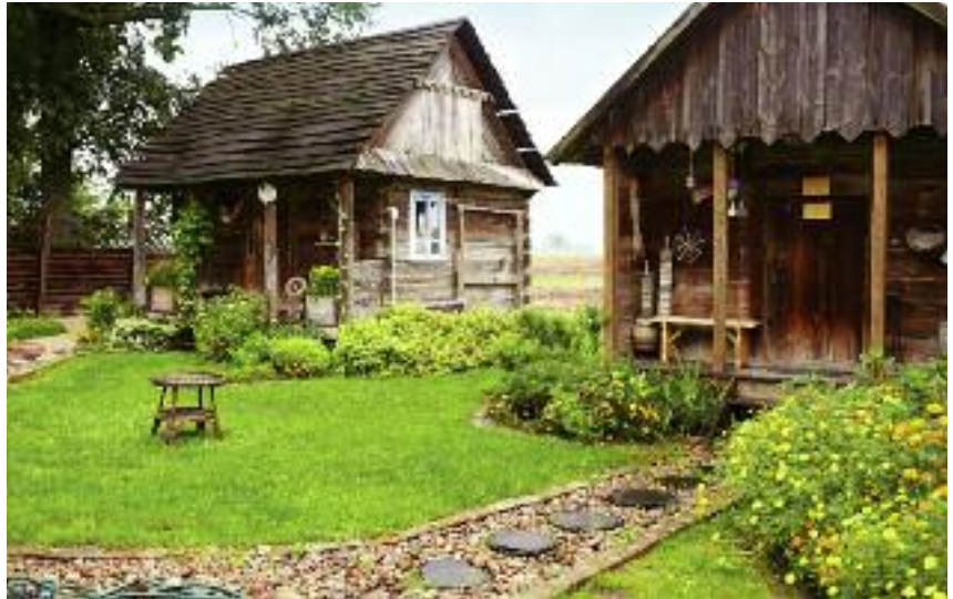
Wypoczynkowa oferta gospodarstw agroturystycznych obejmuje różnego rodzaju dodatkowe usługi i zajęcia rekreacyjne. Na zdjęciu: wiejskie SPA z „Krainy Rumianku”

W 2017 r., w ramach projektu Odpoczywaj na wsi , stoisko turystyki wiejskiej i agroturystyki będzie można odwiedzić na następujących krajowych imprezach targowych: