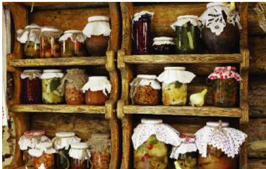
W ramach rolniczego handlu detalicznego możliwe jest m.in. przetwórstwo i zbywanie wytworzonej żywności konsumentom końcowym. Warunkiem jest, aby taka żywność pochodziła w całości lub części z własnej uprawy, hodowli lub chowu

ślinnych i zwierzęcych, z wyłączeniem przetworzonych produktów roślinnych i zwierzęcych uzyskanych w ramach działów specjalnych produkcji rolnej oraz produktów opodatkowanych podatkiem akcyzowym, do kwoty 20 000 zł rocznie, w ilościach nieprzekraczających maksymalnych limitów określonych w rozporządzeniu Ministra Rolnictwa i Rozwoju Wsi z dnia 16 grudnia 2016 r. w sprawie maksymalnej ilości żywności zbywanej w ramach rolniczego handlu detalicznego oraz zakresu i sposobu jej dokumentowania, przy czym m.in.: