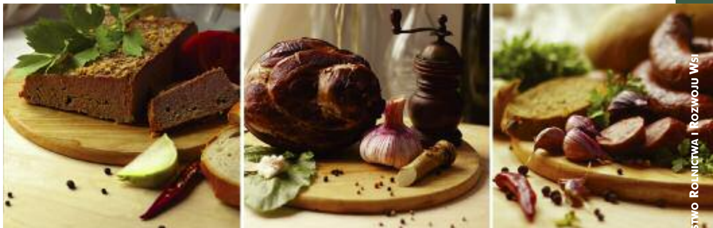
Przepisy wzmacniające pozycję producenta rolnego w łańcuchu dostaw żywności weszły w życie 1 stycznia br.

podyktowana zmianą sposobu funkcjonowania funduszy promocji produktów rolno-spożywczych.