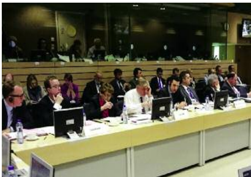
Minister Krzysztof Jurgiel podczas posiedzenia Rady UE ds. Rolnictwa i Rybołówstwa w Brukseli

Na marginesie Rady Ministrów minister rolnictwa i rozwoju wsi Krzysztof Jurgiel spotkał się z Komisarzem ds. Zdrowia i Bezpieczeń-