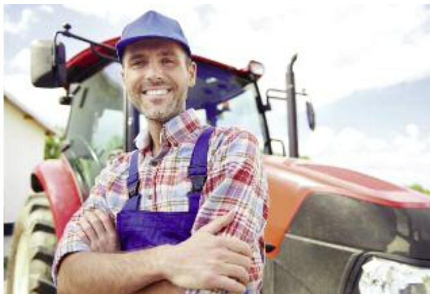
Od 18 stycznia br. wszystkie sprawy związane z premiami dla młodych rolników są rozpatrywane w oddziałach regionalnych ARiMR

Organami właściwymi do prowadzenia trybów nadzwyczajnych w zakresie decyzji lub postanowień w ramach Premii dla młodych rolników wydanych przed dniem 18 stycznia 2017 r. są: