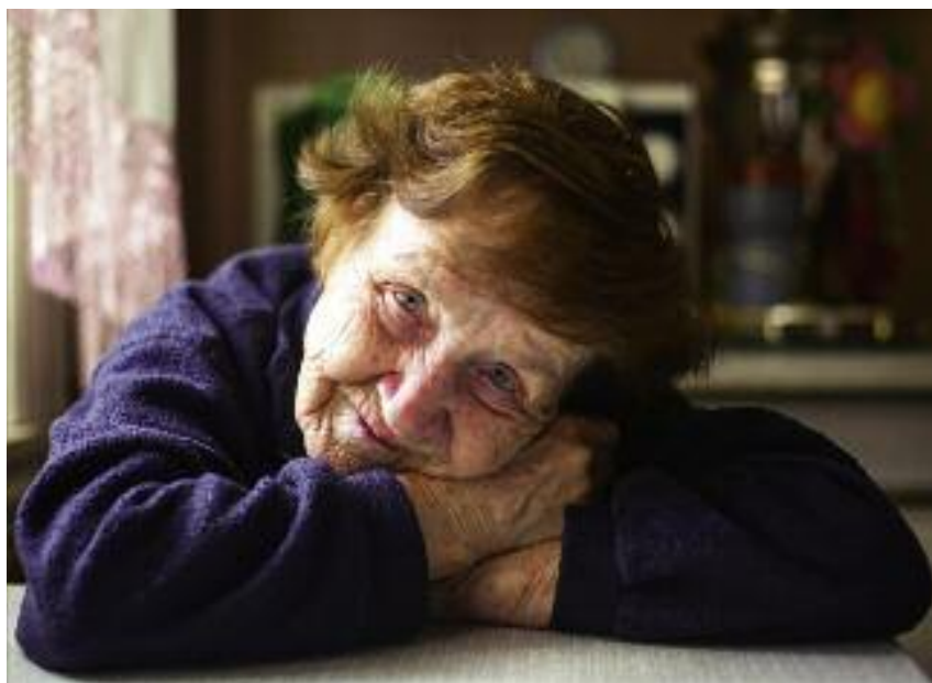
Na podwyższeniu rolniczych świadczeń emerytalno-rentowych skorzysta ok. 34% emerytów i rencistów

Zgodnie z zmianami wprowadzonymi do ustawy z dnia 20 grudnia 1990 r. o ubezpieczeniu społecznym rolników (Dz. U. z 2016 r, poz. 277), jeżeli wy-