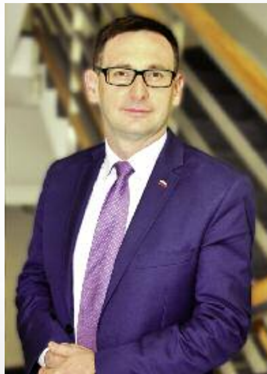
Daniel Obajtek Prezes Agencji Restrukturyzacji i Modernizacji Rolnictwa