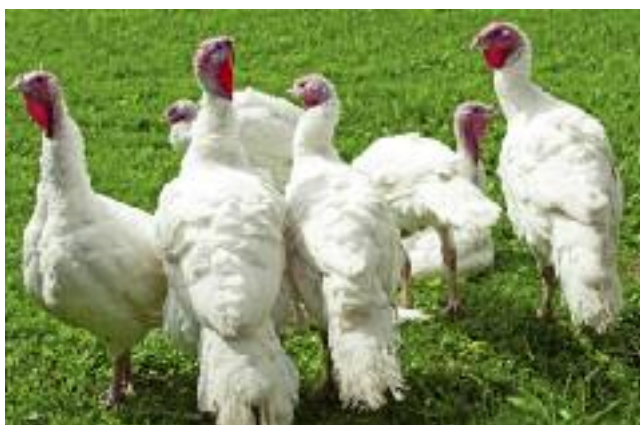
Od 1 lutego br. producenci drobiu z obszarów zapowietrzonych lub zagrożonych wystąpieniem grypy ptaków mogą składać w biurach powiatowych ARiMR wnioski o pomoc w formie rekompensat

zgodnie z rozporządzeniem Rady Ministrów z dnia 24 stycznia 2017 r. zmieniające rozporządzenie w sprawie szczegółowego zakresu i sposobów realizacji niektórych zadań Agencji Restrukturyzacji i Modernizacji Rolnictwa (Dz. U. z 2017 r. poz. 166). Z pomocy będą korzystać producenci rolni w rozumieniu przepisów o krajowym systemie ewidencji producentów, ewidencji gospodarstw rolnych oraz ewidencji wniosków o przyznanie płatności, którzy prowadzą gospodarstwo w rozumieniu art. 2 pkt 8 ustawy z dnia 11 marca 2004 r.