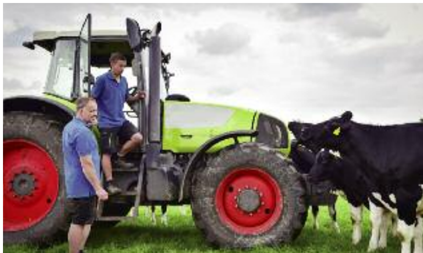
W I kwartale br. zostanie uruchomiony nabór wniosków na jedno z najpopularniejszych działań PROW 2014-2020 „Restrukturyzacja małych gospodarstw”. Pomoc może być przyznana m.in. na zakup nowych maszyn i urządzeń a nawet na zakup stada podstawowego zwierząt hodowlanych

Wysokość dofinansowania, jakie można otrzymać w całym okresie realizacji PROW 2014-2020, zależy od tego, kim jest beneficjent. Gdy jest nim przedsiębiorstwo zajmujące się przetwarzaniem i wprowadzaniem do obrotu produktów rolnych, wysokość wsparcia wyniesie do 3 mln zł. Natomiast jeżeli o pomoc ubiega się przedsiębiorstwo, które jest związkiem grup producentów rolnych lub zrzeszeniem organizacji producentów, wówczas może liczyć maksymalnie na 15 mln zł.