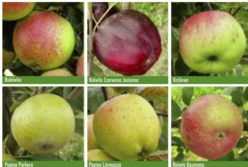
Tradycyjne odmiany jabłoni (pakiet 3), Instytut Ogródnictwa

Podsumowując, należy podkreślić, że tradycyjne odmiany stanowią ważne i wartościowe dziedzictwo, genetyczne oraz kulturowo-historyczne. Ich solidność, płodność i odporność na choroby i szkodniki,