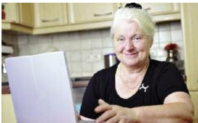
Złożenie wniosku o przyznanie płatności bezpośrednich przy wykorzystaniu e-Wniosku jest zdecydowanie najwygodniejszą formą. ARiMR udostępni aplikację 15 marca za pośrednictwem swojej strony internetowej

obejmujących 75% powierzchni zatwierdzonej do jednolitej płatności obszarowej w roku 2016. Rolnik, wchodząc w moduł umożliwiający wyrysowanie działek rolnych, będzie mógł pobrać obrys działki wyrysowa-