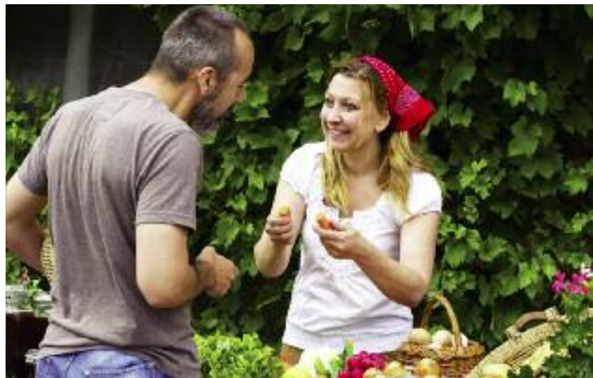
Produkcja i zbywanie żywności w ramach rolniczego handlu detalicznego nie mogą być, co do zasady, dokonywane z udziałem pośrednika

dzeń gospodarstwa domowego w kuchni domowej), zamiast wymogów określonych w załączniku II w rozdziale I i II ww. rozporządzenia, obowiązują wymogi określone w jego załączniku II w rozdziale III (uproszczone wymagania higieniczne). Należy przy tym podkreślić,