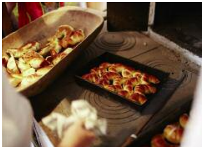
Dużą popularnością cieszy się turystyka kulinarna, dzięki której turyści mogą poznać smaki i zapachy lokalnej kuchni

W ramach projektu przewidziane jest także wydanie folderu pt. Hity Turystyki Wiejskiej – Polska w pięciu wersjach językowych: polskiej, angielskiej, niemieckiej, francuskiej