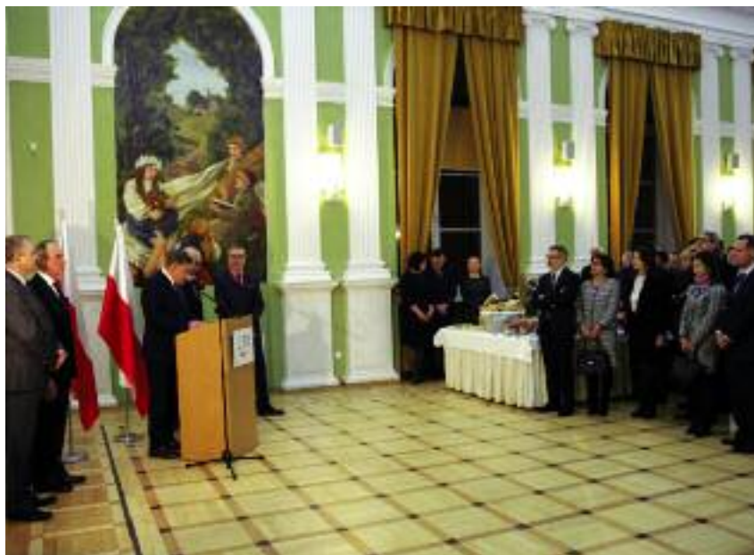
W noworocznym spotkaniu Ministra Rolnictwa z dyplomatami uczestniczyli przedstawiciele 63 krajów

W tym roku wydarzenie zostało przygotowane w Centralnej Bibliotece Rolniczej, we współpracy z przedsiębiorcami, organizacjami branżowymi, stowarzyszeniami i spółdzielniami sektora rolno-spożywczego. Zorganizowano je w formule wystaw tematycznych promujących polskie produkty. Goście mogli skosztować potraw przygotowanych z wykorzystaniem polskich mięs, ryb, mleka i przetworów mlecznych oraz owoców i warzyw. Serwowano także polskie słodzycze i napoje.