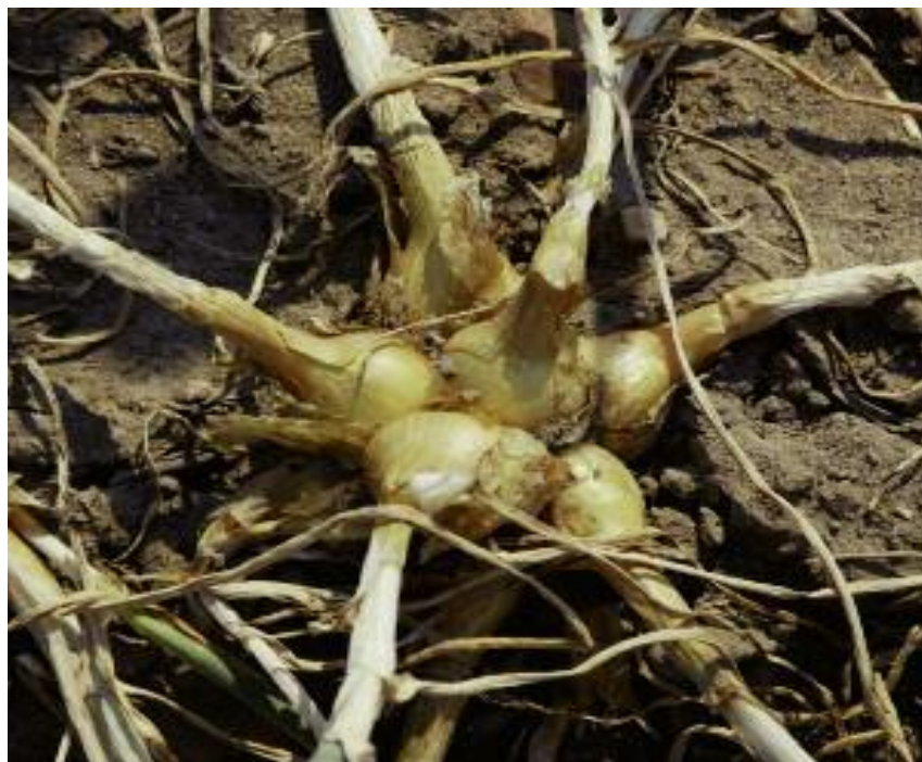
Odmiana miejscowa szalotki – kolekcja roślin warzywnych, Instytut Ogrodnictwa

Obszar Ochrona Zasobów Genowych Roślin Użytkowych ma na celu ochronę materiału genetycznego najważniejszych roślin uprawnych i ich dzikich krewnych na potrzeby hodowli, badań naukowych oraz dywersyfikacji roślin uprawnych na obszarach wiejskich. W ramach obszaru wykonywanych jest siedem zadań poświęconych czynnej ochronie zasobów genowych oraz upowszechnianiu informacji o zgromadzonych zasobach. Dotyczą one przede wszystkim zbioru i zachowania w kolekcjach wartościowych odmian i gatunków roślin uprawnych, ich charakterystyki, oceny pod kątem atrakcyjności dla użytkowników, dokumentacji w internetowej bazie danych informacji o zgromadzonych zasobach oraz ich udostępniania użytkownikom.