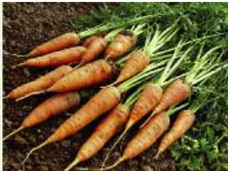
Produkty nieprzetworzone mogą zostać oznakowane informacją „Produkt polski”, jeżeli ich produkcja, uprawa i zbiór lub hodowla odbyła się na terytorium RP