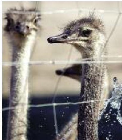
Rekompensatę będą mogli otrzymać m.in. producenci strusi, indyków, kaczek, gęsi...

rzętu za drób zabity z nakazu Inspekcji Weterynaryjnej albo do zapomogi za drób padły na podstawie art. 50 ust. 1 tej ustawy; grupa ta obejmuje także gospodarstwa