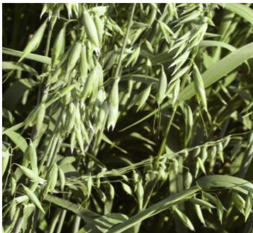
Odmiana miejscowa owsa siewnego – kolekcja roślin rolniczych, IHAR-PIB