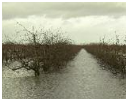
Jeżeli rolnik nie zawarł polisy obowiązkowego ubezpieczenia upraw i planuje odtworzenie np. sadu, kwota pomocy zostanie pomniejszona o 50%

Kto może ubiegać się o przyznanie pomocy na operacje tego typu?