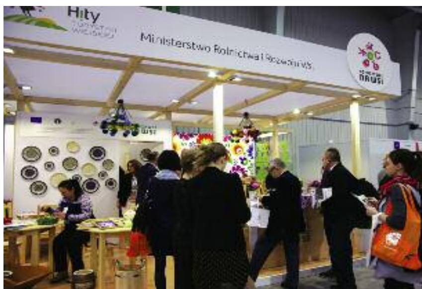
Stoisko turystyki wiejskiej i agroturystyki zorganizowane w ramach projektu „Odpoczywaj na wsi” będzie można odwiedzić na wielu tegorocznych krajowych imprezach targowych

Jest to szczególnie istotne w kontekście zachowania struktury przestrzennej, społecznej i gospodarczej