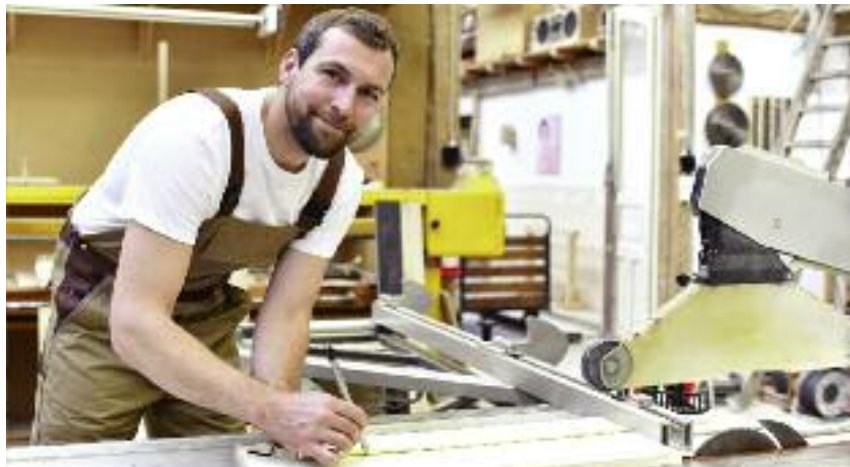
Rolnicy, małżonkowie rolnika oraz domownicy podlegający w pełnym zakresie ubezpieczeniu KRUS będą mogli w I kwartale składać wnioski o premię w wysokości 100 tys. zł na inwestycje w działalność pozarolniczą

tów nierolnych, rzemiosłem, rękodzielnictwem, turystyką wiejską, usługami opieki nad dziećmi, osobami starszymi, niepełnosprawnymi,