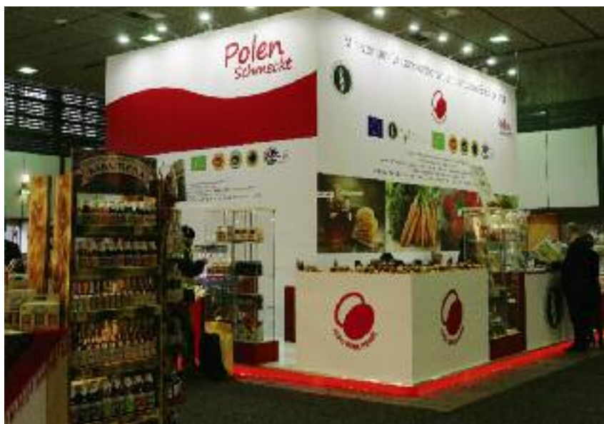
MRiRW zaprezentowało na targach własne stoisko informacyjno-promocyjne

Wiceminister Zarudzki podkreślił, że: Polska przygotowała program