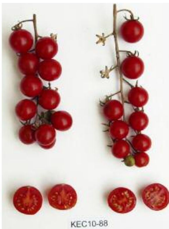
Odmiana miejscowa pomidora – kolekcja roślin warzywnych, Instytut Ogrodnictwa

Z instytutami współpracuje kilkanaście krajowych podmiotów, głównie jednostek naukowych, które prowadzą kolekcje, przechowując w odpowiednich warunkach zgromadzony materiał, oceniając, opisując go oraz udostępniając zainteresowanym użytkownikom.