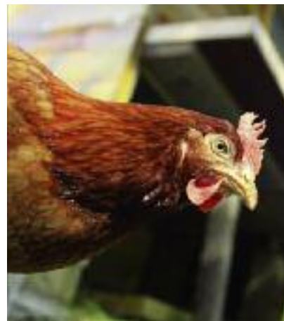
... a także hodowcy kur, perliczek i przepiórek

z art. 26 ust. 9 lit. b rozporządzenia Komisji (UE) nr 702/2014.