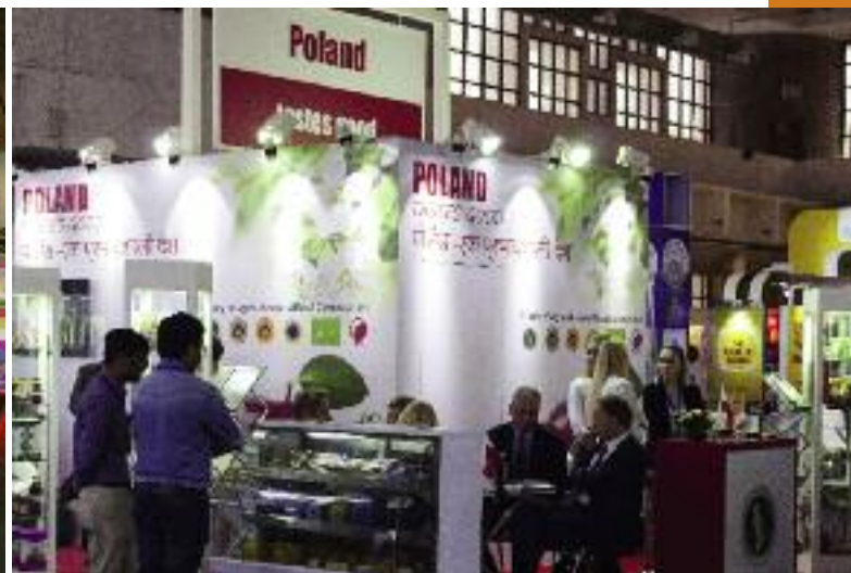
MRiRW oraz ARR przygotowały na 2017 rok szereg działań promocyjnych, które mają wspierać rozwój międzynarodowej współpracy handlowej polskiego sektora rolno-spożywczego