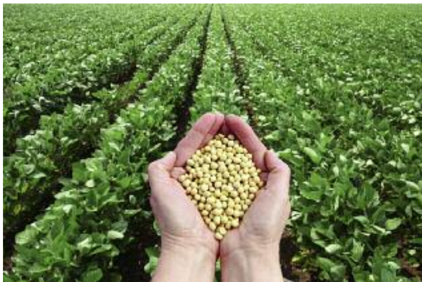
Występujący w Polsce deficyt białka paszowego uzupełniany jest importem śruty sojowej

Zapotrzebowanie na surowce wysokobiałkowe w Polsce charakteryzuje się systematycznym wzrostem, który jest wynikiem przede wszystkim wysokiej dynamiki produkcji zwierzęcej. Zwiększa się również popyt na pasze w chowie trzody chlewnej w związku z postępującym procesem jego koncentracji i zachodzącymi zmianami w technologii żywienia. Nie bez znaczenia jest również wzrost intensywno-