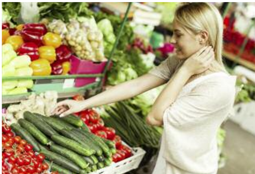
Pomoc z działania „Inwestycje w targowiska...” może być przyznana również na przebudowę istniejącego targowiska lub obiektów budowlanych przeznaczonych na cele promocji lokalnych produktów

Pomoc ma formę refundacji części kosztów kwalifikowalnych operacji, która jest wypłacana przez ARiMR po zrealizowaniu inwestycji.