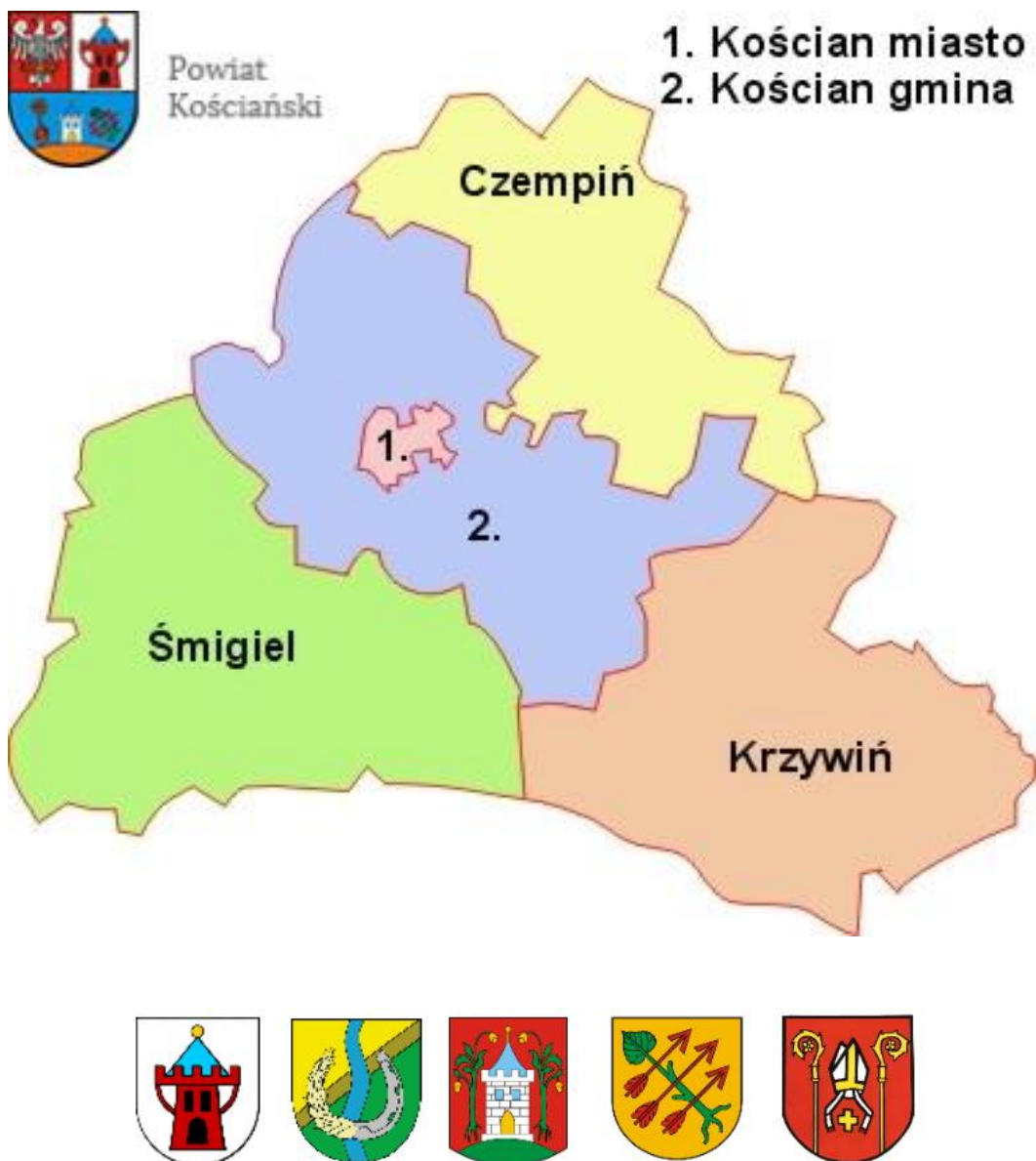
Ryc. 1. Mapa powiatu kościańskiego