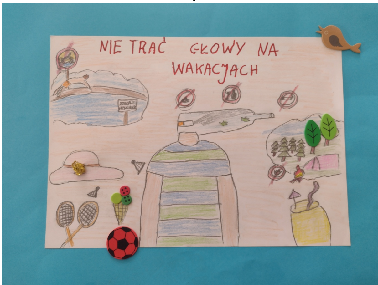
Natan Stanisz, klasa II, Szkoła Podstawowa nr 6 w Policach