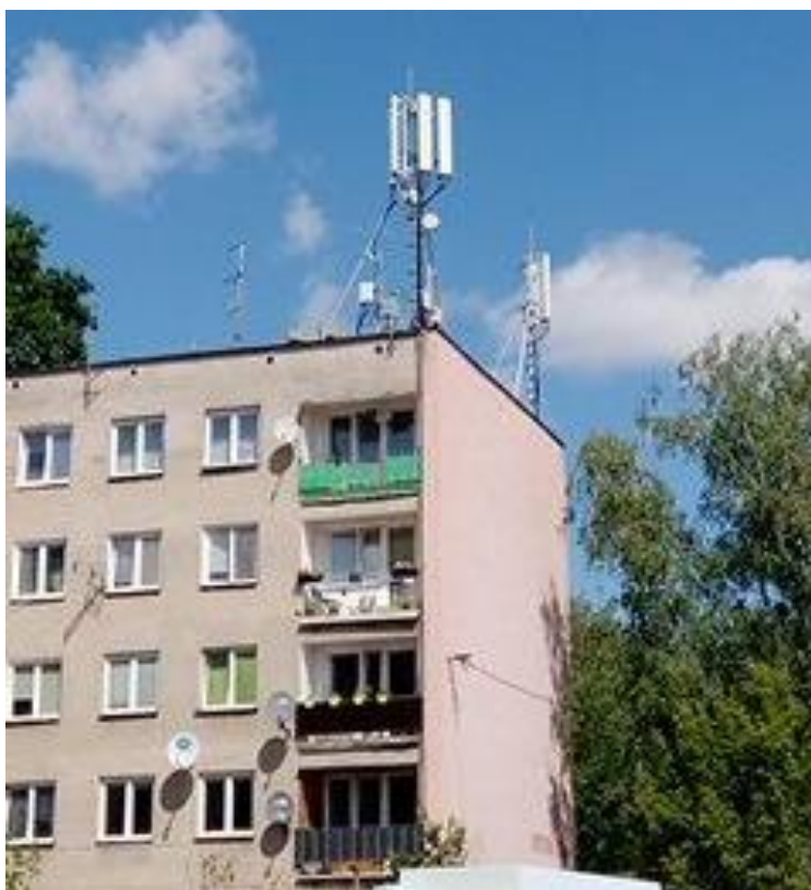
Fot. 1: Widoki anten stacji bazowej ID: BIA1020_A, zlokalizowanej pod adresem: ul. Antoniuk Fabryczny 11E, 15-762 Białystok.