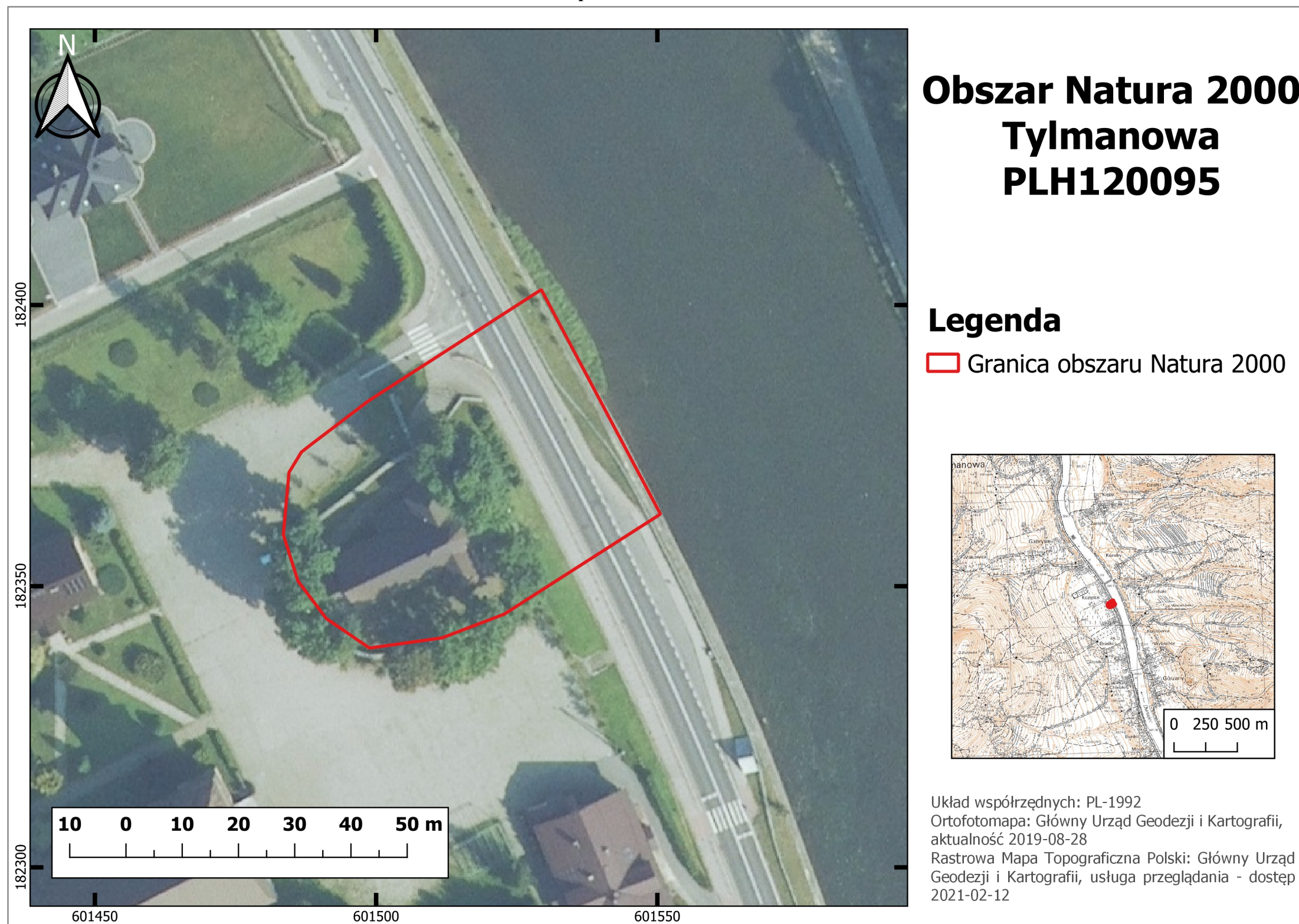
Mapa obszaru Natura 2000