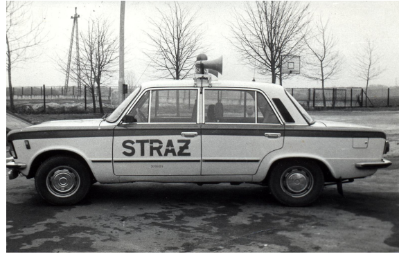
Fiat 125p SOP