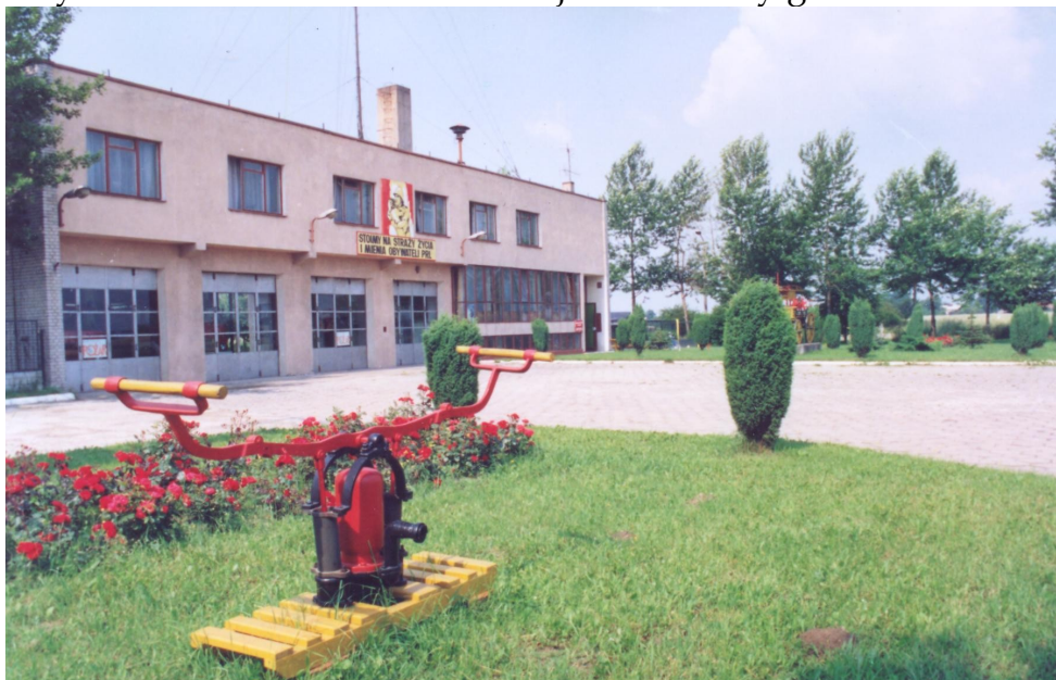
Zdjęcie Komendy Rejonowej Straży Pożarnej w Koluszkach wybudowanej w 1975r.

11 lipca 1975 roku następuje bardzo długo oczekiwana chwila przekazania do użytku nowego budynku strażnicy Komendy Rejonowej Straży Pożarnych oraz jednostki taktycznej Zawodowej Straży Pożarnej. Już następnego dnia załoga rozpoczęła zagospodarowywanie i urządzenie poszczególnych pomieszczeń budynku oraz przenoszenie się z dotychczasowej siedziby, którą była remiza Ochotniczej Straży Pożarnej. Przeprowadzka ta, spowodowała zmianę obsady kierowców samochodów bojowych miejscowej OSP. Z chwilą wyprowadzenia się strażaków zawodowych, Ochotnicza Straż Pożarna zmuszona była zapewnić we własnym zakresie kierowców na swoje samochody gaśnicze.