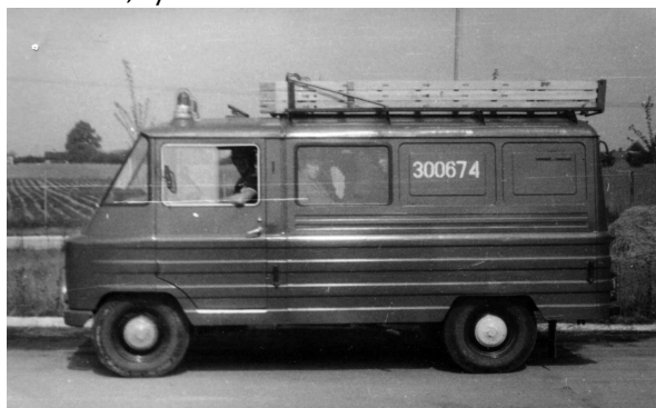
Żuk 151 GLM