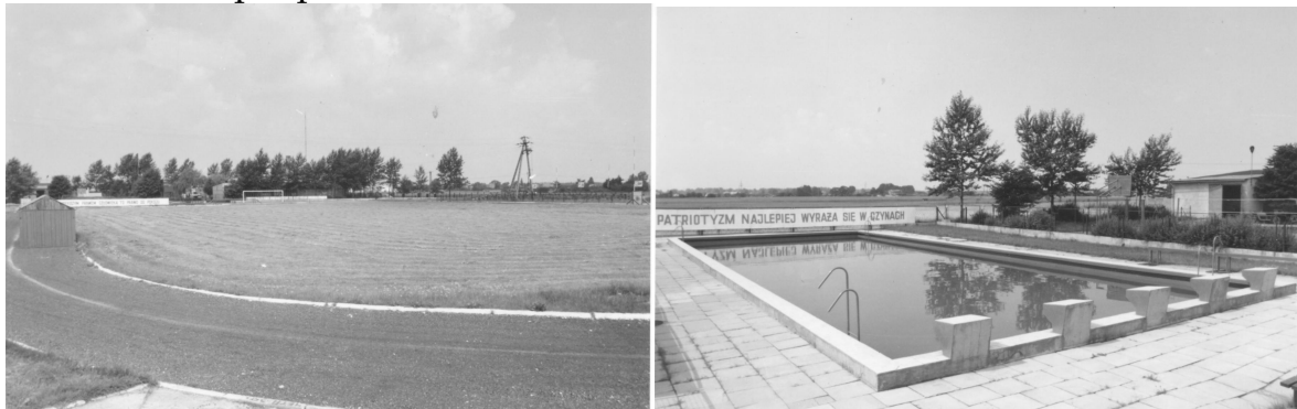
Stadion sportowy na terenie KRSP i wybudowany w pobliżu zbiornik p-poż

Wiosną 1983 r. rozpoczęto budowę stadionu. Znaczny wkład pracy wnieśli tu również strażacy z KRSP. W ramach czynów społecznych przepracowali ponad 1800 roboczogodzin na łączną wartość 129.901 zł. W budowie stadionu bardzo dużo pomógł ówczesny Komendant Wojewódzki Straży Pożarnych w Piotrkowie płk poż. Edmund Kocoń.