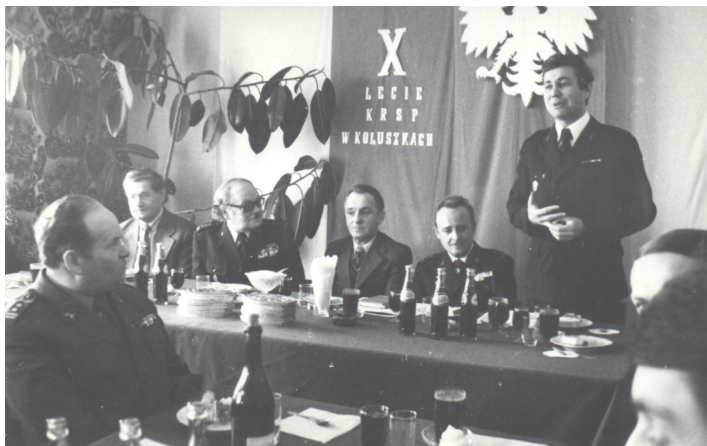
Zaproszeni goście na X-lecie KRSP w Koluszkach