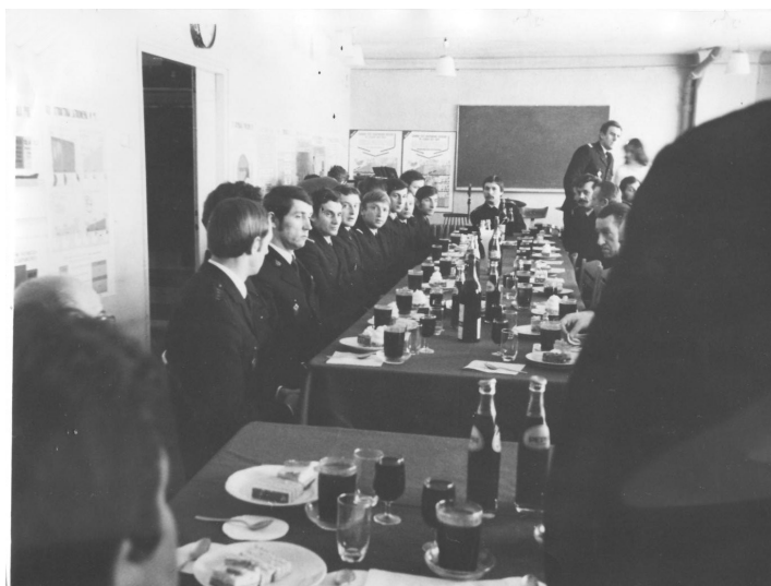
Pracownicy KRSP podczas uroczystości X-lecia KRSP