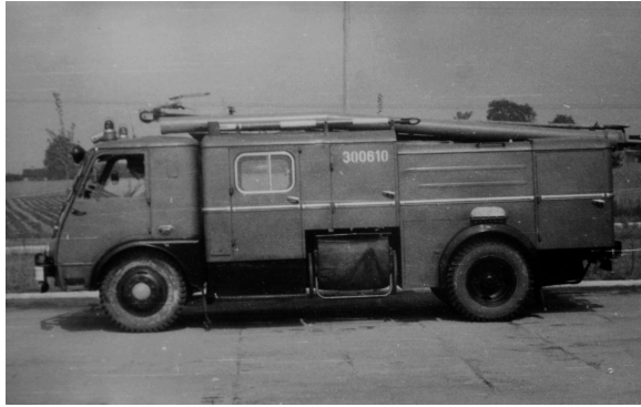
GBM Star 25