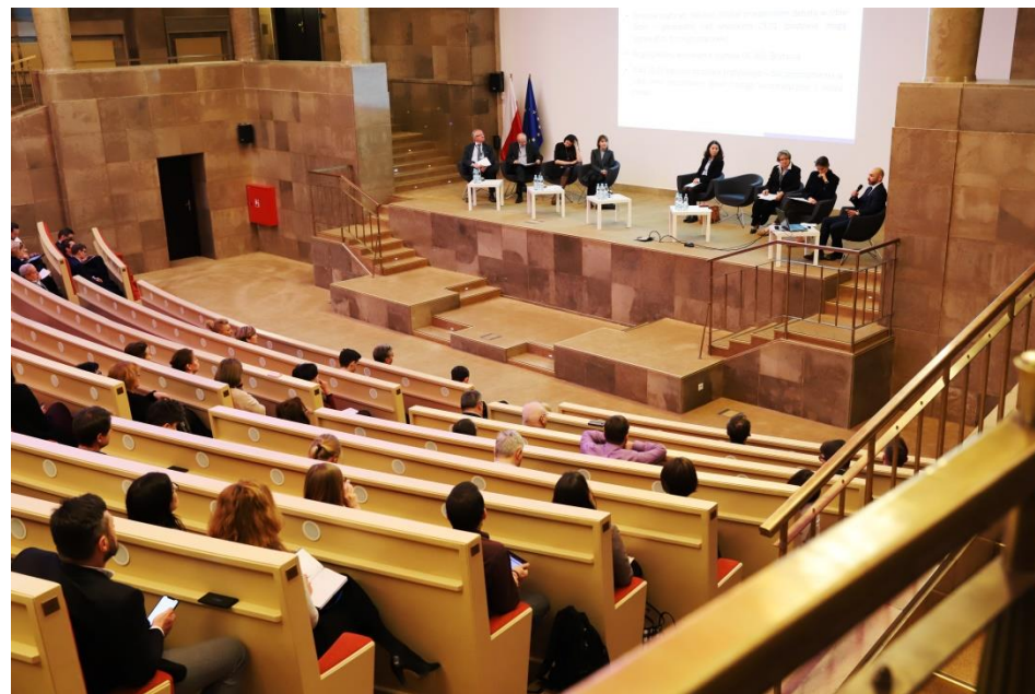
Foto: Spotkanie z przedsiębiorcami ws. brexitu w dn. 24.01.2019