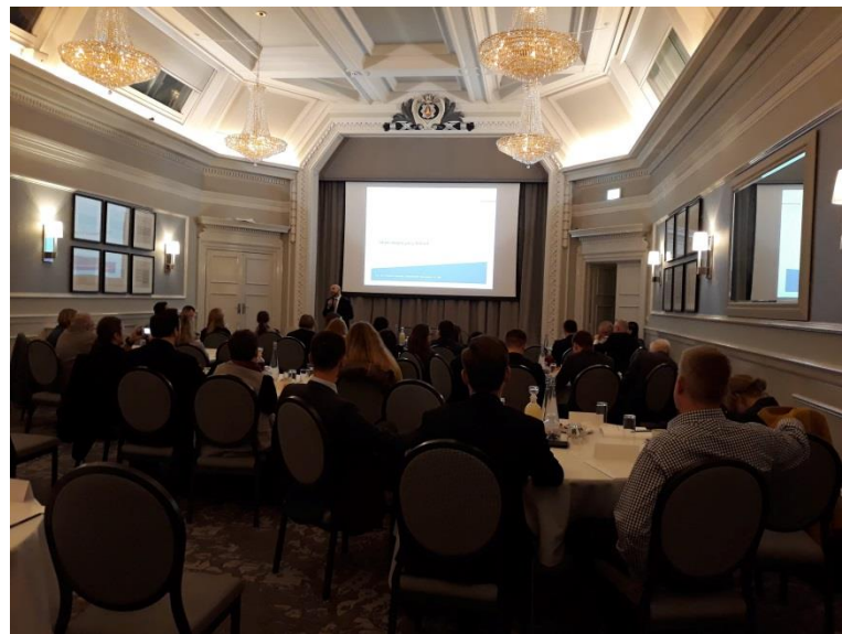
Foto: Spotkanie w Edynburgu z polskimi przedsiębiorcami w dn. 4 marca 2019 r