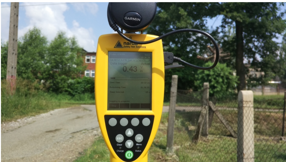
Fot. 4. Urządzenie pomiarowe w trakcie prowadzonego badania