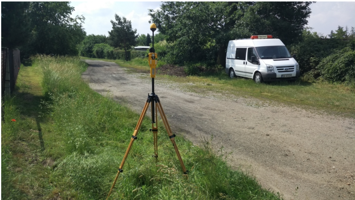
Fot. 3. Rejon badań, widok w kierunku południowo-zachodnim