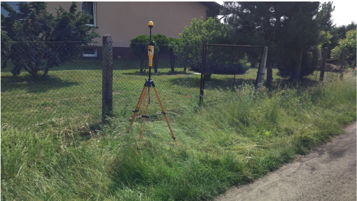
Fot. 2. Rejon badań, widok w kierunku wschodnim