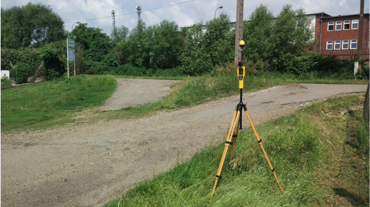
Fot. 1. Rejon badań, widok w kierunku północno-zachodnim