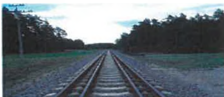
Splot torowy na Litwie. Różnica szerokości między prześwitem „europejskim” a „radzieckim” jest zbyt mała, by można było stosować tor trójszynowy, dlatego też zastosowano splot czteroszynowy – pociągi 1435 mm korzystają z szyn 2 i 4, pociągi 1520 mm – z 1 i 3.