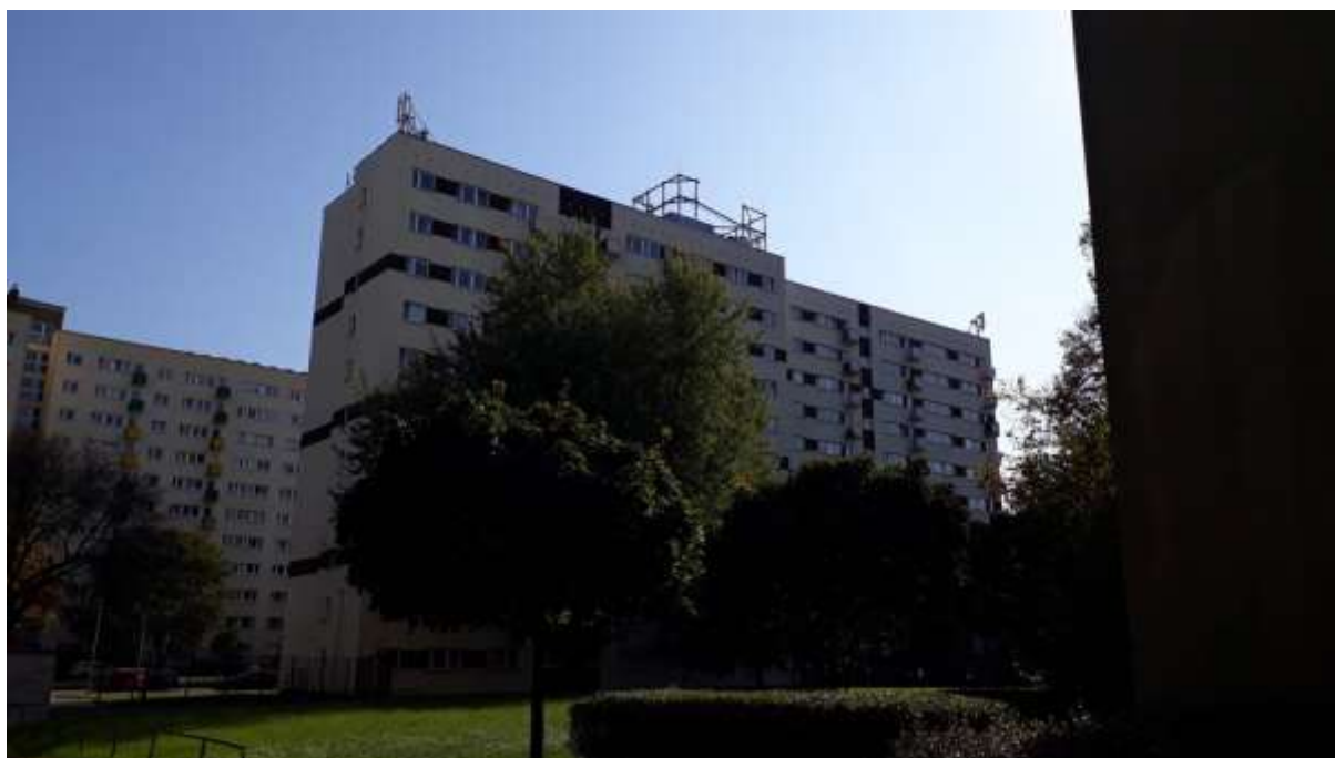
Fot. 1: Widoki anten stacji bazowej ID: 14976, zlokalizowanej: ul. Bokserska 36, 02-682 Warszawa