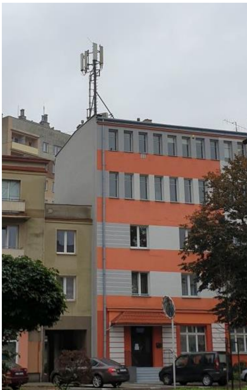
Fot. 1: Widok anten stacji bazowej: ID: 58187 (20187), zlokalizowanej pod adresem: ul. Hetmańska 15, 35-045 Rzeszów