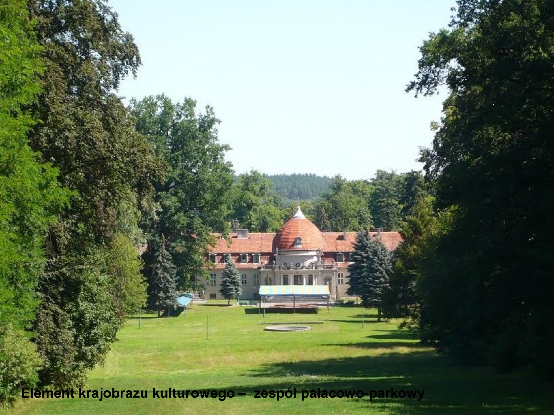
Element krajobrazu kulturowego – zespół pałacowo-parkowy