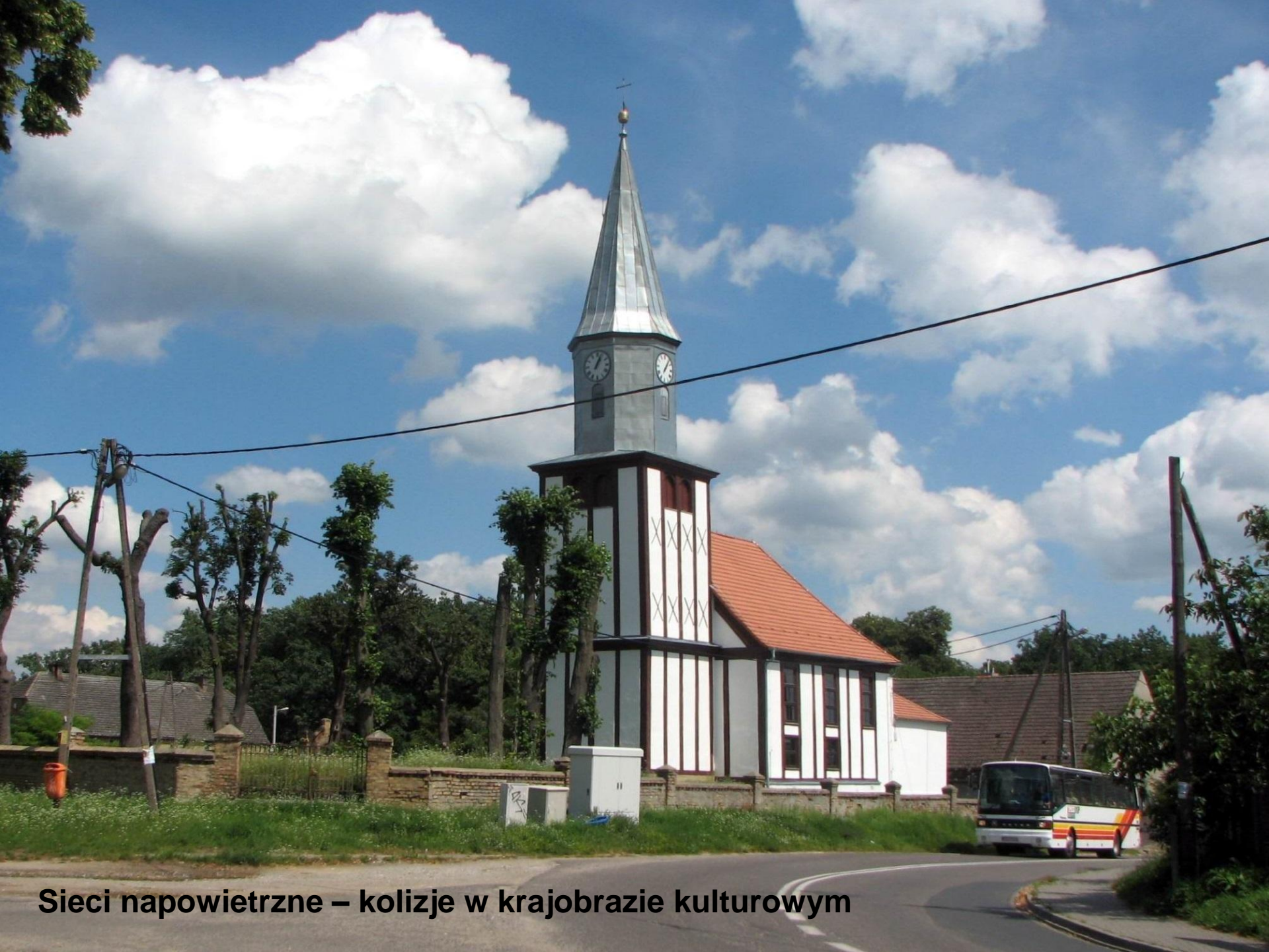
Sieci napowietrzne – kolizje w krajobrazie kulturowym