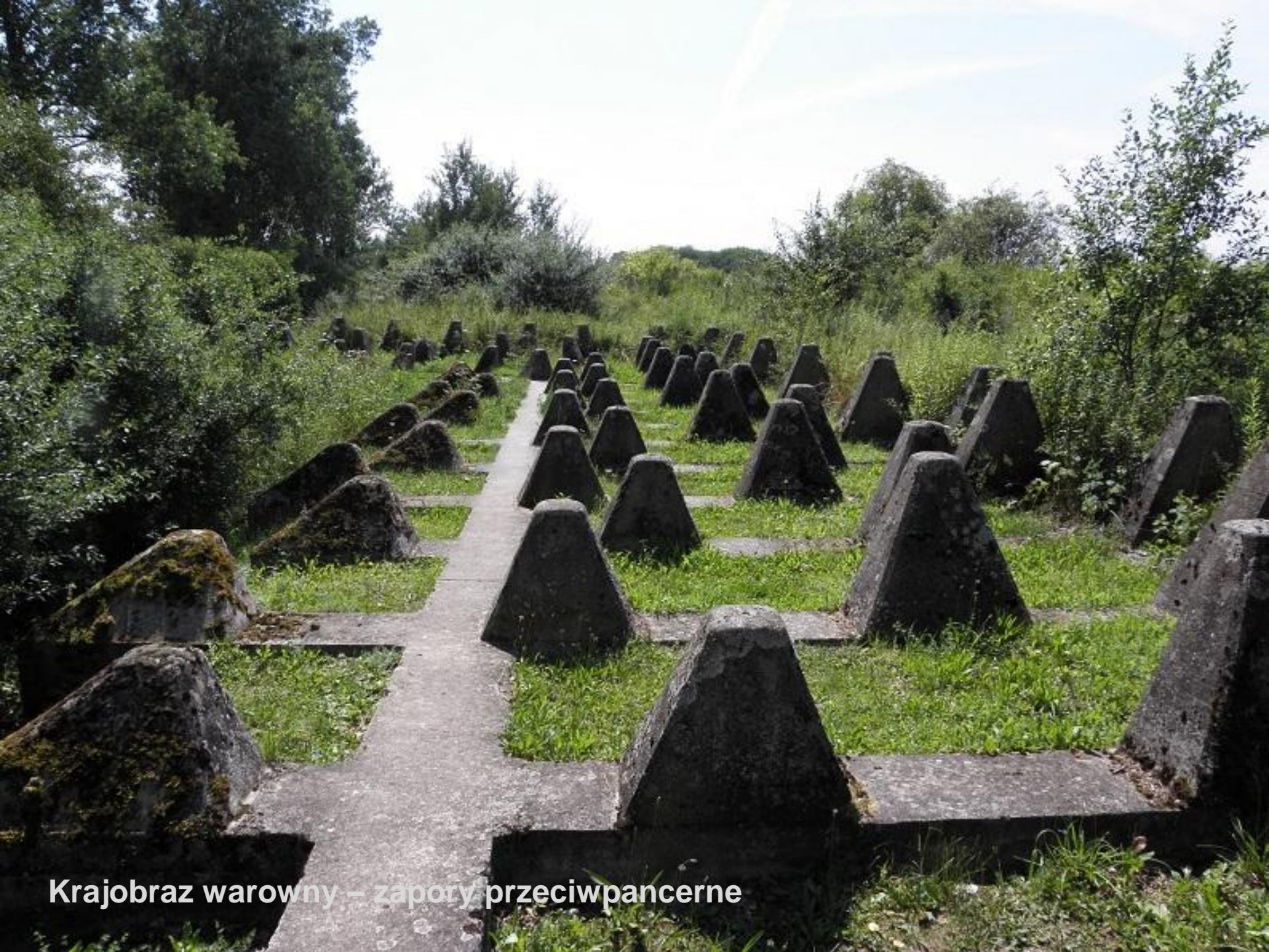
Krajobraz warowny – zapory przeciwpancerne