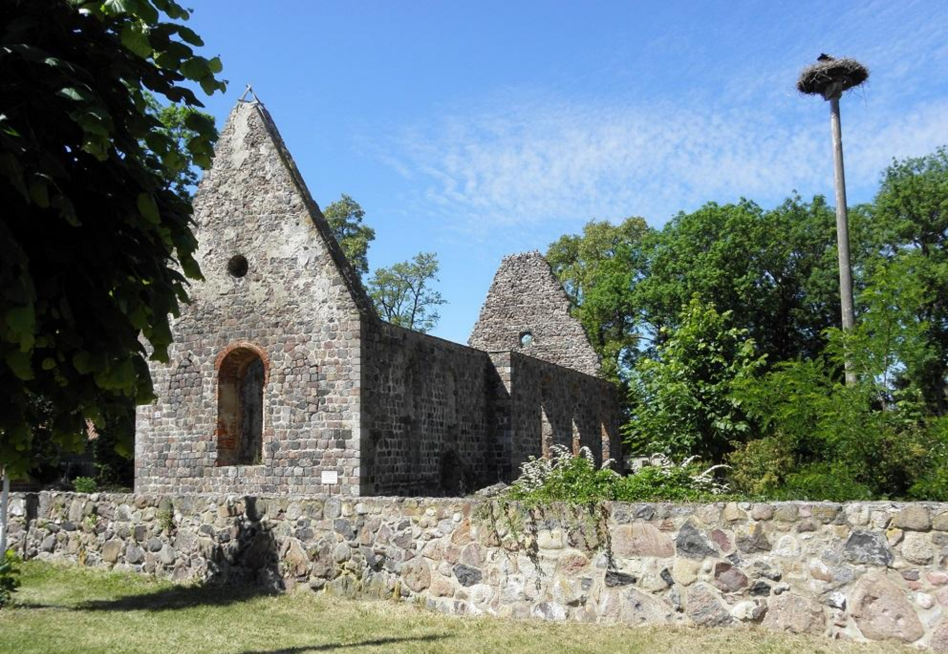
Element krajobrazu kulturowego – ruina kościoła