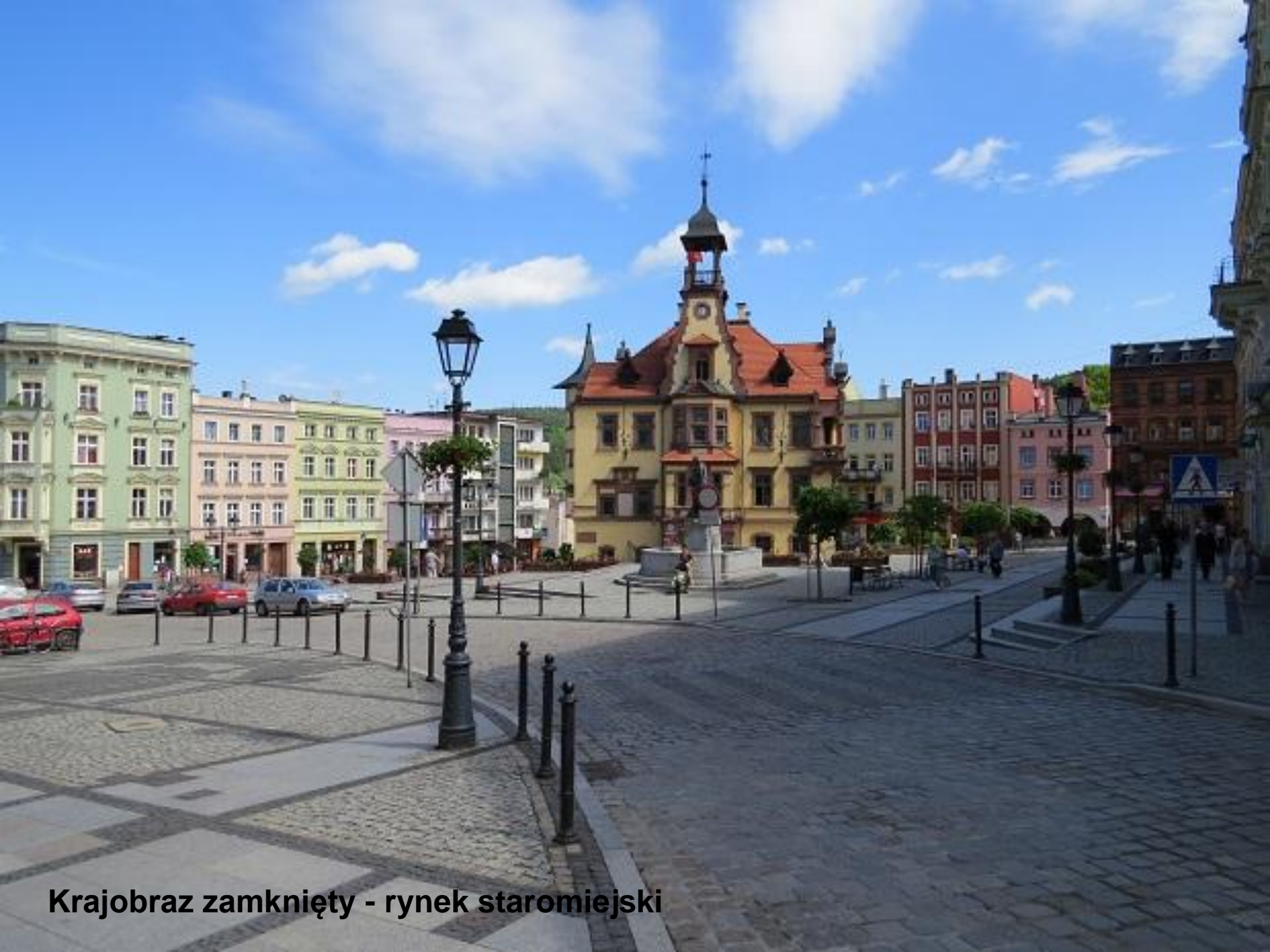
Krajobraz zamknięty - rynek staromiejski