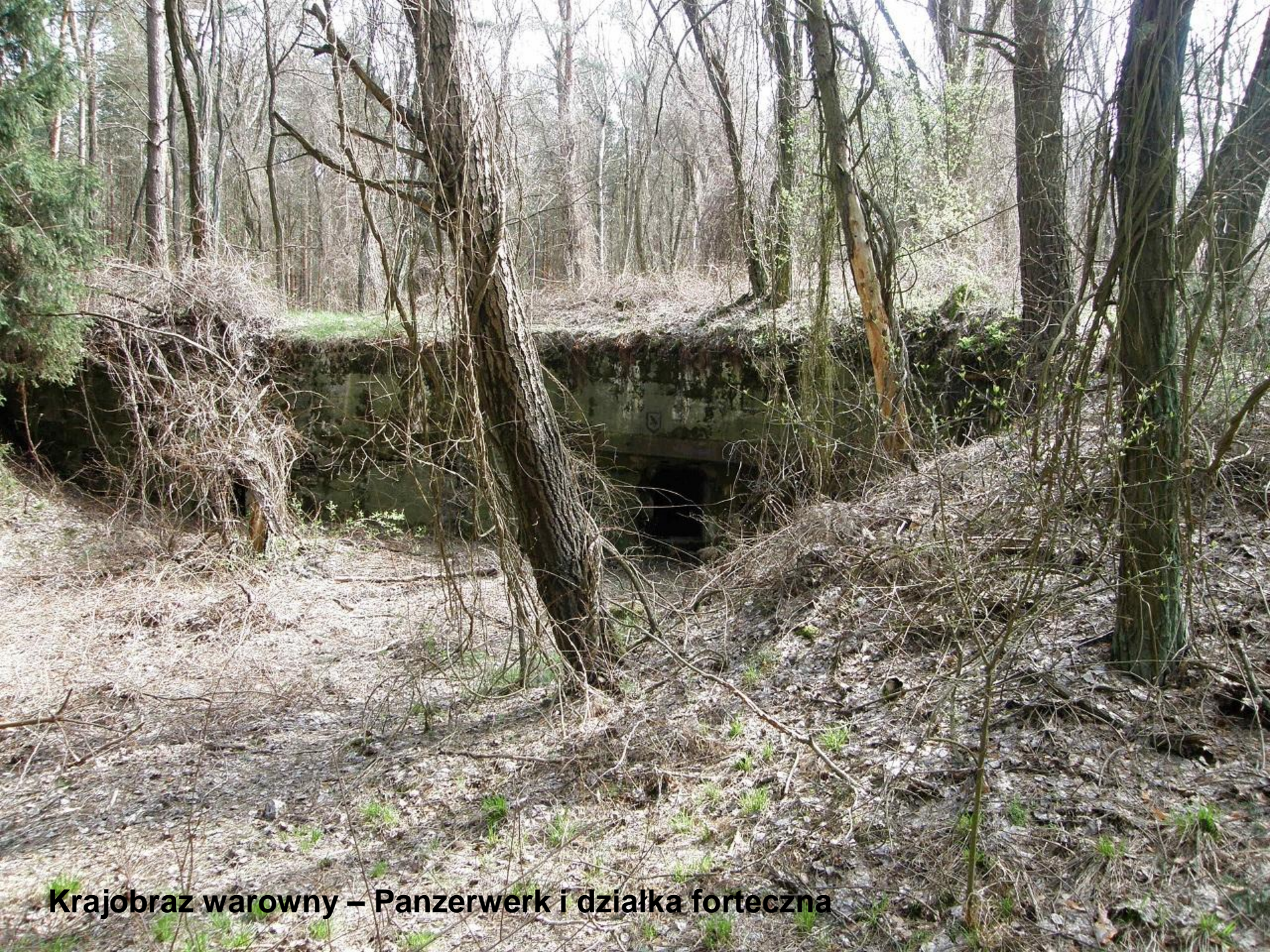
Krajobraz warowny – Panzerwerk i działka forteczna