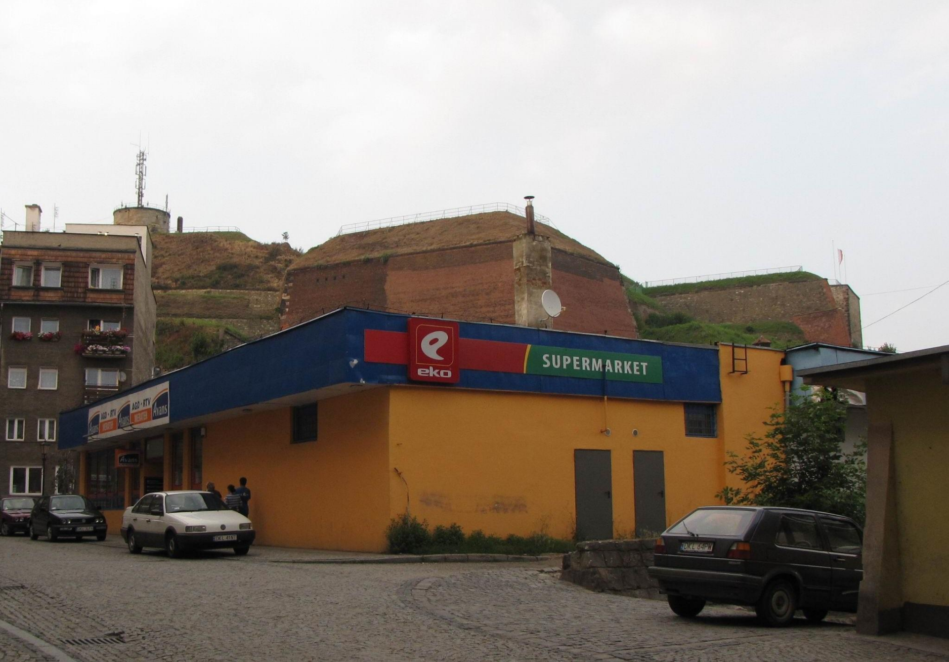
Obiekty budowlane – kolizje w krajobrazie kulturowym