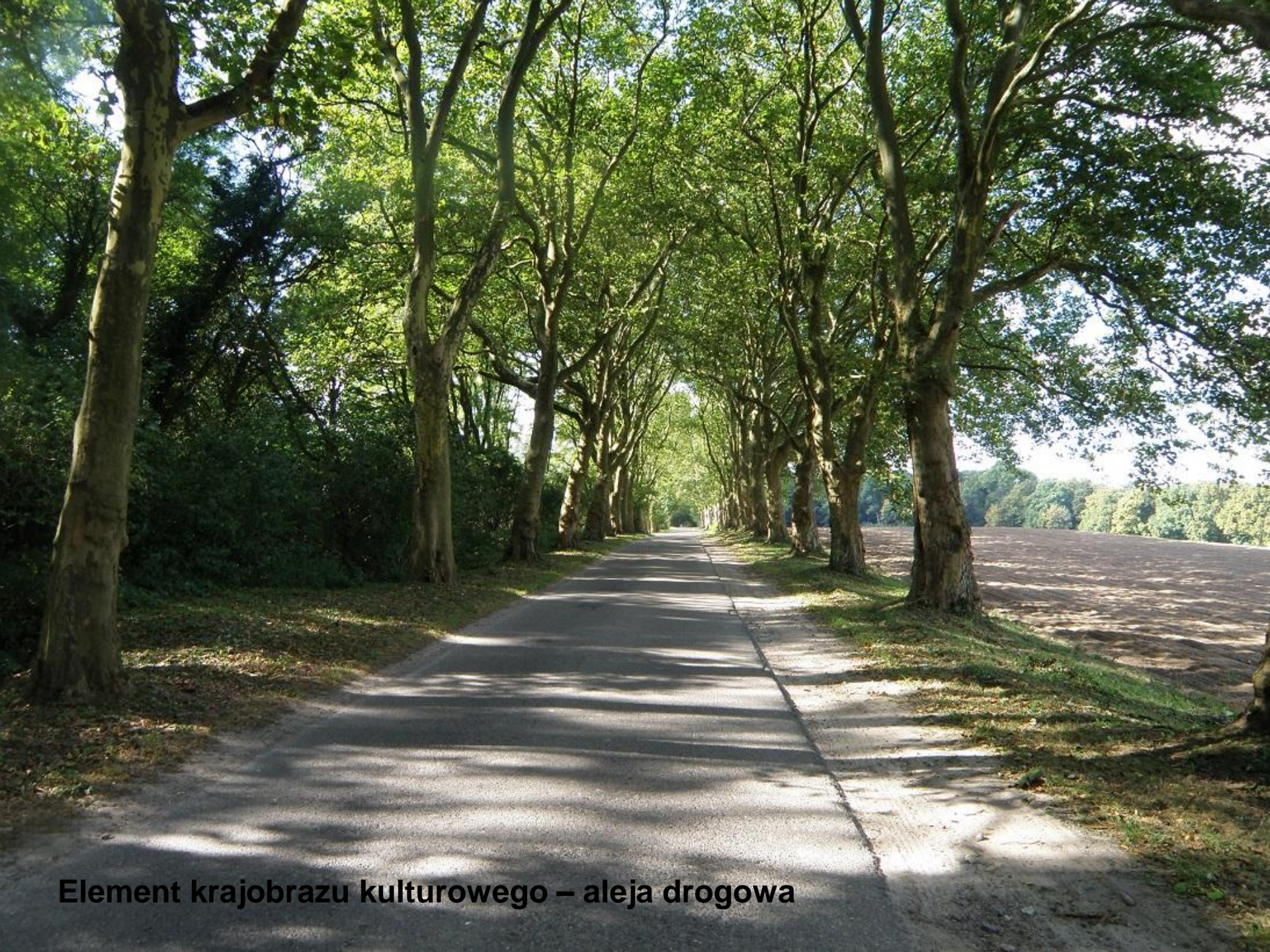
Element krajobrazu kulturowego – aleja drogowa