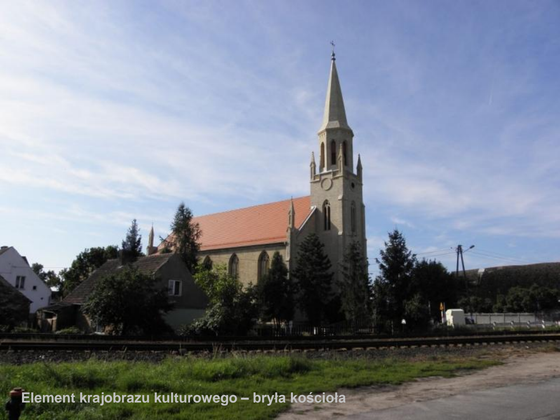
Element krajobrazu kulturowego – bryła kościoła