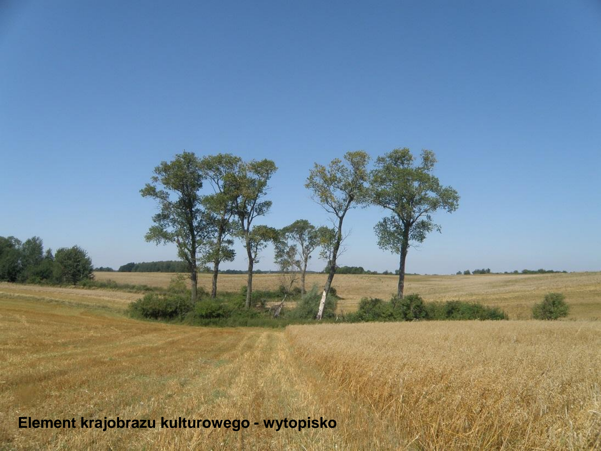
Element krajobrazu kulturowego - wytopisko