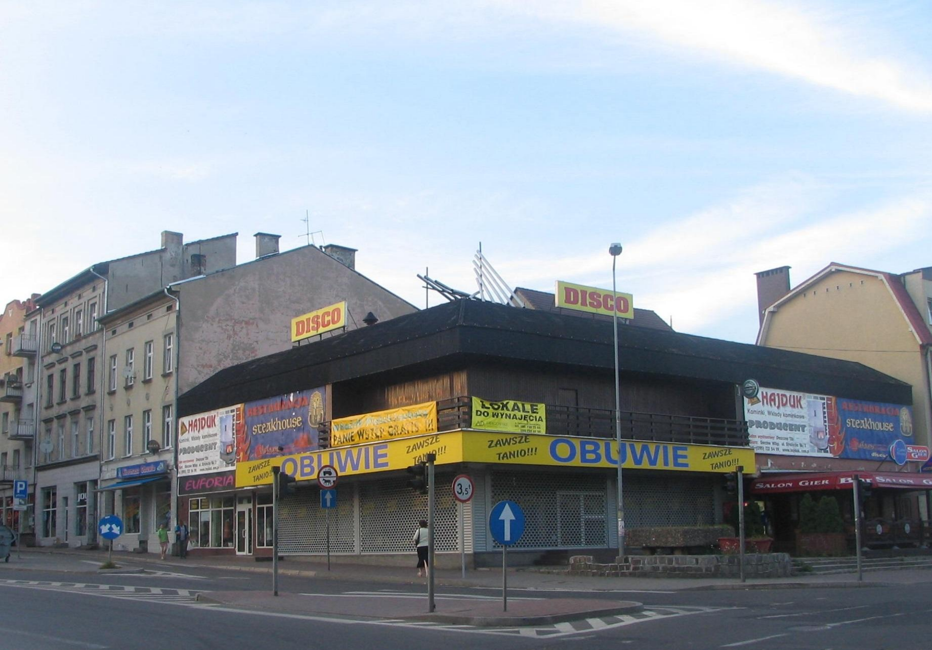
Reklama – oddziaływanie w krajobrazie kulturowym