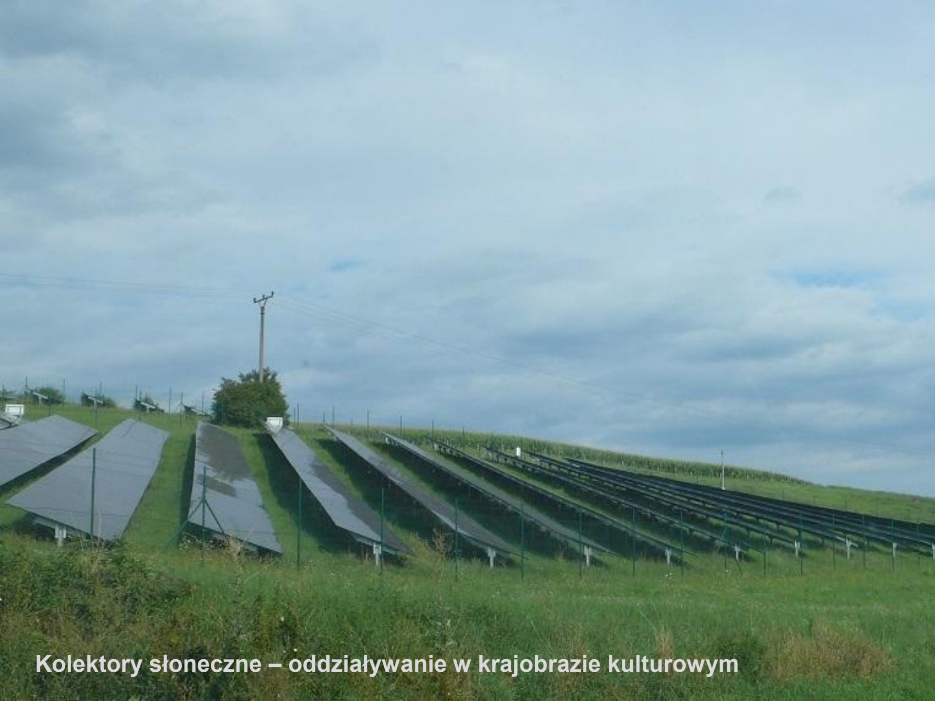
Kolektory słoneczne – oddziaływanie w krajobrazie kulturowym