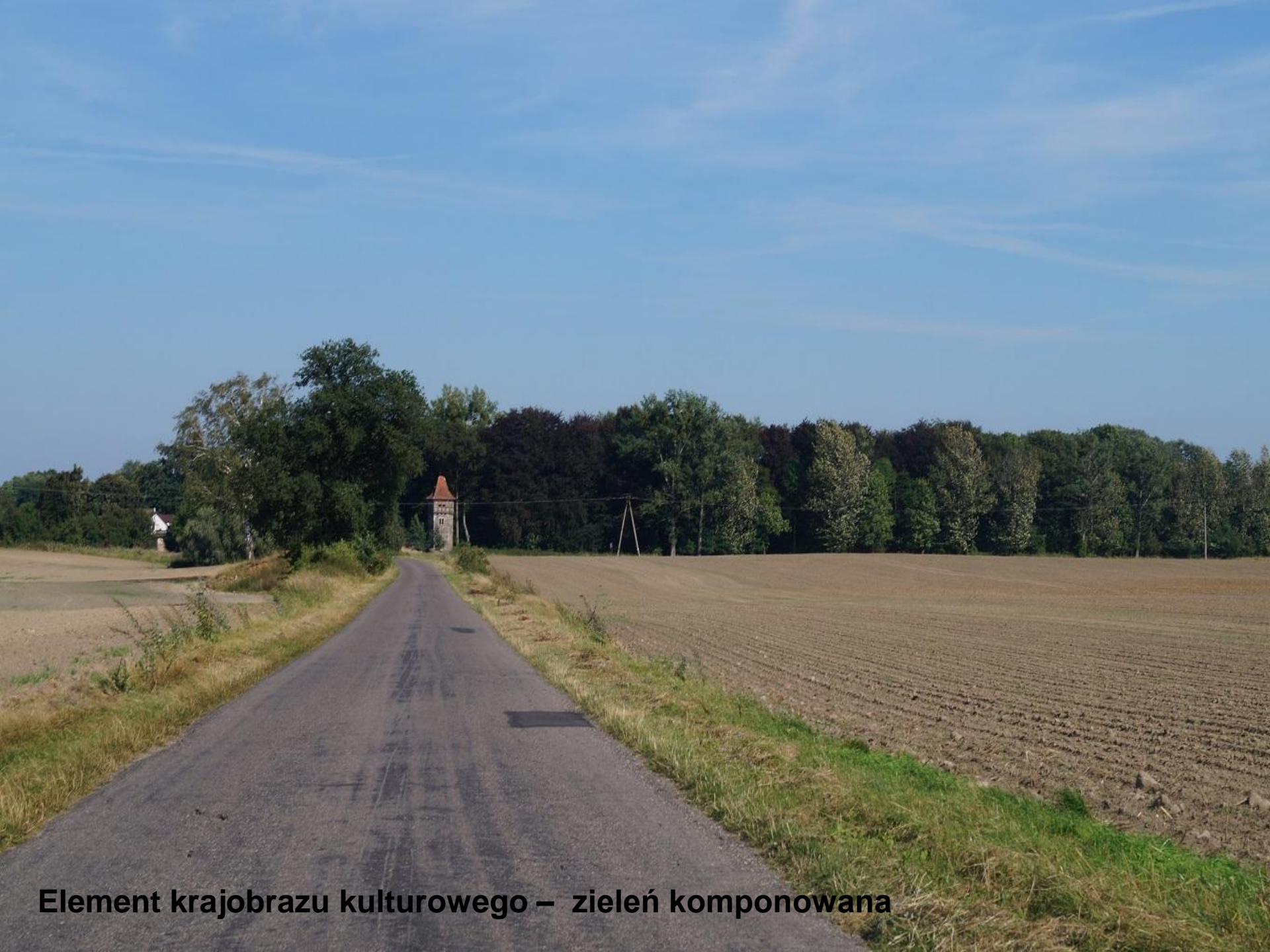
Element krajobrazu kulturowego – zieleń komponowana