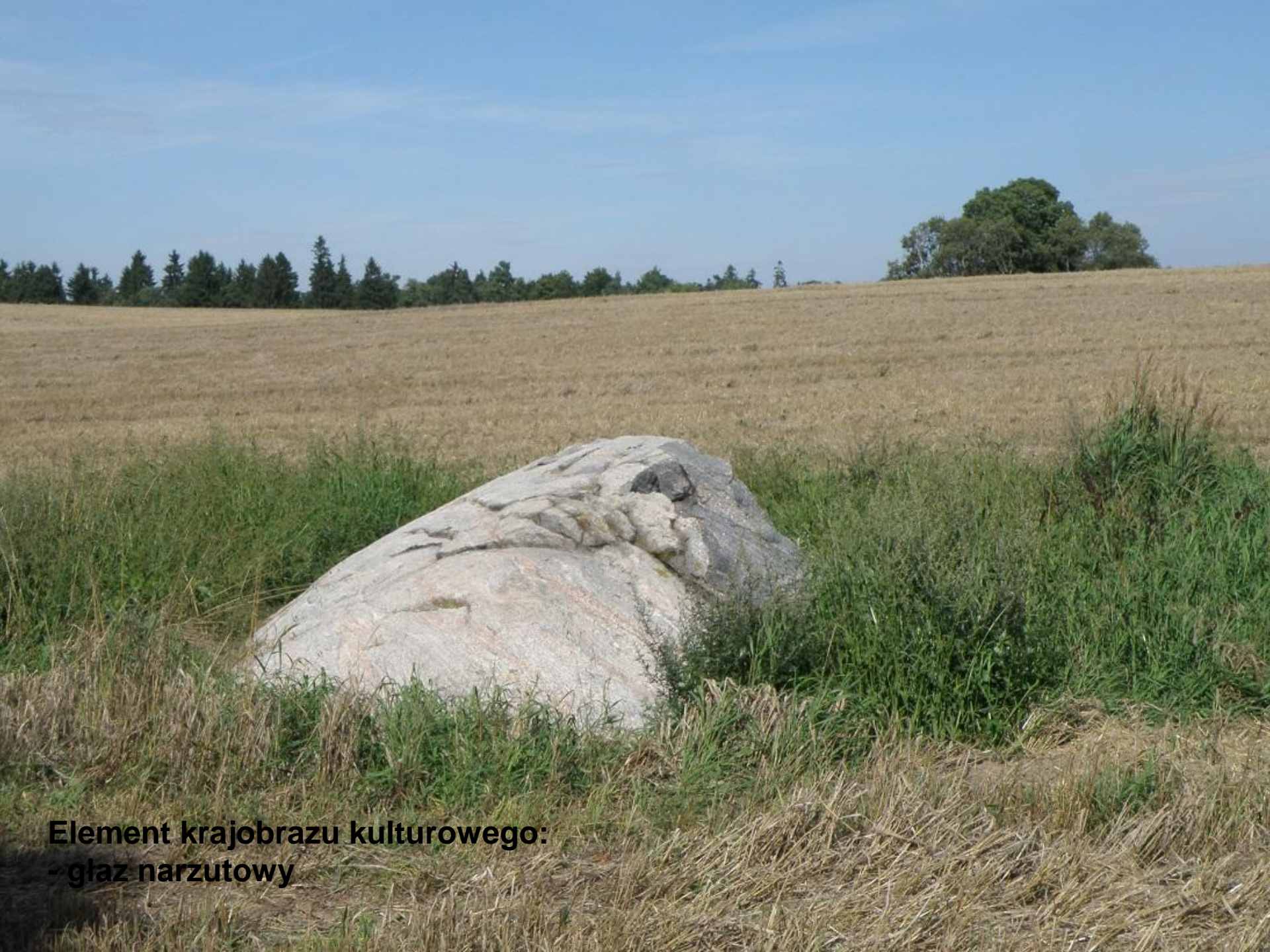
Element krajobrazu kulturowego: - glaz narzutowy