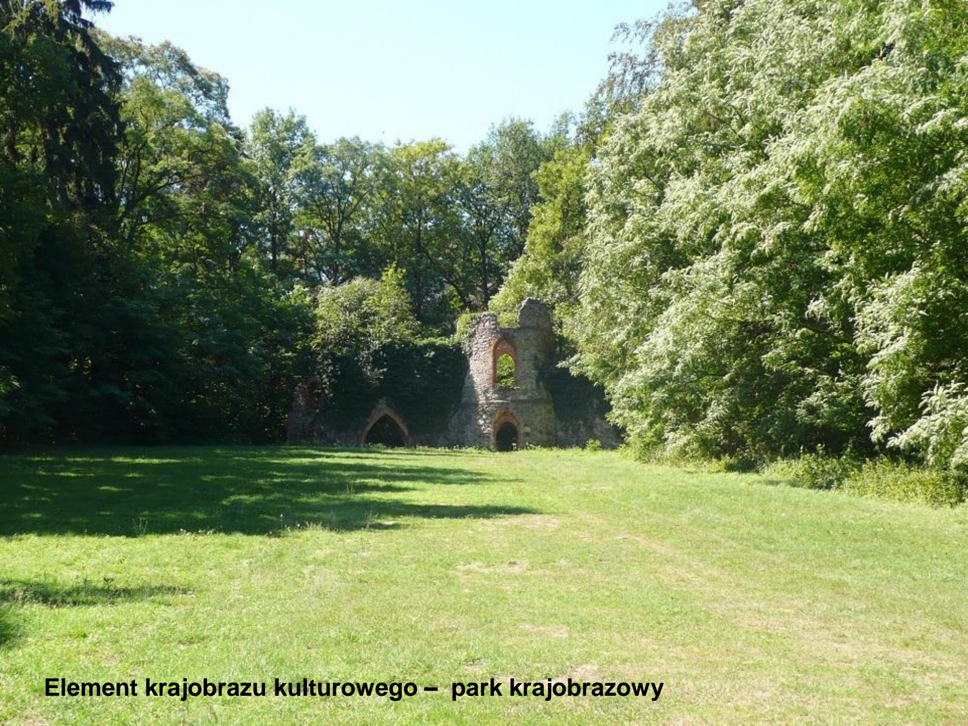
Element krajobrazu kulturowego – park krajobrazowy