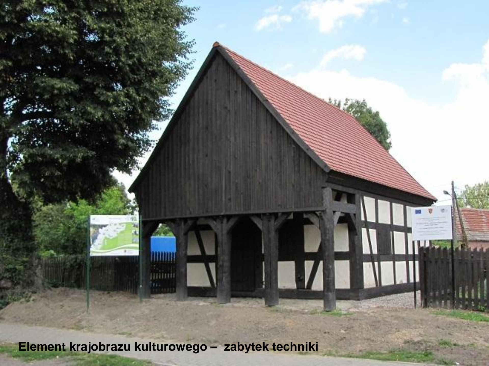
Element krajobrazu kulturowego – zabytek techniki