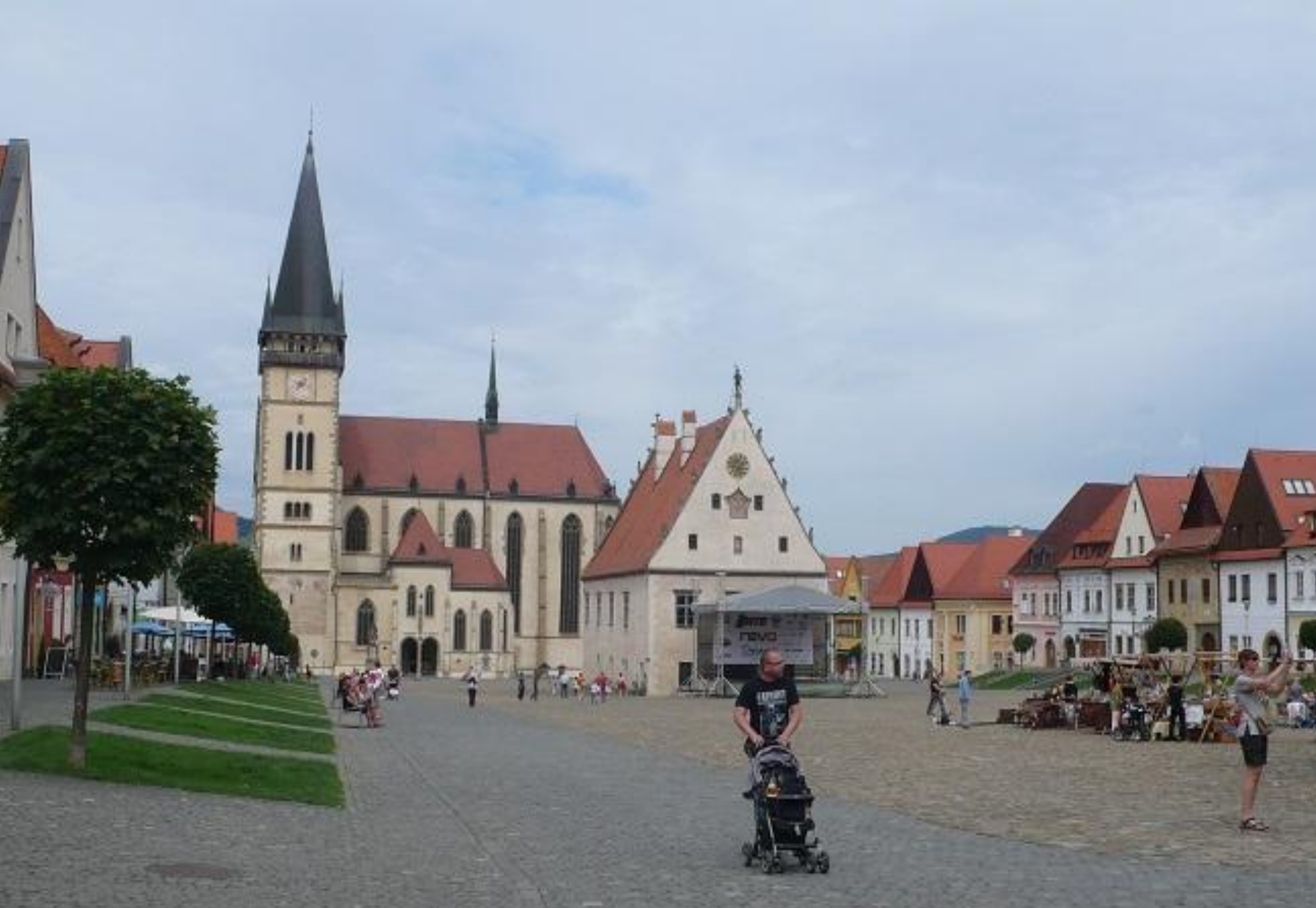
Krajobraz zamknięty - rynek staromiejski