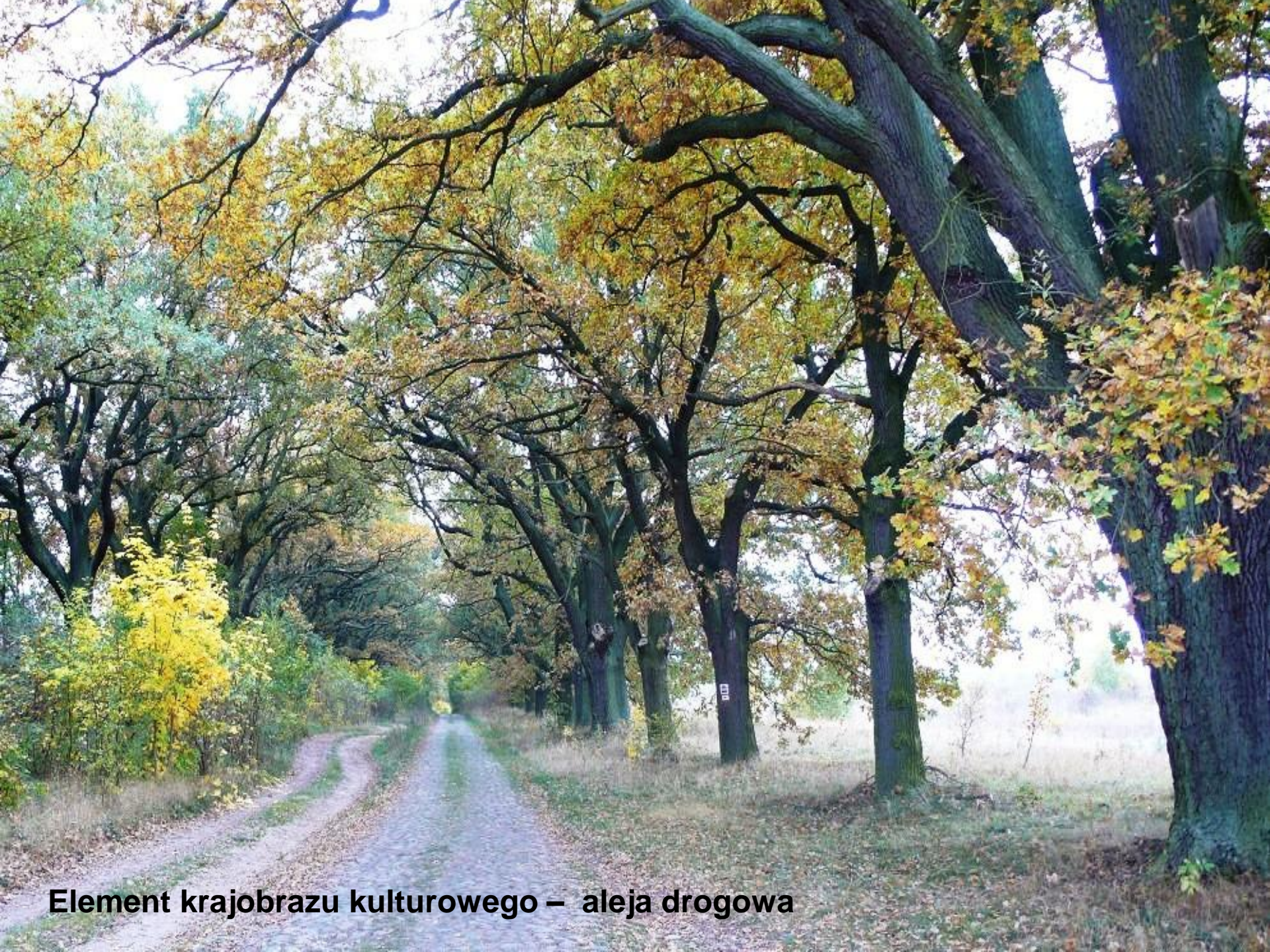
Element krajobrazu kulturowego – aleja drogowa