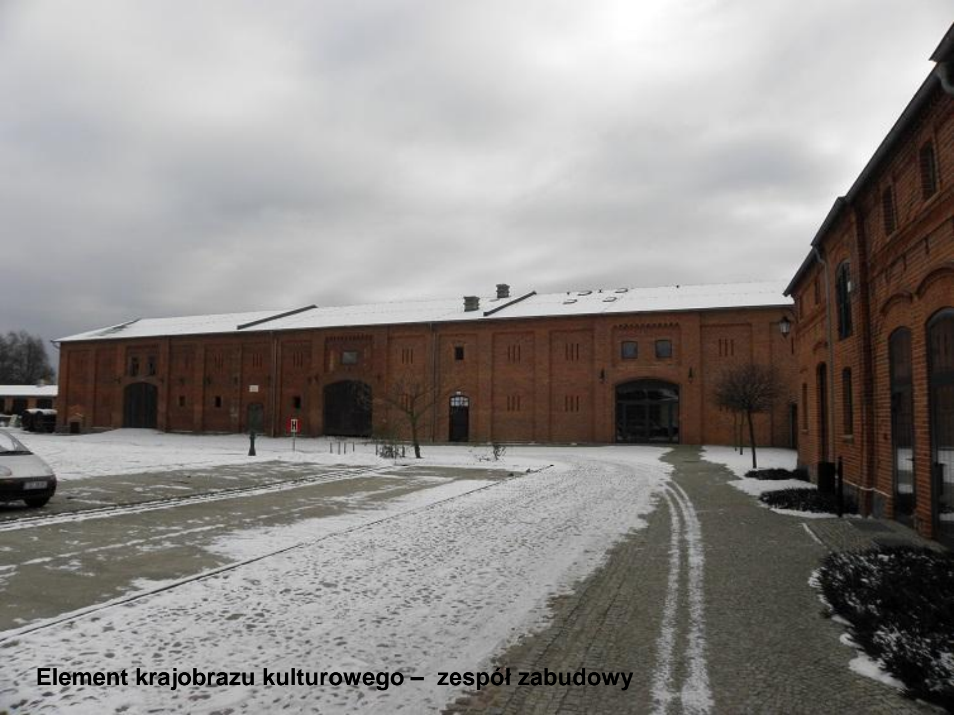
Element krajobrazu kulturowego – zespół zabudowy