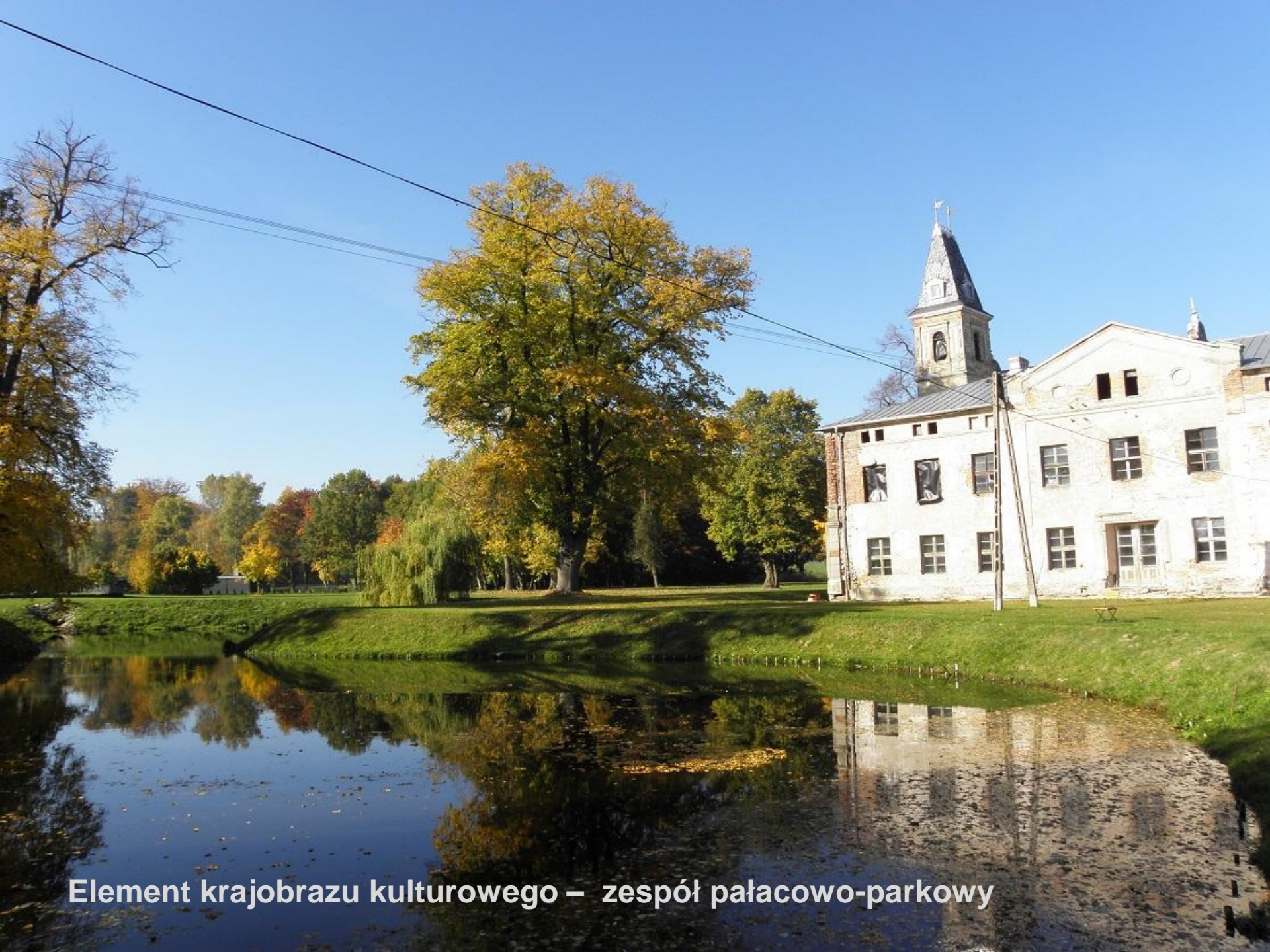
Element krajobrazu kulturowego – zespół pałacowo-parkowy