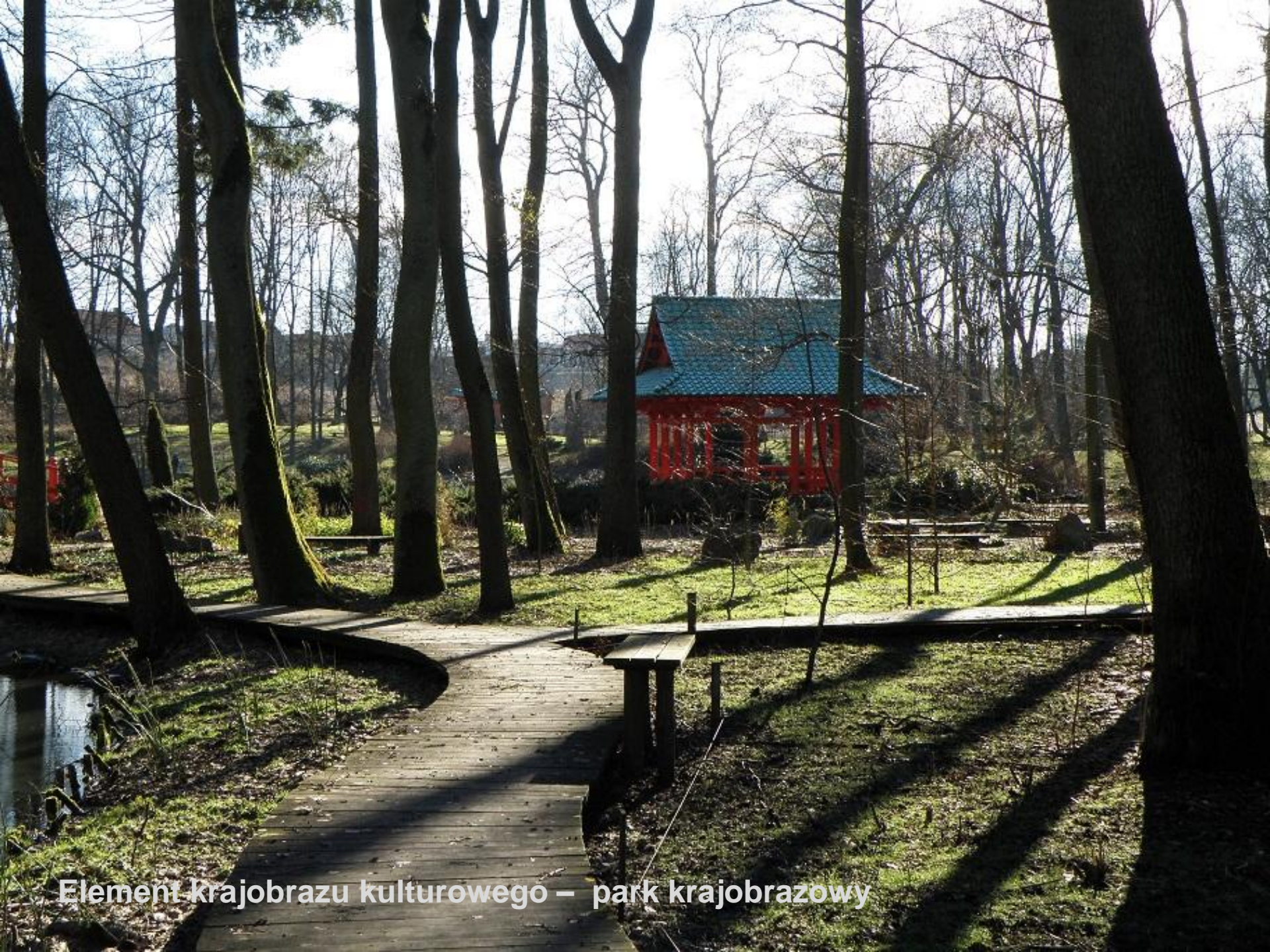
Element krajobrazu kulturowego – park krajobrazowy