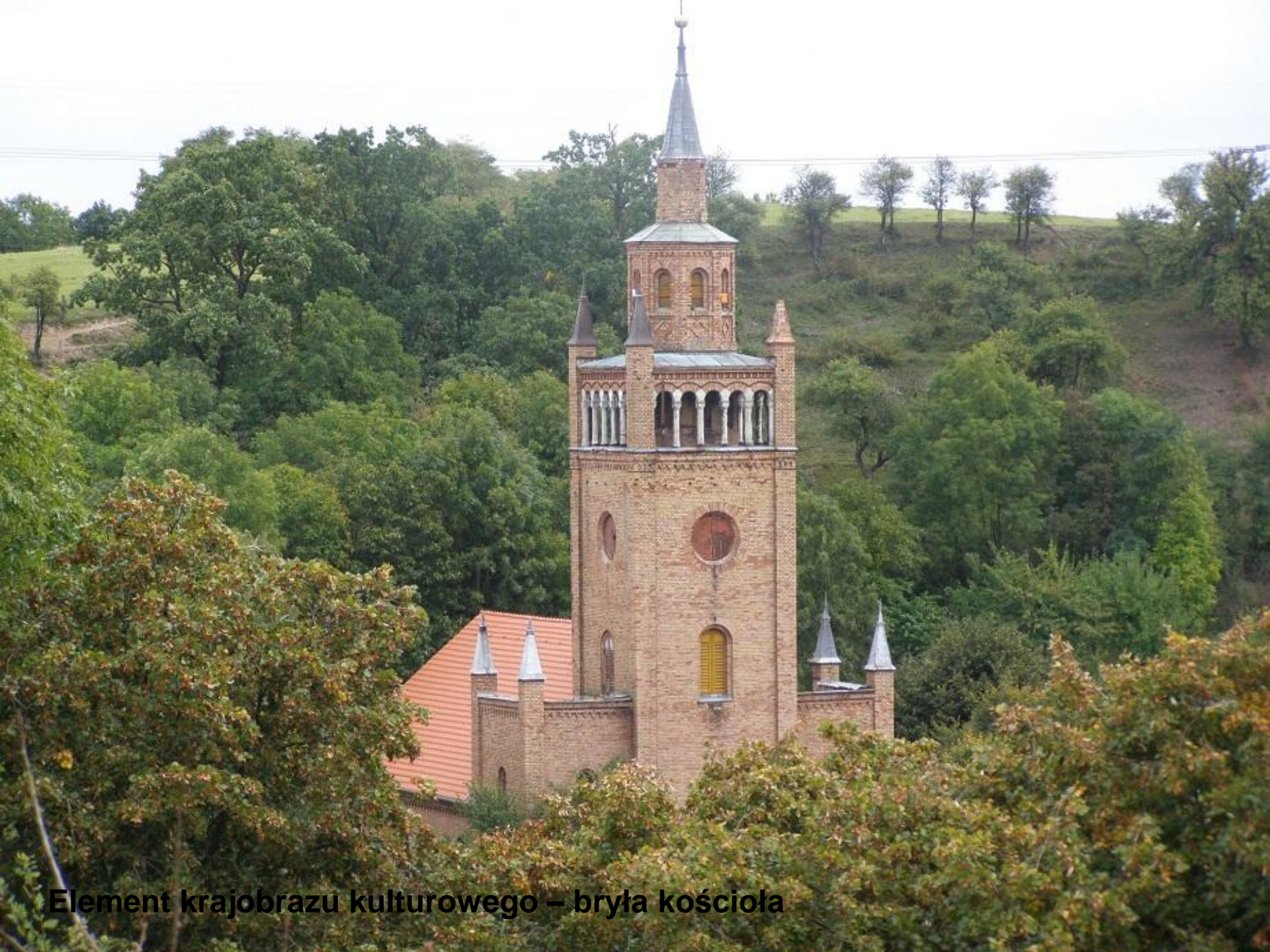
Element krajobrazu kulturowego – bryła kościoła