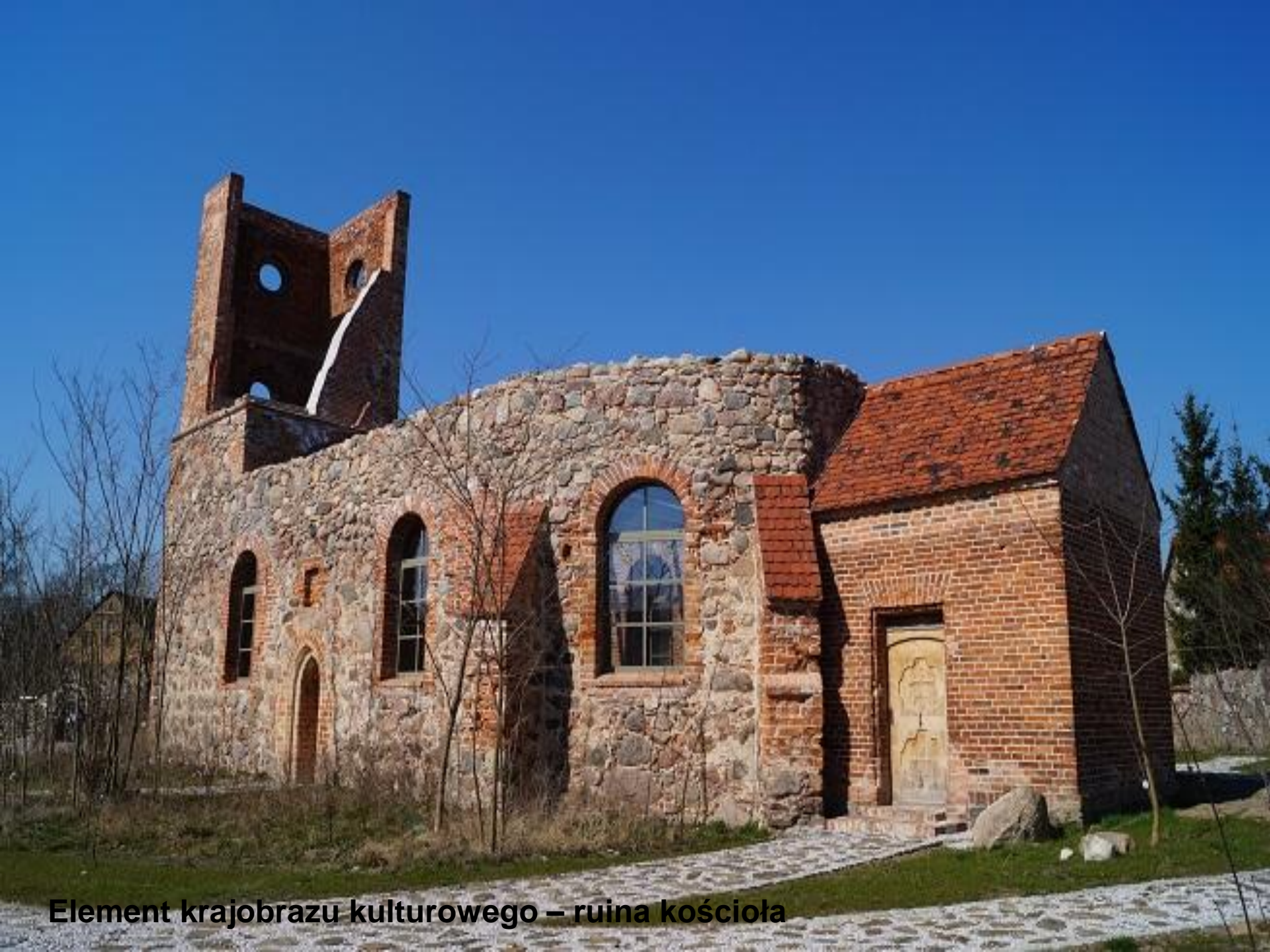
Element krajobrazu kulturowego – ruina kościoła