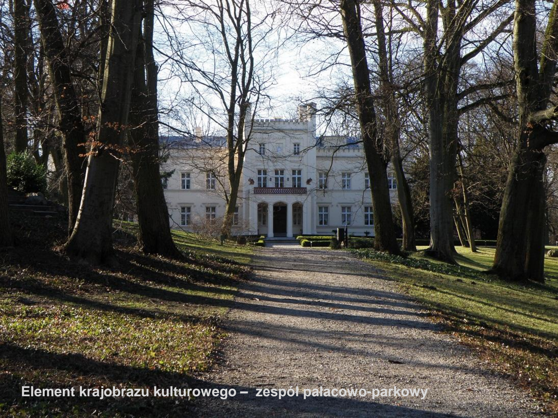
Element krajobrazu kulturowego – zespół pałacowo-parkowy