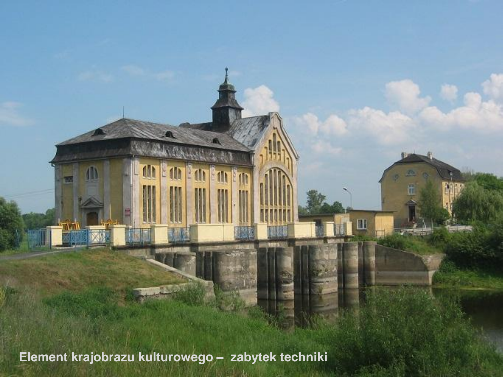
Element krajobrazu kulturowego – zabytek techniki