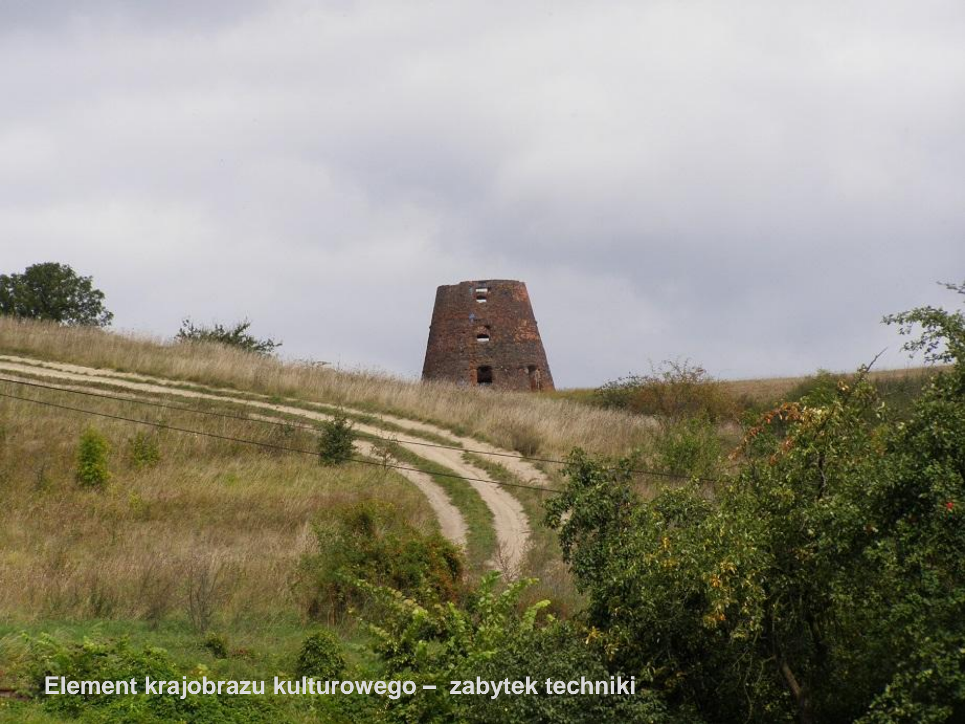
Element krajobrazu kulturowego – zabytek techniki