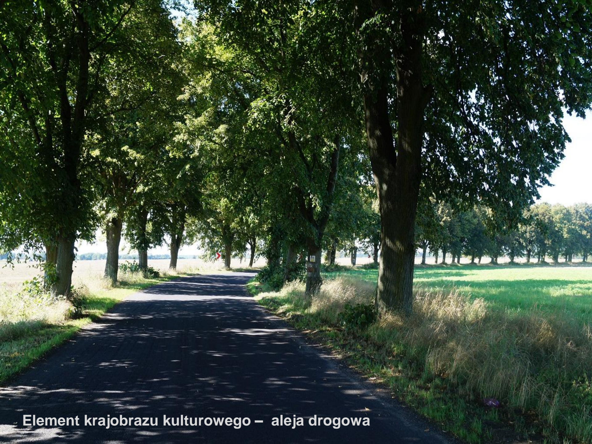
Element krajobrazu kulturowego – aleja drogowa