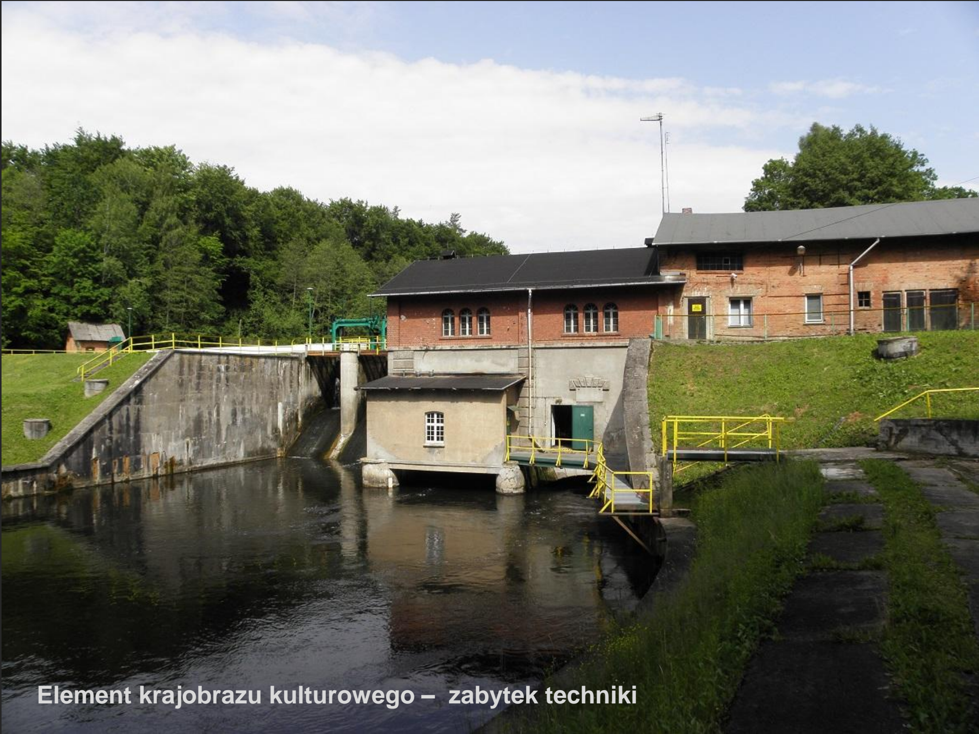
Element krajobrazu kulturowego – zabytek techniki