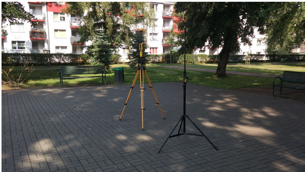
Fot. 3. Rejon badań, widok w kierunku zachodnim