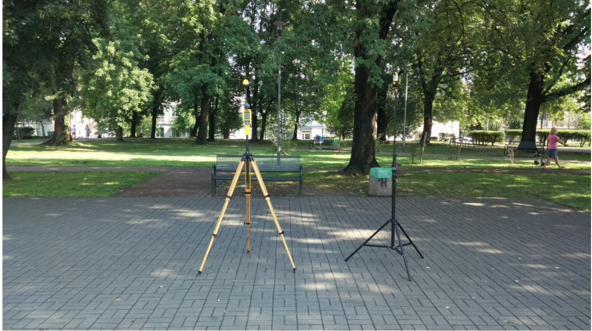
Fot. 1. Rejon badań, widok w kierunku północnym