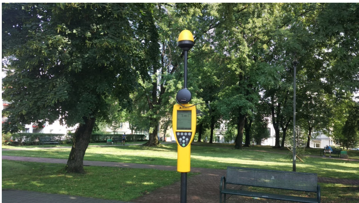
Fot. 4. Przyrząd pomiarowy w trakcie prowadzonego badania