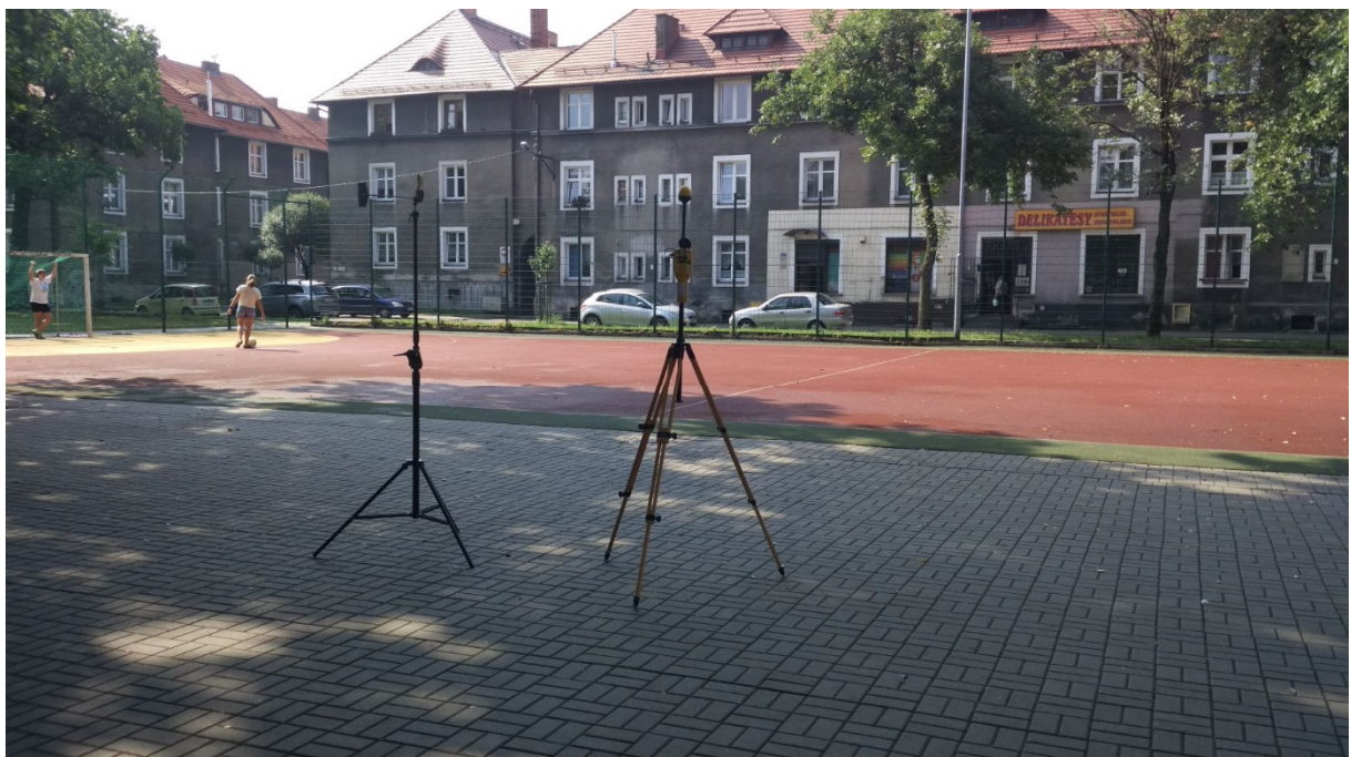
Fot. 2. Rejon badań, widok w kierunku południowo-wschodnim