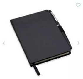
41. Zestaw piśmienniczy