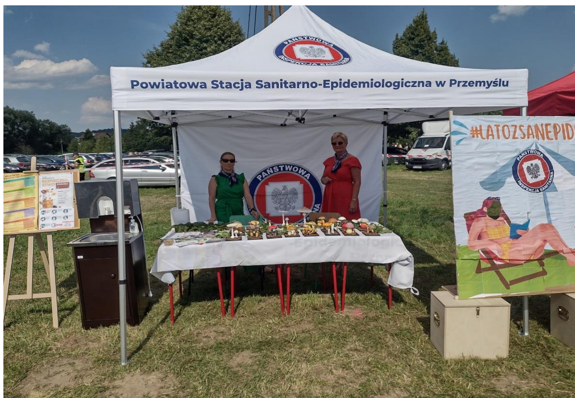
Zdjęcie 1. Święto pieroga w Ostrowie