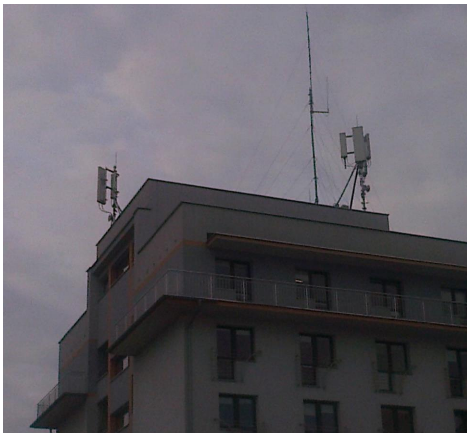
Fot. 1: Widok anten stacji bazowej ID: BIA1001_C, zlokalizowanej od adresem: ul. Poleska 89, 15-874 Białystok.