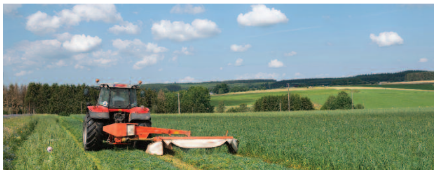
W 2023 r. rolnicy nie będą musieli w ramach normy DKR 7 realizować zmianowania upraw na gruntach ornych