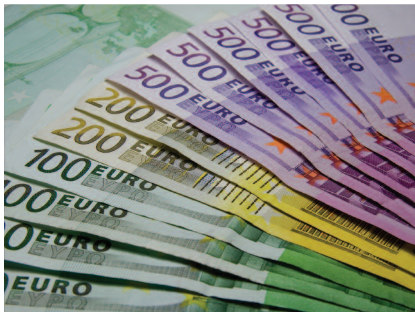
Budżet Planu Strategicznego to ponad 25 mld euro