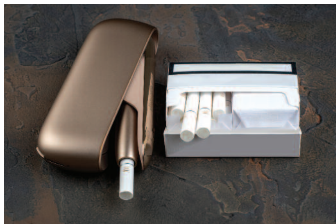
Producenci wyrobów tytoniowych do podgrzewania przez 12 miesięcy od dnia wejścia w życie ustawy będą mogli wytwarzać takie wyroby bez wpisu do rejestru producentów wyrobów tytoniowych

● uproszczenie i doprecyzowanie procedur uzyskiwania wpisu oraz zmiany wpisu w tych rejestrach; ● wprowadzenie formularzy w zakresie wpisów do ww. rejestrów lub zmian wpisów w tych rejestrach, co