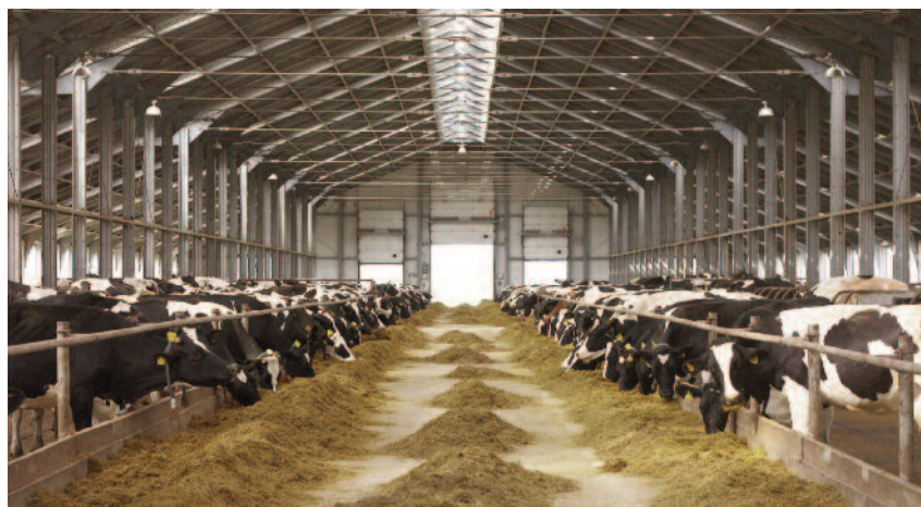
W roku ubiegłym hodowlę bydła mlecznego prowadziły 34 spółki, w których na koniec grudnia utrzymywano 27 561 krów

W 2021 r. hodowlę bydła mlecznego prowadziły 34 spółki, w których na koniec grudnia utrzymywano 27 561 krów. Najwyższy udział w populacji krów posiadała rasa polska holsztyńsko-fryzyjska (26 597 szt.) w dwóch odmianach: czarno-białej (HO) – 24 766 szt. i czerwono-białej (RW) – 1831 szt. Na koniec 2021 r. w stadach spółek nadzorowanych przez KOWR znaj-