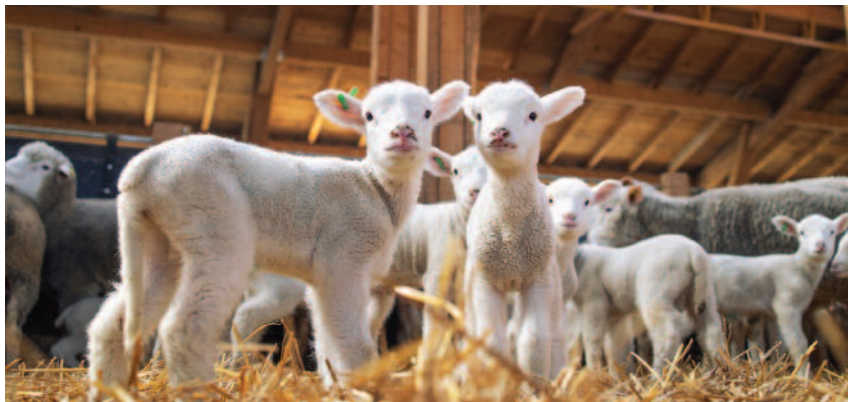
Hodowla owiec i produkcja owczarska prowadzona była w 4 spółkach nadzorowanych przez KOWR

była prowadzona w 3 spółkach, w których znajdowały się 324 lochy objęte oceną. W stadach spółek są hodowane rasy świń wykorzystywane w programie doskonalenia: wielka biała polska (wbp), polska biała zwisłoucha (pbz) oraz duroc. Potwierdzeniem wartości genetycznej świń jest bardzo dobra mięsność tuczników pochodzących z tych hodowli. W 2021 r. sprzedaż materiału hodowlanego z chlewni spółek do dalszej hodowli wyniosła 2818 prosiąt. Ogólna liczba sprzedanych świń wyniosła 10 800 szt., w tym sprzedaż tuczników – 7946 szt.