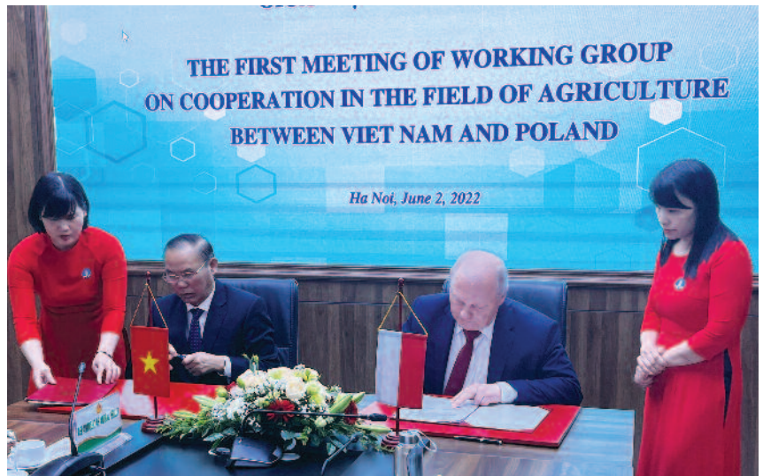
Podpisanie protokołu z I posiedzenia polsko-wietnamskiej grupy roboczej ds. współpracy w dziedzinie rolnictwa