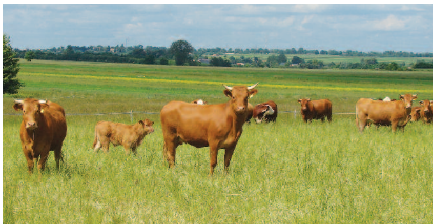
Tematy demonstracji w zakresie produkcji zwierzęcej obejmują m.in. bydło mięsne i mleczne