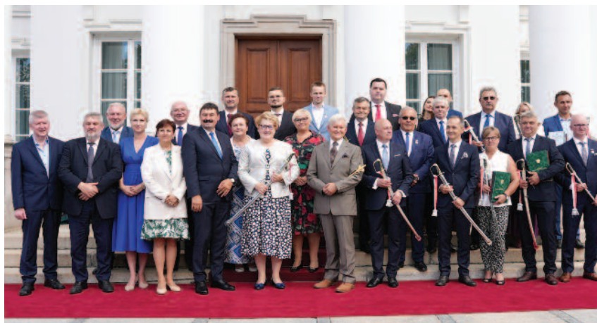
Laureaci Konkursu Agroprzedsiębiorca RP 2021-2022

rolnik radzi sobie doskonale na europejskim rynku, wygrywając coraz częściej konkurencję nawet z krajami starej UE. Produkujemy żywność na najwyższym poziomie, a ludzi przedsiębiorczych w sektorze rolnym nie brakuje – podkreślił sekretarz stanu Ryszard Bartosik. – Mam pełną świadomość, że to dzięki takim ludziom jak Państwo, mamy systematyczny wzrost wartości eksportu rolno-spożywczo-