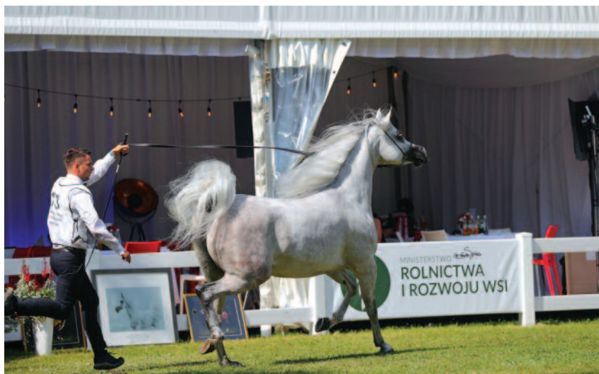
Najlepszym koniem pokazu została czteroletnia klacz El Esmera

Sprzedano 14 koni za kwotę blisko 1,6 mln euro. Janowska stadnina sprzedała 5 koni za kwotę 467 tys. euro, a stadnina w Michałowie 4 konie z wynikiem 901 tys. euro. Jeden koń z Białki został wylicytowany za 115 tys. euro.