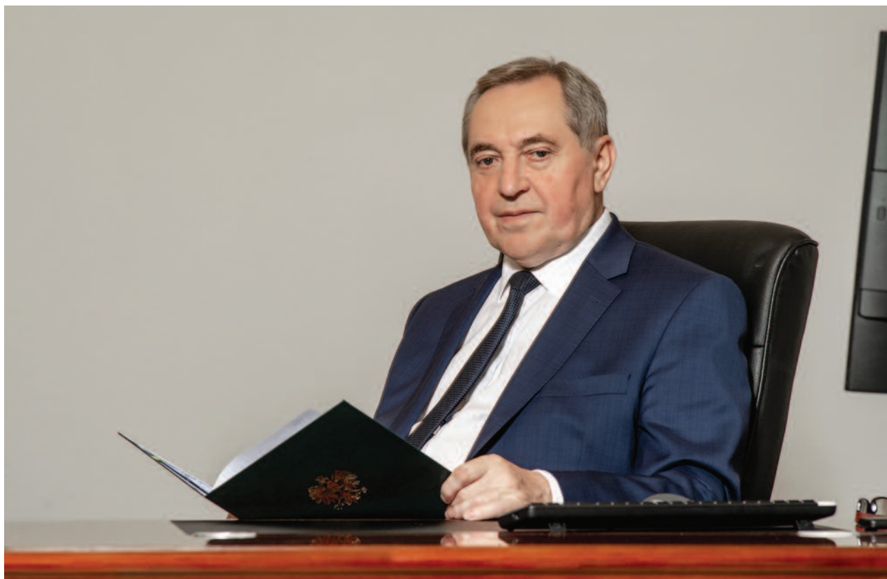
HENRYK KOWALCZYK, wiceprezes Rady Ministrów, minister rolnictwa i rozwoju wsi