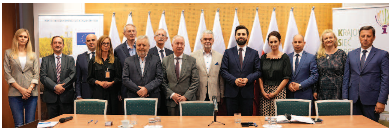
Umowy zostały podpisane z partnerami KSOW, którzy wzięli udział w konkursie na wybór operacji realizowanych w latach 2022-2023