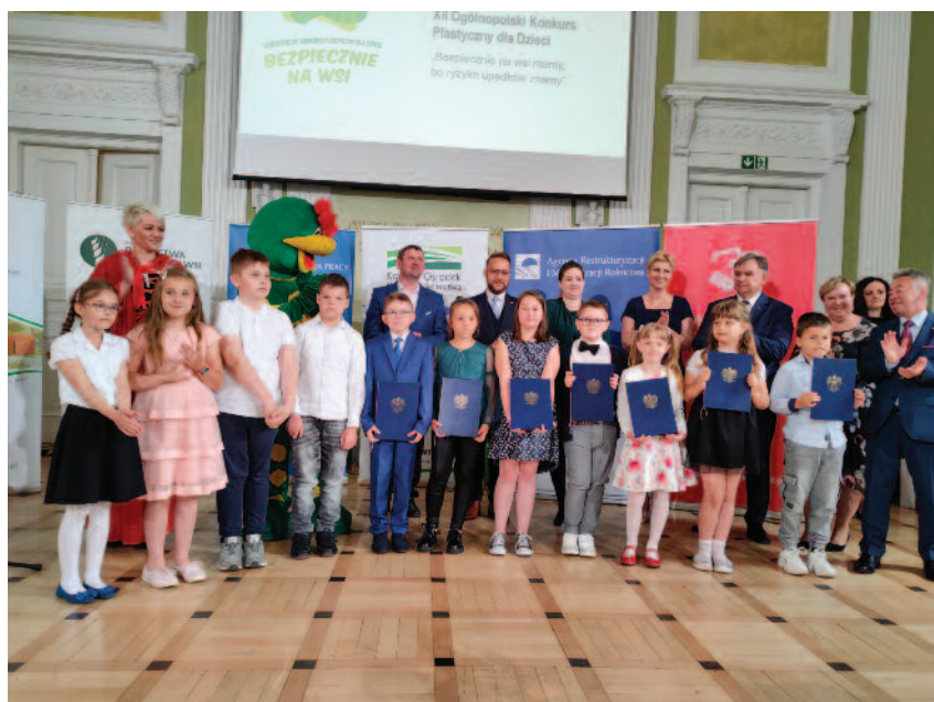
Laureaci XII Ogólnopolskiego Konkursu Plastycznego dla Dzieci

III Ogólnopolski Konkurs dla Dzieci na Rymowankę o Bezpieczeństwie w Gospodarstwie Rolnym przebiegał pod Honorowym Patronatem Ministra Edukacji i Nauki oraz patronatem medialnym TVP Info. Był adresowany do dzieci urodzonych w latach 2008-2011, których przynajmniej jeden z rodziców lub opiekun prawny podlegał ubezpieczeniu społecznemu rolników. Zadanie konkursowe polegało na ułożeniu co najmniej 4-