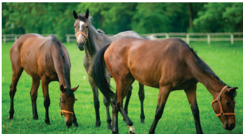
Hodowlą koni zajmuje się 13 spółek oraz 7 jednostek wchodzących organizacyjnie do innych spółek hodowlanych

Na 31 grudnia 2021 r. łączna liczba koni w spółkach wynosiła 2858 szt., w tym 2385 koni hodowlanych. Liczba klaczy elitarnych w stadnich wyniosła 990 szt. Ogółem