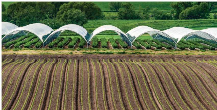
W 2021 r. w spółkach hodowli roślin ogrodniczych hodowla twórcza prowadzona była w 11 taksonach, a do rejestru odmian wpisano 4 nowe odmiany warzyw

w 2021 r. była prowadzona dla 32 taksonów warzyw oraz 58 taksonów roślin rolniczych.