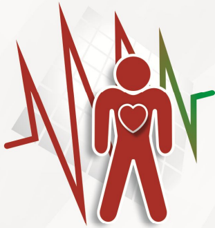
PRZYSPIESZONA CZYNNOŚĆ SERCA