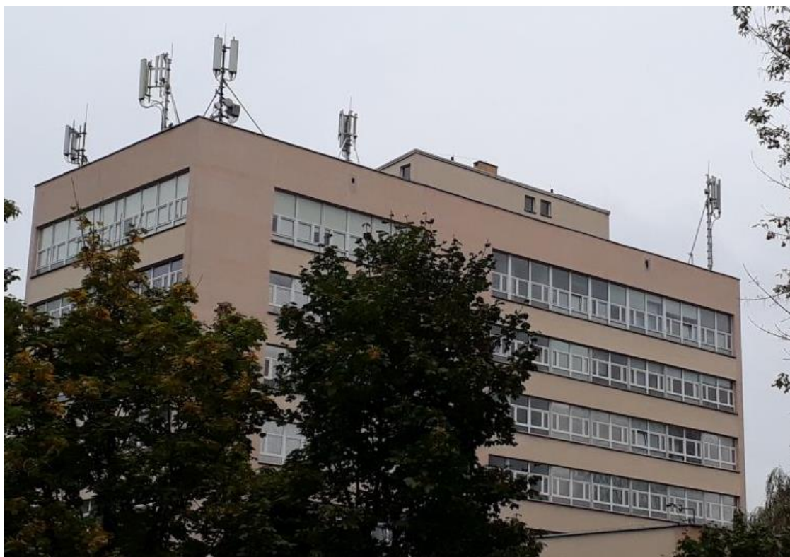
Fot. 1: Widoki anten stacji bazowych: ID: WAR1236_A, ID: 20521 (81225N!), zlokalizowanych pod adresem: ul. Waryńskiego 1, 00-645 Warszawa.