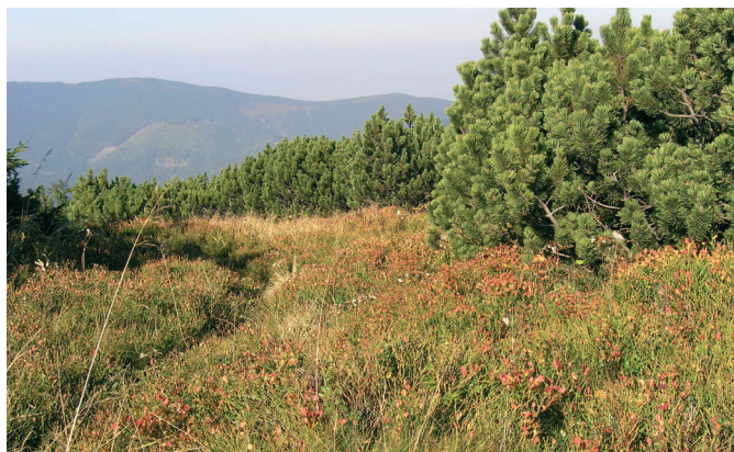
Fot. 2. Rezerwat Pilsko

Przesuwając się dalej na południe naszego województwa, przechodząc przez piętro pogórza, gdzie możemy spotkać rezerwaty florystyczne - „Lasek Miejski nad Puńcówką” (teren miasta Cieszyn) czy leśno-florystyczne - „Lasek Miejski nad Olzą” (teren miasta Cieszyn), chroniące cieszyniankę wiosenną - symbol miasta Cieszyna, docieramy do ostatniego, najbardziej rozległego i najwyższego pasma jakim są góry - Beskidy. Piętro regła dolnego reprezentują takie rezerwaty, jak położony z dala od siedzib ludzkich, bardzo dobrze zachowany i w związku z tym jako nieliczny w województwie w całości objęty ochroną ścisłą „Oszast”, w gminie Ujsoły, czy obecnie bardzo uszkodzony przez silne wiatry i szkodliwe owady leśne rezerwat „Butorza” na terenie gminy Rajcza. Szata leśna rezerwatu „Oszast” zachowała niemal pierwotny charakter i obfituje w leżące kłody dużych rozmiarów o zaawansowanym rozkładzie, na których rozwija się już kolejne, młode pokolenie lasu. Obraz ten dobitnie świadczy o nieprzemijalności świata przyrody. Kolejne piętro to zbiorowiska lasów regła górnego, reprezentowane przez jeden z najmłodszych rezerwatów na Śląsku, utworzony w 2008 r. dla ochrony górnoreglowego boru świerkowego i torfowisk z systemem oczek wodnych - rezerwat „Lipowska”. Obiekt ten tworzy wyjątkowo urokliwa mozaika ekosystemów leśnych.