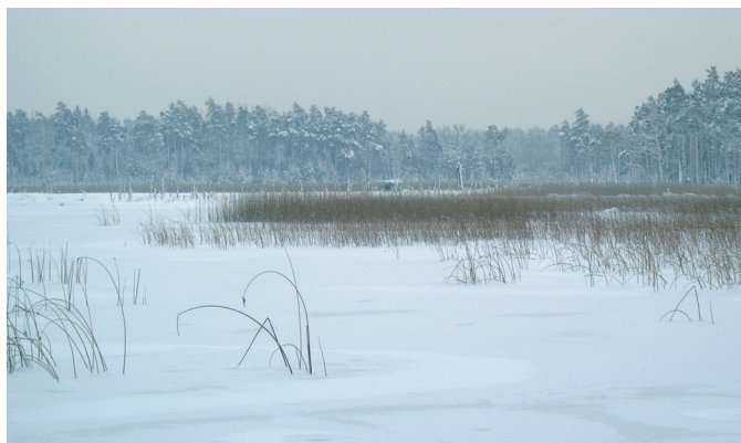
Fot. 1. Rezerwat Jeleniak Pikuliny