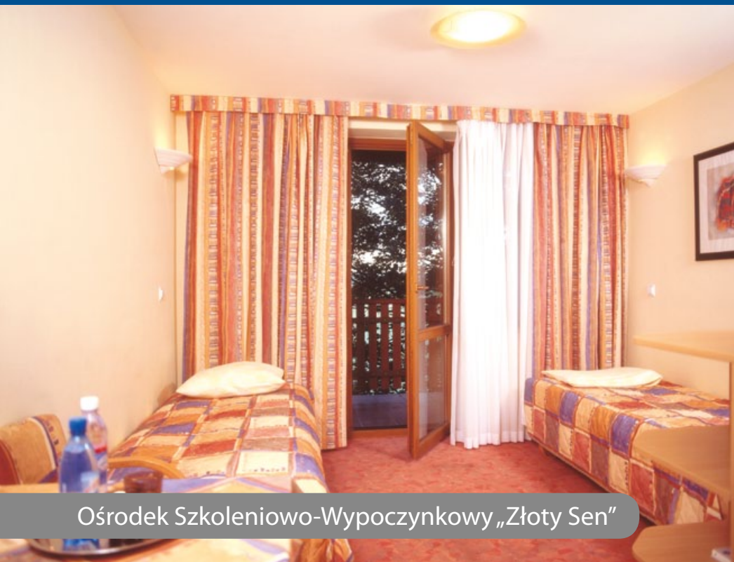
Ośrodek Szkoleniowo-Wypoczynkowy „Złoty Sen”