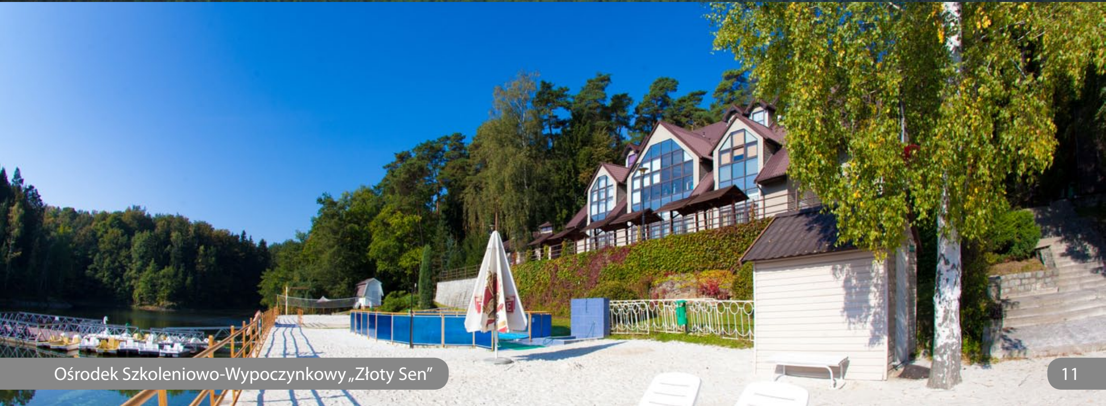
Ośrodek Szkoleniowo-Wypoczynkowy „Złoty Sen”