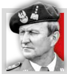
Gen. BRONISŁAW KWIATKOWSKI