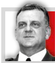
Gen. pilot ANDRZEJ BŁASIK