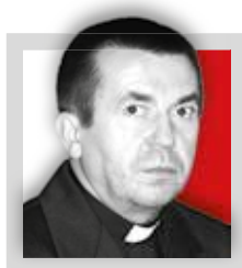
Ksiądz biskup gen. broni TADEUSZ PŁOSKI