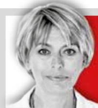
IZABELA JARUGA- NOWACKA