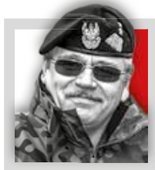
Gen. broni TADEUSZ BUK

szef Sztabu Generalnego Wojska Polskiego