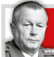
Gen. FRANCISZEK GĄGOR

szef Sztabu Generalnego Wojska Polskiego