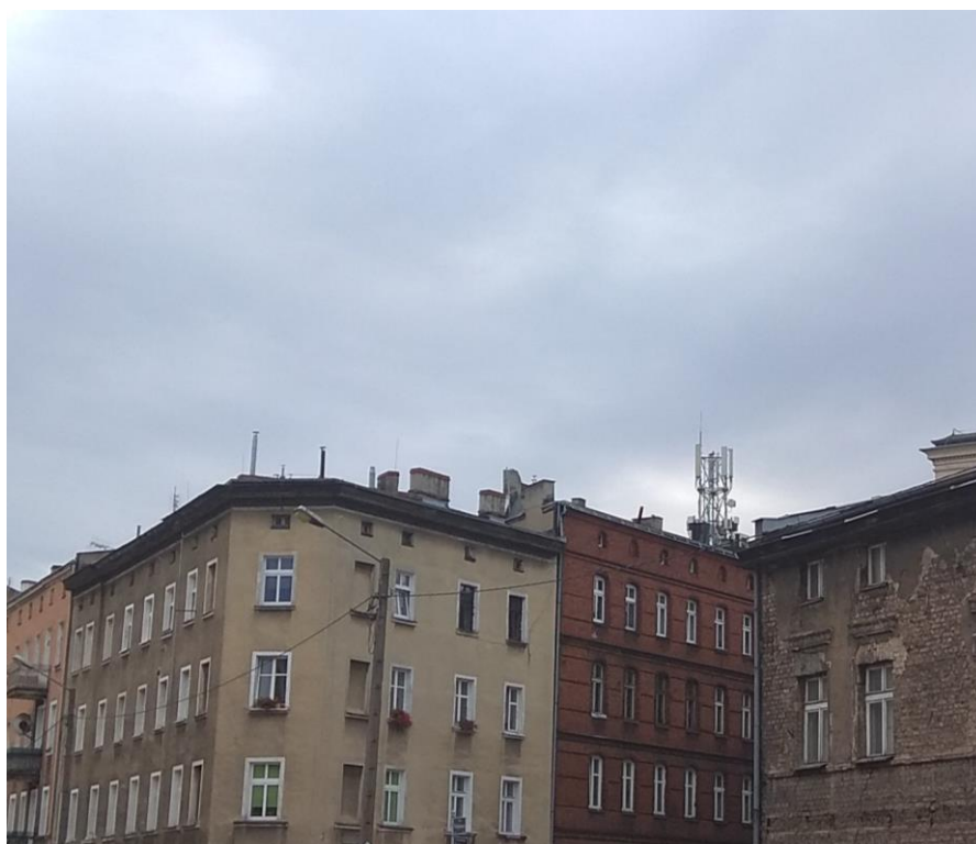
Fot. 1: Widok anten stacji bazowej ID: BT30745, zlokalizowanej pod adresem: ul. Calliera 3, 60-722 Poznań