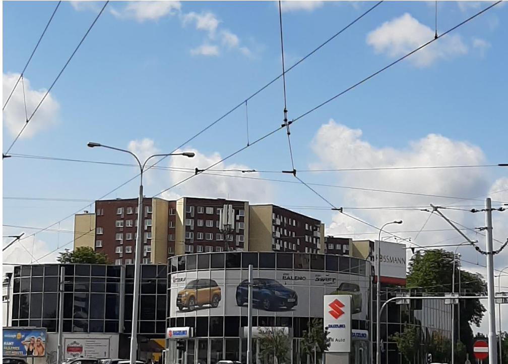
Fot. 1: Widok anten stacji bazowej ID: WRO1148, zlokalizowanej pod adresem: ul. Bałtycka 13/15, 51-109 Wrocław