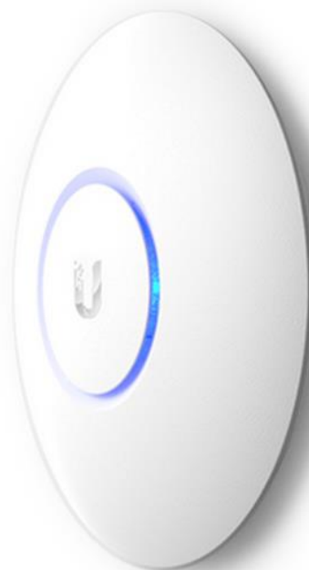
Fot. 1: Widok punktu dostępowego model UAP-AC-LITE