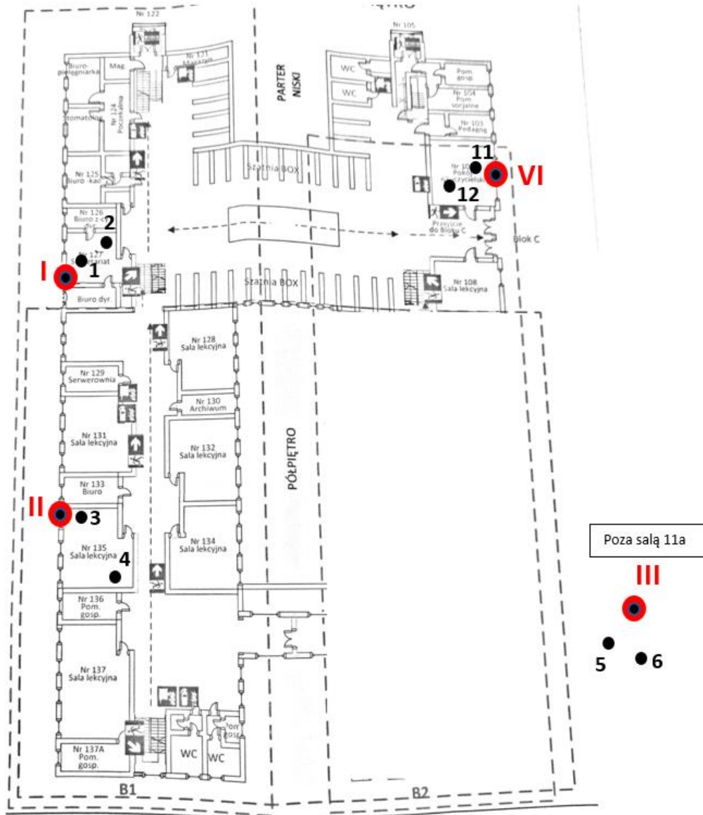
Rys. 1a: Plan rozmieszczenia punktów pomiarowych – parter/półpiętro, kolorem czerwonym oznaczono lokalizację punktów dostępnych

Lokalizacje punktów pomiarowych przedstawiono na Rys. 1a ÷ Rys. 1b.