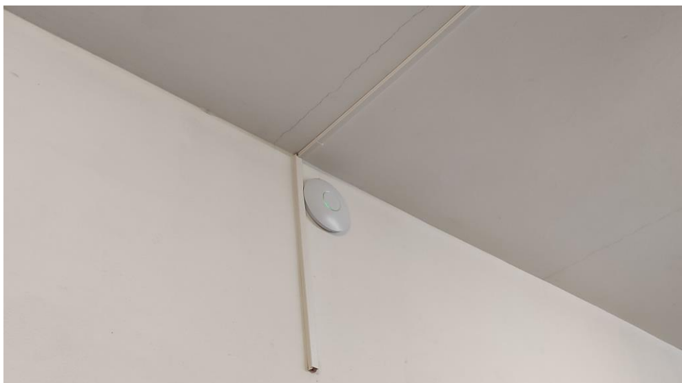
Fot. 2: Widok punktu dostępowego model UniFi AP LR