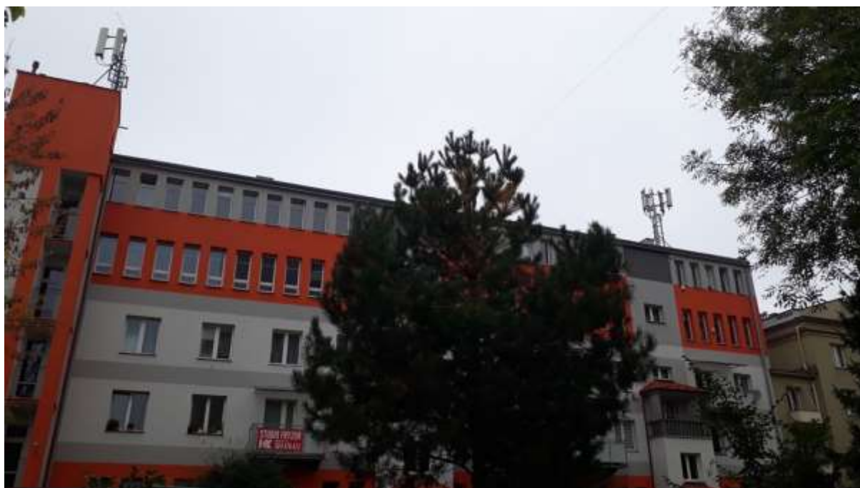
Fot. 1: Widoki anten stacji bazowej ID: 58187, zlokalizowanej: ul. Hetmańska 15, 35-045 Rzeszów