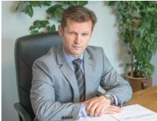
Wójt Gminy Malczyce

Absolwent Uniwersytetu Przyrodniczego we Wrocławiu oraz Uniwersytetu Wrocławskiego. W latach 2000-2014 związany zawodowo z koncernami międzynarodowymi z branży rolniczej. Od roku 2012 Dyrektor Handlowy w czeskiej firmie AGRA Sp z o.o. W 2013 roku uczestnik projektu Fundacji Polish Governance Institute oraz Urzędu Marszałkowskiego we Wrocławiu, w I edycji Akademii Liderów Rozwoju Lokalnego uzyskał Certyfikat Akademii Liderów Rozwoju Lokalnego. W latach 2010-2015 Prezes Fundację Szansa na Przyszłość w Malczycach. Od grudnia 2014 Wice Przewodniczący Rady Powiatu Średzkiego a później Wójt Gminy Malczyce. Regionalista i miłośnik historii Głogowa. Mieszka w Malczycach nad Odrą, ma żonę i trójkę dzieci.