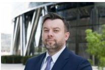
p.o. Dyrektor Centrum Unijnych Projektów Transportowych

Członek Rady Ekspertów ds. kolejowych przy Ministrze Infrastruktury i Budownictwa. Posiada wieloletnie doświadczenie w zakresie doradztwa dla sektora publicznego, m.in. w obszarze analiz finansowych i ekonomicznych oraz studiów wykonalności. Pracował w IPOPEMA Securities S.A., w IPOPEMA Financial Advisory na stanowisku dyrektora odpowiedzialnego za projekty inwestycyjne sektora publicznego. Niezależny konsultant największych firm doradczych. W latach 2002-2006 był zastępcą dyrektora w Ministerstwie Infrastruktury, odpowiadającym za środki pomocowe (fundusz Phare), środki przedakcesyjne (fundusz ISPA-Transport) oraz fundusze strukturalne (Sektorowy Program Operacyjny Transport 2004-2006).