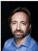
Prezes Zarządu, Kędzierzyn- Koźle Terminale sp. z o.o.

Od 25 lat związany z branżą logistyczną, portową i petrochemiczną. Przez ostatnich kilkanaście lat pełnił funkcję prezesa zarządu w spółkach należących do światowego lidera branży logistyki terminalowej, firmy Oiltanking GmbH należącej do Holdingu Marquard & Bahls AG. W okresie 2012-2015 pracował w grupie Warsaw Equity jako Dyrektor Inwestycyjny odpowiedzialny za projekty w sektorze infrastrukturalnym. Był także członkiem rady nadzorczej i prezesem zarządu w spółce Baltchem S.A. należącej do grupy Warsaw Equity. Od roku 2016 pełni funkcję Dyrektora Inwestycyjnego w funduszu Value Quest i jest odpowiedzialny między innymi za projekty w sektorze infrastruktury logistycznej i portowej.