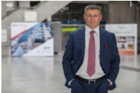
Wiceprezes zarządu, OT Logistics

Absolwent Politechniki Poznańskiej. Posiada kilkunastoletnie doświadczenie zawodowe związane z zarządzaniem produkcją i logistyką. Pełnił funkcje menadżerskie w wielu spółkach, pracował między innymi w Odratrans S.A., H. Cegielski – Poznań S.A., STOMIL – Poznań S.A. i JAMALEX sp. z o.o., gdzie przygotowywał i wdrażał rozwiązania z zakresu zarządzania strategicznego i optymalizacji procesów zarządzania produkcją i systemami logistycznymi. Wykładowcą Politechniki Poznańskiej oraz w Wyższej Szkole Bankowej w Poznaniu. W OT Logistics S.A. od 1 lipca 2017 r., odpowiada za koordynację działań operacyjnych realizowanych przez spółki Grupy Kapitałowej OT Logistics, a także koordynację sprzedaży w kraju.