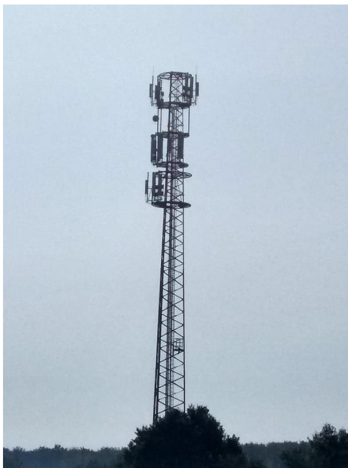
Fot. 1: Widok anten stacji bazowych: ID: 74024, ID: BT41749, zlokalizowanych pod adresem: ul. Spokojna, działka nr 172/20, 70-892 Szczecin