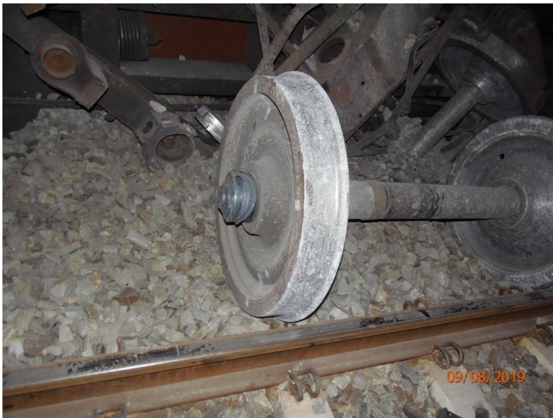
Zdjęcie 3 -Uszkodzony zestaw kołowy nr 5249978 wagonu nr 31 51 5496 893-9 po zdarzeniu