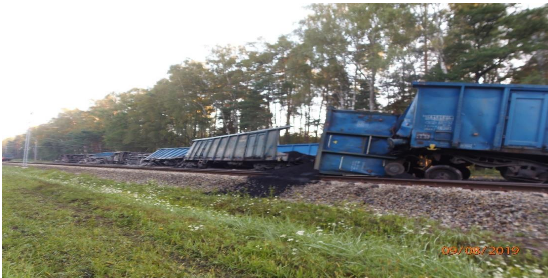
Zdjęcie 1 - Widok ogólny miejsca zdarzenia

dyżurnego ruchu, że dokonał sprawdzenia czwartego, piątego, szóstego i siódmego wagonu i nic niepokojącego nie zauważył, jak również nie wyczuł żadnego specyficznego zapachu świadczącego o przegrzaniu elementów układu jezdnych sprawdzanych wagonów. W związku z nie stwierdzeniem usterek podjął decyzję o kontynuowaniu jazdy i za zgodą dyżurnego ruchu uruchomił pociąg. Kontynuował jazdę z prędkością ok. 60 km/h. Po przejechaniu ok. 3,8 km o godzinie 23:18 zauważył zakotyśnięcie sieci, szarpnięcie lokomotywy i wdrożył nagle hamowanie. Gdy wyrztał przez okno zauważył przewracające się wagony. Natychmiast zgłosił dyżurnemu ruchu stacji Tarnów Opolski, że w kilometrze 87,973 linii kolejowej nr 132 Bytom – Wrocław Główny wagony się wykoleiły i aby zamknął tor nr 1 i 2, ponieważ wagony leżały na torze nr 1 i 2.