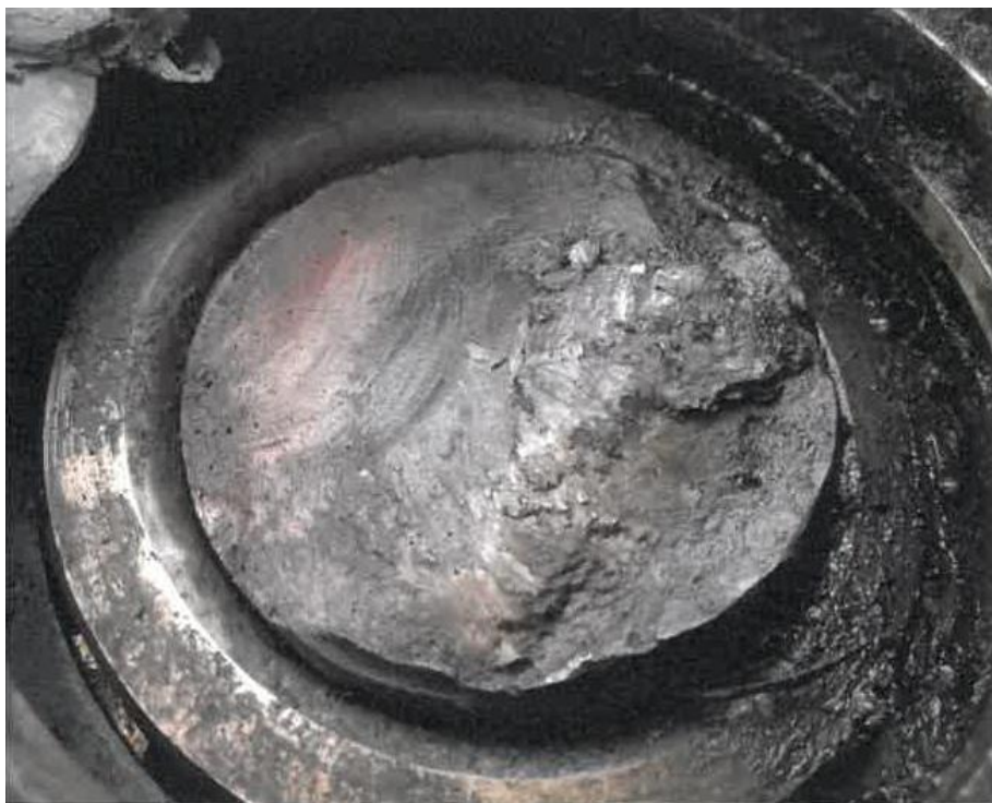
Zdjęcie 5 - Przełom czopa w stanie zmontowanym