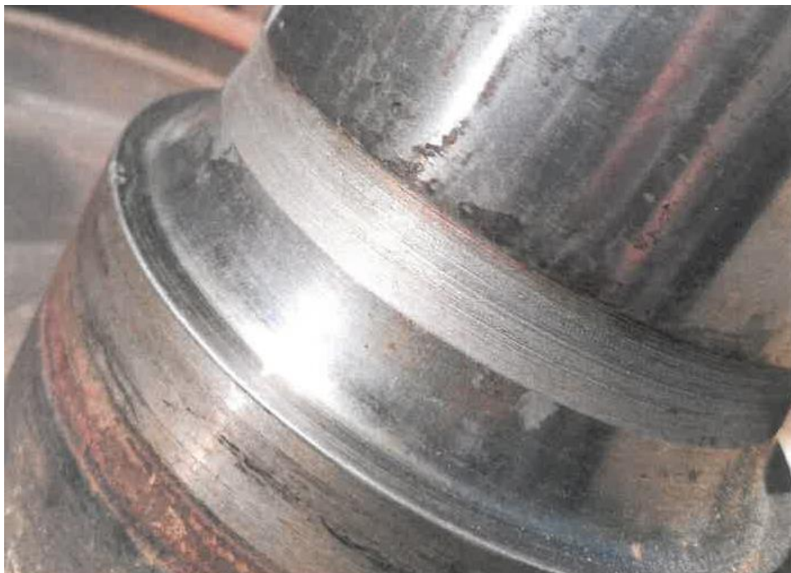
Zdjęcie 9- Podtoczenie powierzchni czopa przeciwległego osi nr 5249978

Ostatnią naprawę (przeгляд poziomu P4) wykonano 23.01.2017 roku w Zakładzie Napraw Taboru PKP CARGOTABOR w Kluczborku.