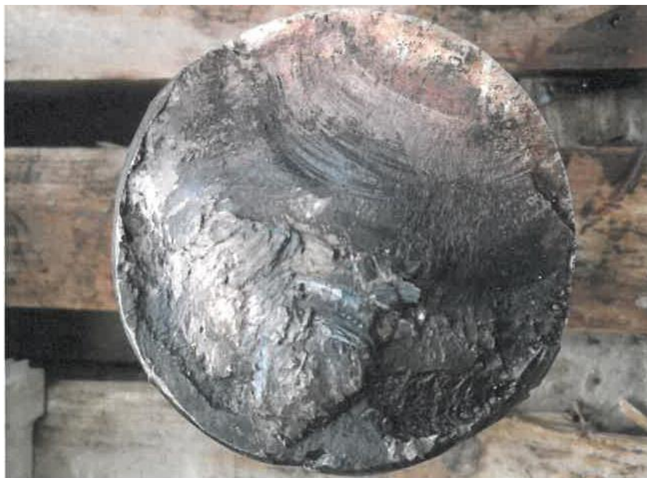
Zdjęcie 6- Płaszczyzna przełomu czopa po demontażu ułożyskowania i po oczyszczeniu