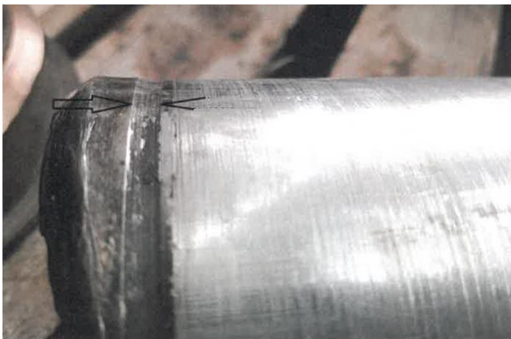
Zdjęcie 8 - Podtoczenie powierzchni złamanej czopa osi nr 5249978

Najbardziej widoczną niezgodność w przypadku obu czopów złamanej osi stanowi podtoczenie, które wykonano po obu stronach. Rodzaj i kształt wykonanych podtoczeń pokazano na zdjęciu nr 7 i 8.