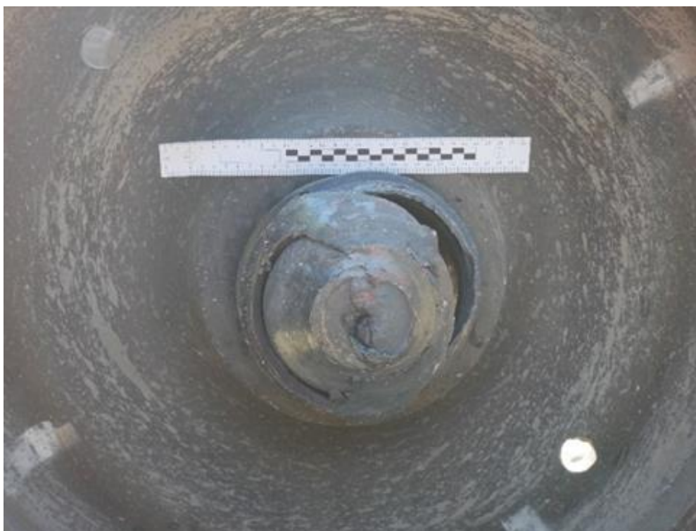
Zdjęcie 4 - Złamana oś– strona od koła obręczowanego