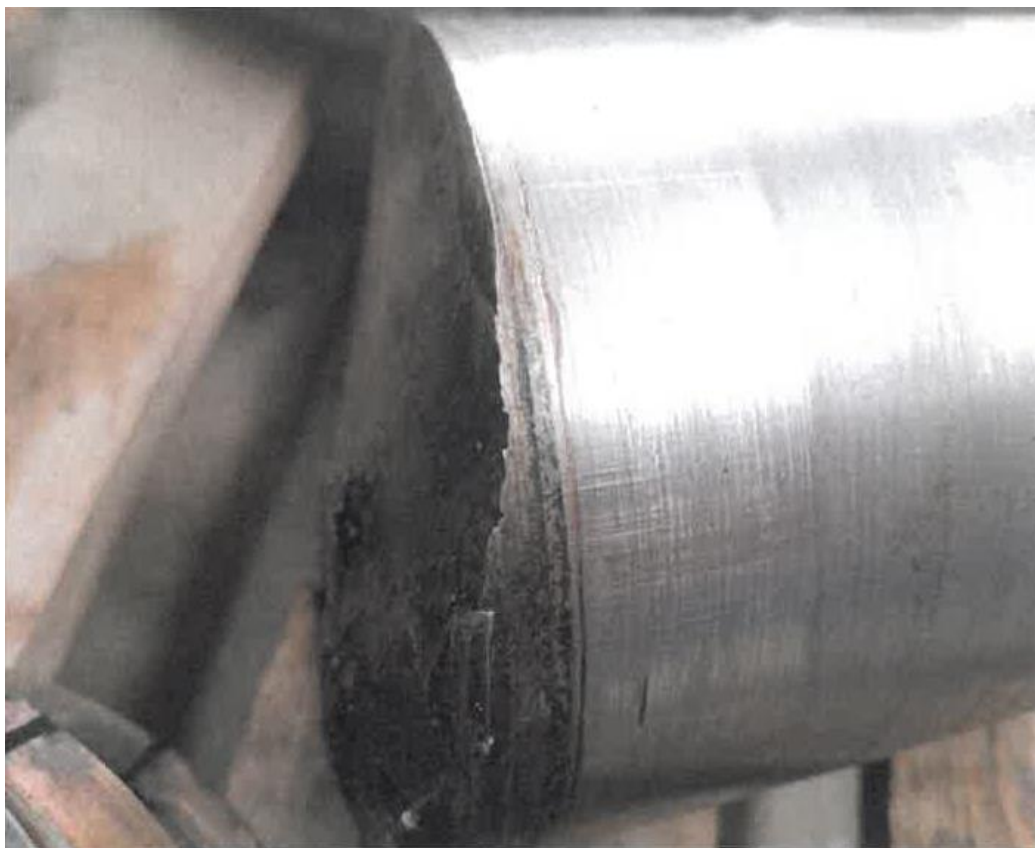
Zdjęcie 7- Obszar pęknięcia czopa

Najbardziej widoczną niezgodność w przypadku obu czopów złamanej osi stanowi podtoczenie, które wykonano po obu stronach. Rodzaj i kształt wykonanych podtoczeń pokazano na zdjęciu nr 7 i 8.