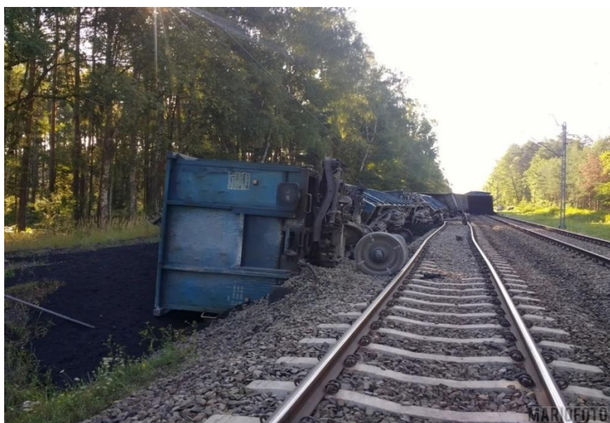
Zdjęcie 2 - Widok ogólny skutków wypadku