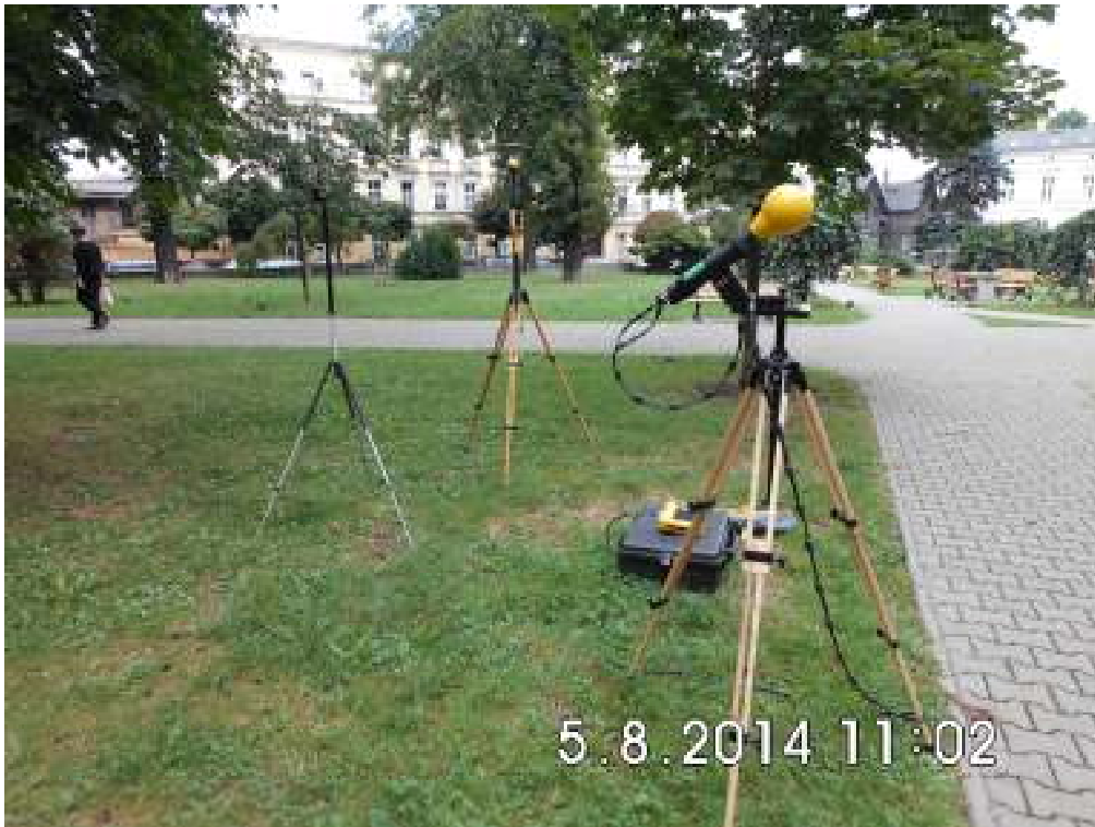
Fot.1. Rejon badań, widok w kierunku północno-zachodnim