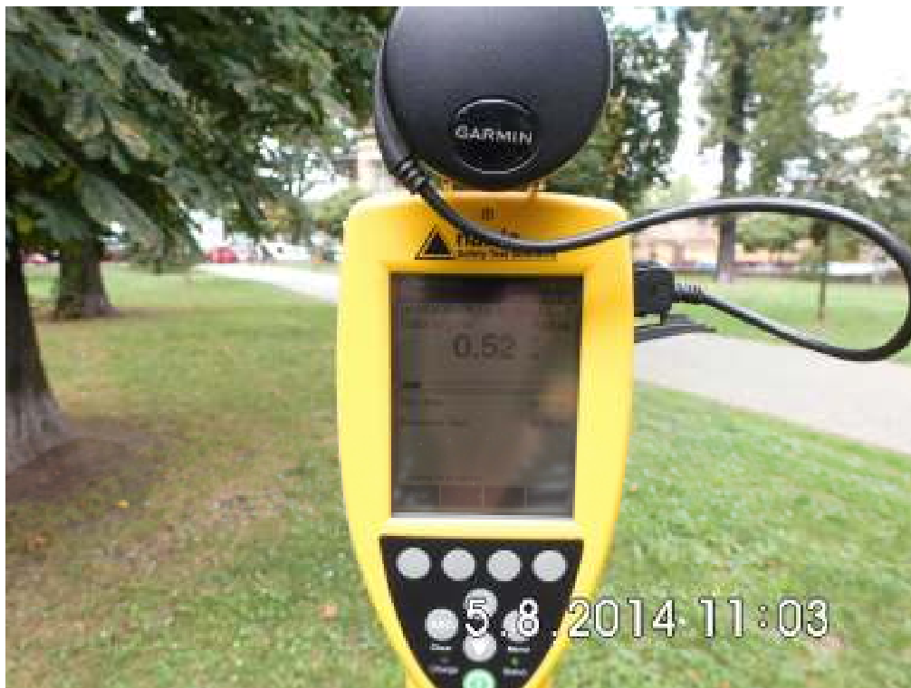
Fot.4. Przyrząd pomiarowy w trakcie wykonywanego badania