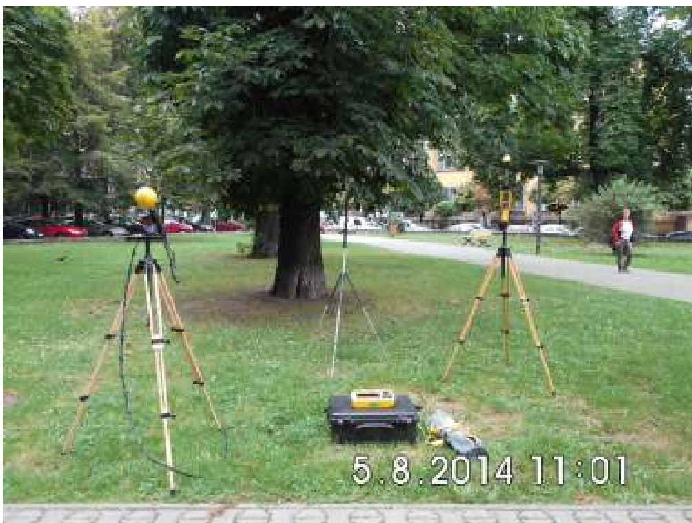
Fot.2. Rejon badań, widok w kierunku zachodnim