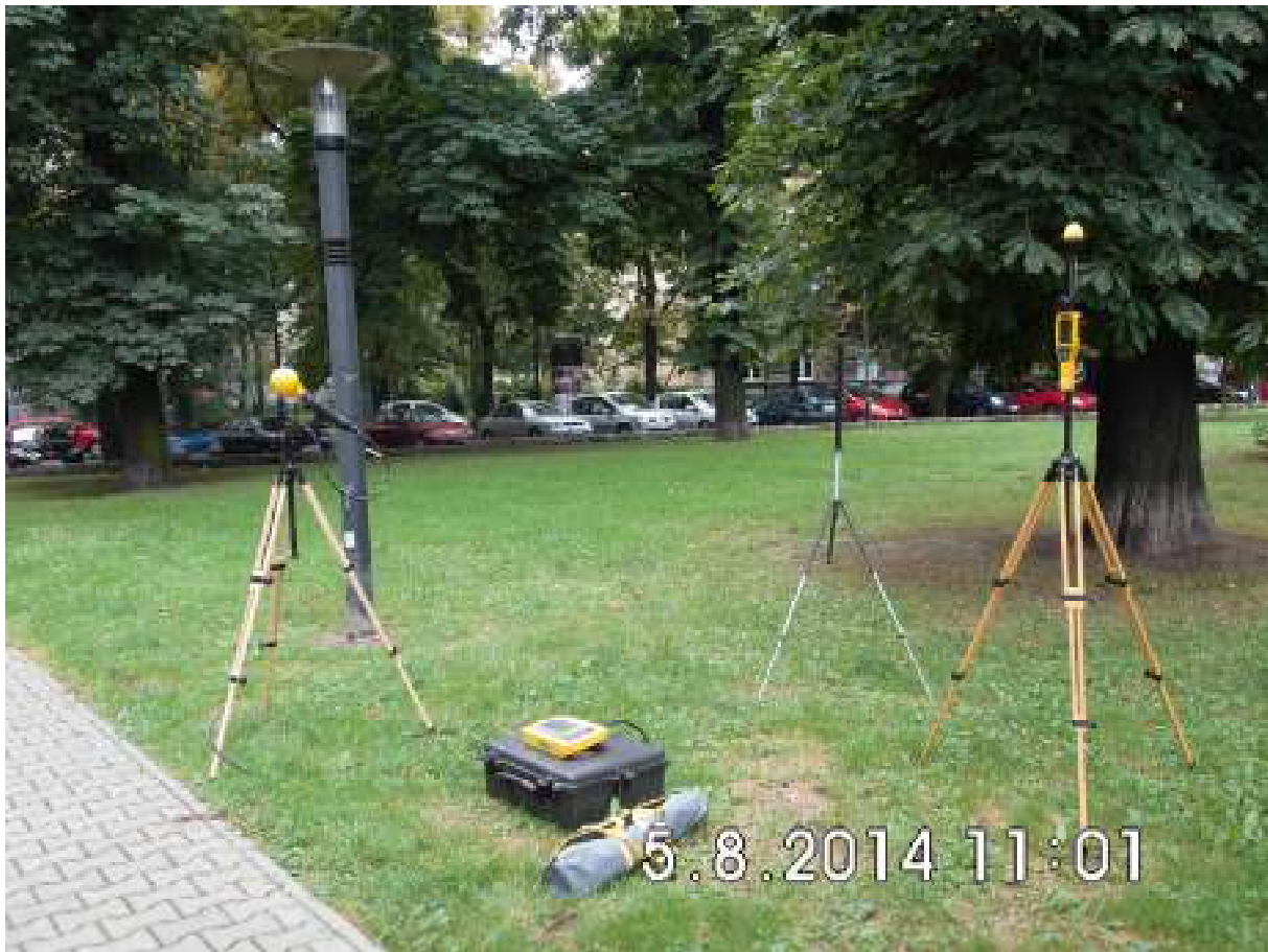
Fot.3. Rejon badań, widok w kierunku południowo-zachodnim