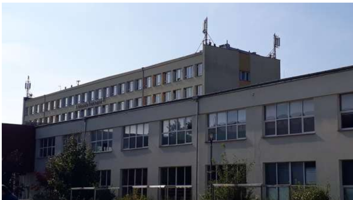
Fot. 1: Widoki anten stacji bazowej ID: 5944, zlokalizowana: al. Tysiąclecia Państwa Polskiego 7, 25-314 Kielce