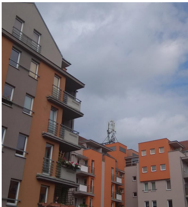
Fot. 1: Widok anten stacji bazowej ID: POZ0004, zlokalizowanej pod adresem: ul. Piaskowa 8, 61-753 Poznań