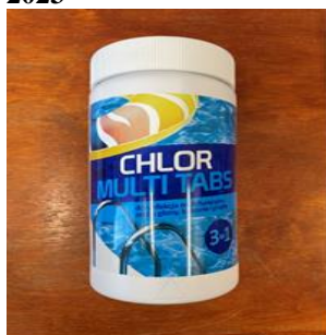
Fot. 3. Przykładowy produkt biobójczy stosowany do dezynfekcji basenów kąpielowych skontrolowany w roku 2023