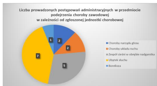
Wyk. 4. Liczba prowadzonych postępowań administracyjnych w przedmiocie podejrzenia choroby zawodowej w zależności od zgłoszonej jednostki chorobowej

W roku 2022 Państwowy Powiatowy Inspektor Sanitarny w Ostrowie Wielkopolskim wydał 8 decyzji dotyczących chorób zawodowych, w tym: 4 decyzje o stwierdzeniu chorób zawodowych oraz 4 decyzje o braku podstaw do stwierdzenia choroby zawodowej.