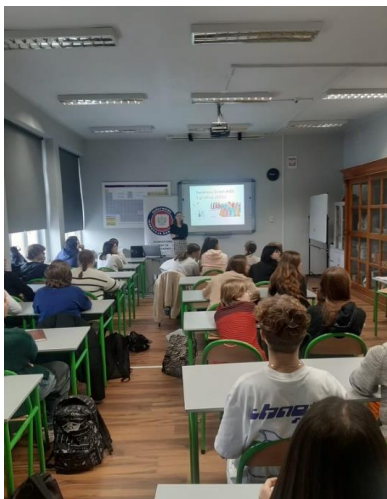
Fot. 9. Światowy Dzień AIDS w IV LO w Ostrowie Wielkopolskim