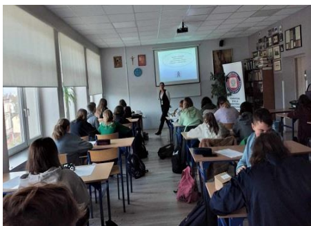
Fot. 11 Warsztaty MLZ kontra HIV w Zespole Szkół Budowlano-Energetycznych w Ostrowie Wielkopolskim