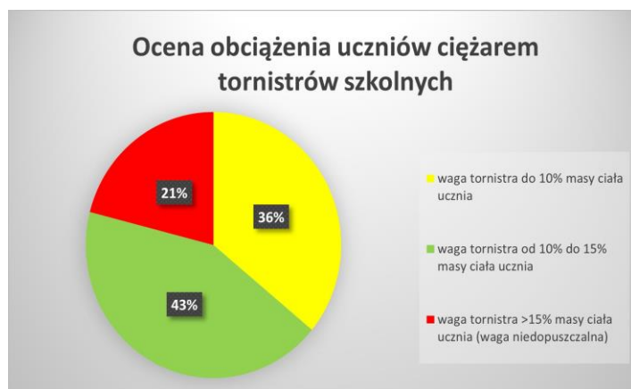
Wyk. 5. Ocena obciążenia uczniów ciężarem tornistrów szkolnych

Coraz więcej kontrolowanych placówek posiada atesty i certyfikaty na wyposażenie – meble szkolne (stoły, krzesła) – 76% i przedszkolne (stoły, krzesła) – 95%, sprzęt na placach zabaw – 100%, sprzęt sportowy w szkołach – 77%.