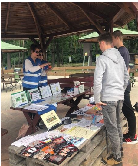
Fot. 14. Akcja informacyjno-edukacyjna OHP w Ostrowie Wielkopolskim