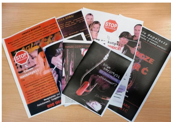
Fot. 6. Materiały edukacyjne wykorzystane w profilaktyce zażywania środków zastępczych

Materiały edukacyjne wykorzystane w 2023 roku w profilaktyce zażywania środków zastępczych przedstawiono na zdjęciu poniżej.