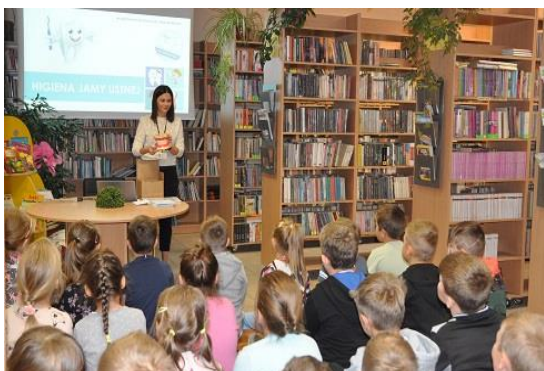
Fot. 22. Pogadanka w SP w Daniszynie