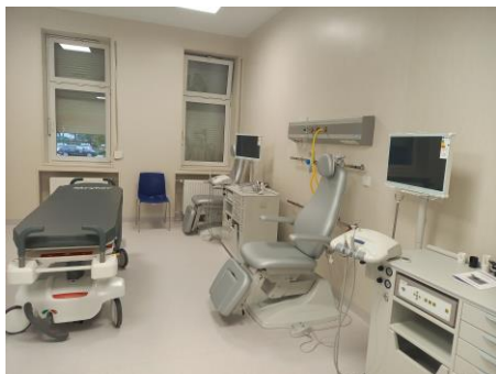
Fot. 7. Oddział Laryngologii na terenie Szpitala ZZOZ w Ostrowie Wielkopolskim