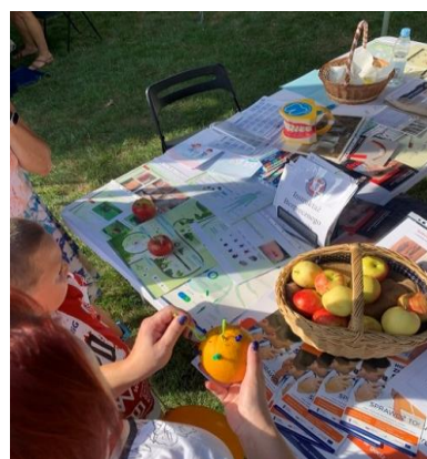
Fot. 26. Piknik Zdrowia Miasta Ostrowa Wielkopolskiego Stoisko edukacyjno-informacyjne