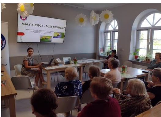
Fot. 24. Szkolenie „Mały kleszcz – Duży problem” Dzienny Dom Senior +