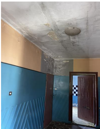
Fot. 2. Przykład nieprawidłowości stwierdzonych w 2023 roku w zakładach pracy

W 27 skontrolowanych w 2023 roku zakładach pracy stwierdzono przekroczenie najwyższych dopuszczalnych stężeń i natężeń czynników szkodliwych dla zdrowia.