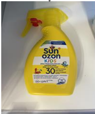
Fot. 4. Przykładowy produkt kosmetyczny zawierający substancje chroniące przed promieniowaniem UV skontrolowany w roku 2023

W 2023 roku w zakresie nadzoru nad chemikaliami stwierdzono następujące nieprawidłowości: