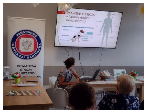
Fot. 25. Szkolenie „Mały kleszcz – Duży problem” Dzienny Dom Senior +