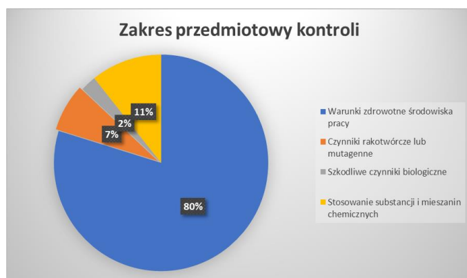
Wyk. 1. Zakres przedmiotowy kontroli przeprowadzonych przez Sekcję Higieny Pracy w 2023 roku

W 2023 roku w ewidencji Sekcji Higieny Pracy znajdowało się 69 zakładów pracy, w których występują czynniki o działaniu rakotwórczym lub mutagennym (np. pyły drewna, krzemionka krystaliczna, spaliny emitowane z silników Diesla). W 2023 roku przeprowadzono 6 kontroli pod względem w/w czynników, skontrolowano 6 zakładów pracy. W zakładach tych w kontakcie z w/w czynnikami pracuje 46 osób (w tym 6 kobiet).