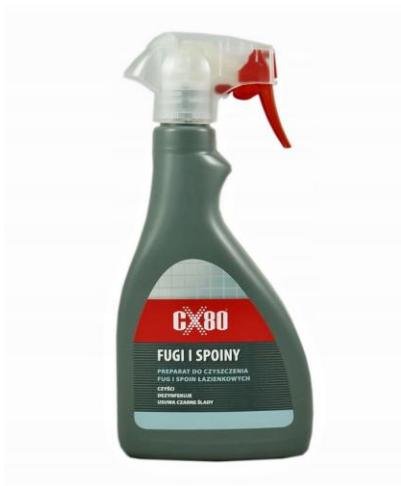
Fot. 5. Przykładowa mieszanina chemiczna wycofana z obrotu w 2023 roku

Przykładową mieszaninę chemiczną wycofaną z obrotu w 2023 roku z uwagi na stwierdzone nieprawidłowości przedstawiono na zdjęciu poniżej.