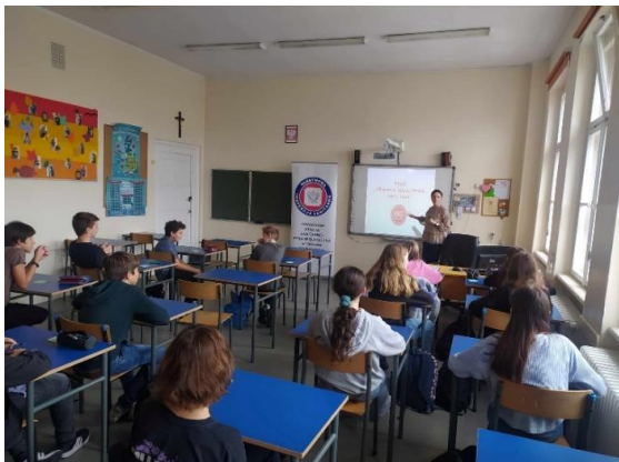
Fot. 18. Warsztaty MLZ-Kontra Tytoń SP Nr 2 w Ostrowie Wielkopolskim