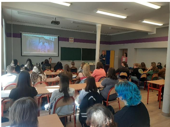
Fot. 12. Światowy Dzień Bez Tytoniu w ZSU w Ostrowie Wielkopolskim