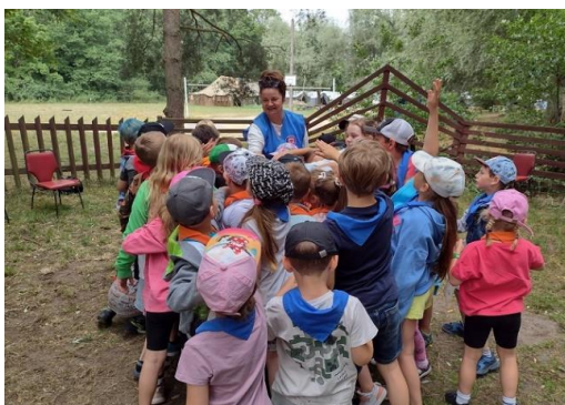
Fot. 20. Półkolonie ZHP, Stanica Harcerska „Zielona Polana” w Ostrowie Wielkopolskim