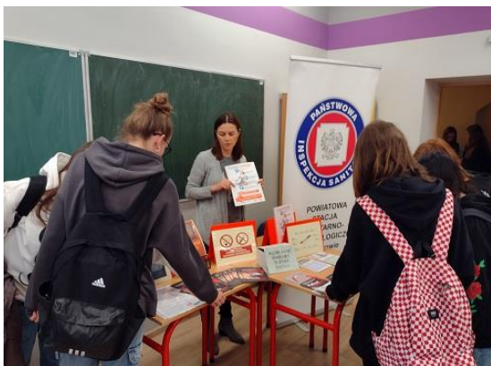
Fot. 16. Obchody Światowego dnia Rzucania Palenia W ZSU w Ostrowie Wielkopolskim