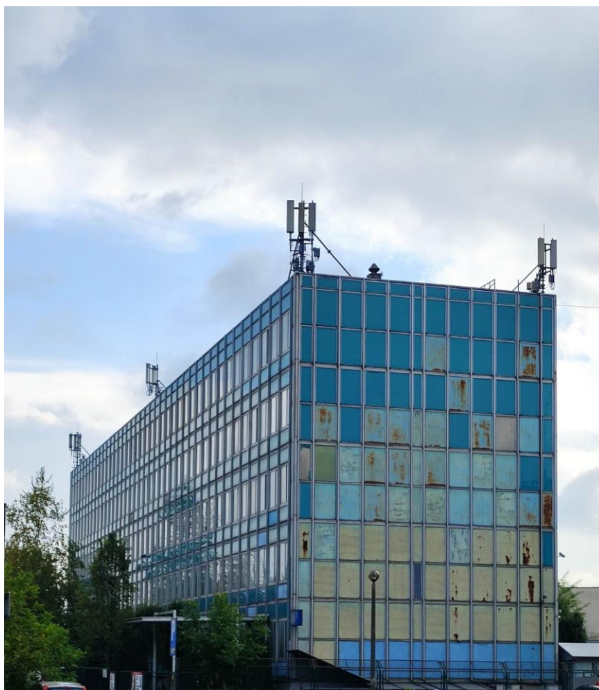
Fot. 1: Widoki anten stacji bazowych: ID: 10041, ID: BT20525, zlokalizowanych: os. Albertyńskie 1-2, Kraków