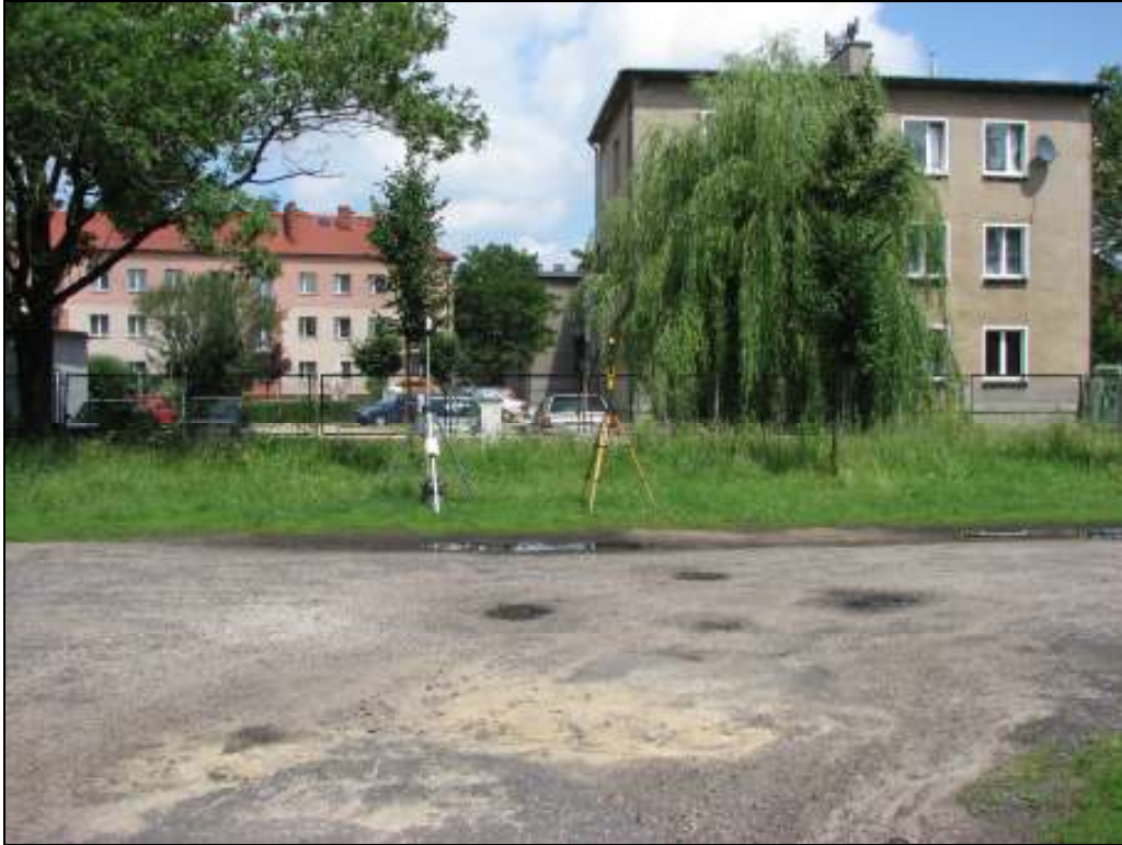
Fot.3. Rejon badań, widok w kierunku północnym