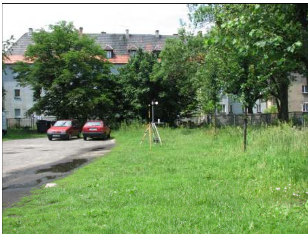
Fot.2. Rejon badań, widok w kierunku zachodnim