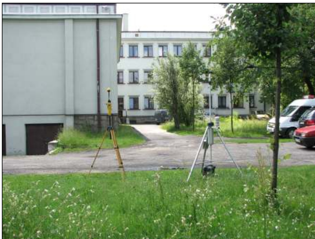
Fot.1. Rejon badań, widok w kierunku południowym - budynku szkoły