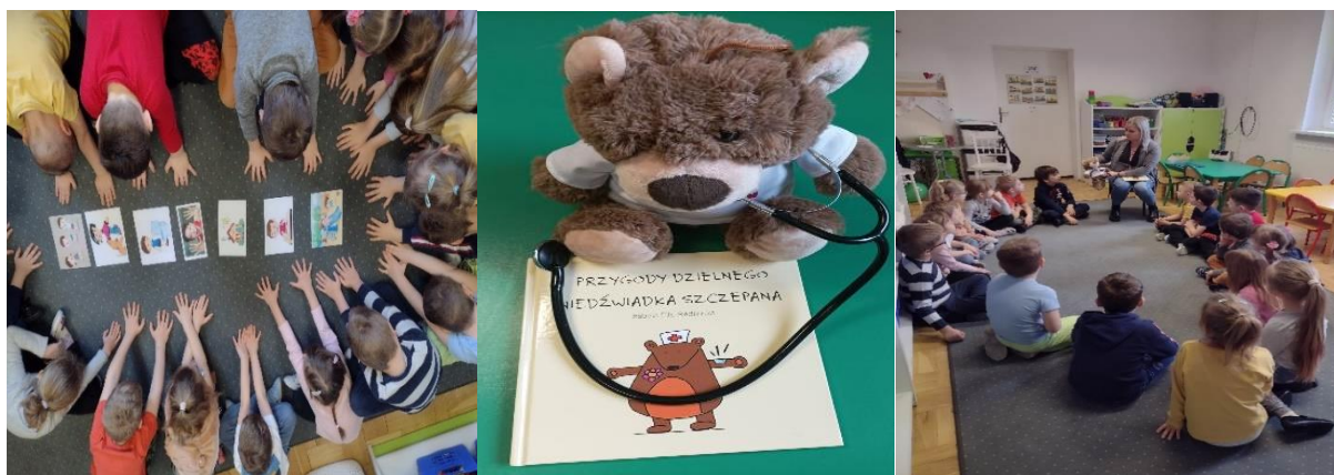
Przedszkole nr 12 w Tarnowskich Górach

Podczas zajęć rozmawiano z dziećmi o zdrowym stylu życia, aktywności fizycznej, higienie osobistej, w tym o prawidłowym myciu rąk, odpowiednim ubiorze oraz prawidłowym odżywianiu. Przedszkolaki podczas czytania bajki edukacyjnej pt. „Przygody dzielnego niedźwiadka Szczepana” dowiedziały się w prosty i ciekawy sposób, jak działają szczepienia ochronne oraz dlaczego szczepienia są tak ważne w życiu człowieka. Dzieci aktywnie włączyły się w zajęcia, chętnie odpowiadały na zadawane pytania. Wykazały się dużą wiedzą na temat chorób zakaźnych, znając zasady, co należy zrobić, kiedy same czują się źle i podejrzewają u siebie przeziębienie. Na zakończenie, każde dziecko w nagrodę otrzymało odblaskowy breloczek w kształcie misia.