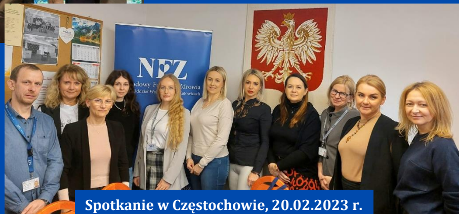
Spotkanie w Częstochowie, 20.02.2023 r.