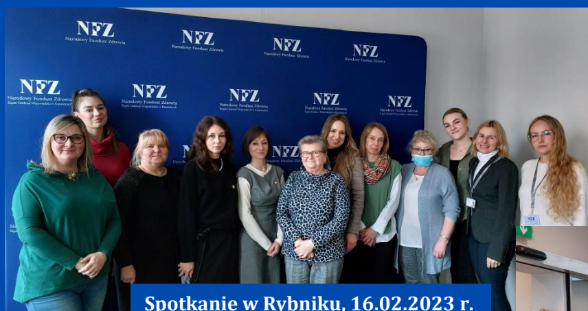
Spotkanie w Rybniku, 16.02.2023 r.

Omówione zostały wspólne przedsięwzięcia, które zaplanowane zostały na terenie całego woj. śląskiego, a ich celem będzie promocja zdrowego stylu życia wśród mieszkańców naszego województwa.