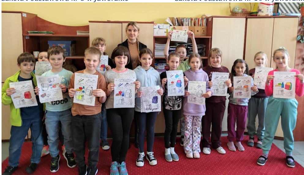
Szkoła Podstawowa nr 5 w Jaworznie