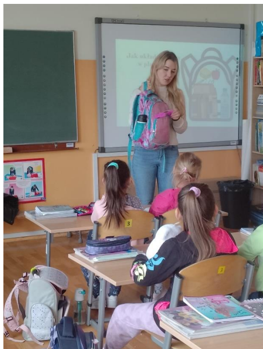
Szkoła Podstawowa nr 16 w Jaworznie