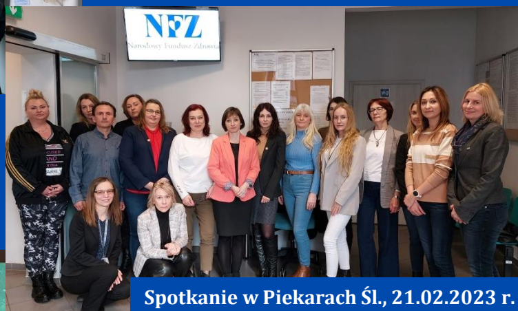
Spotkanie w Piekarach Śl., 21.02.2023 r.