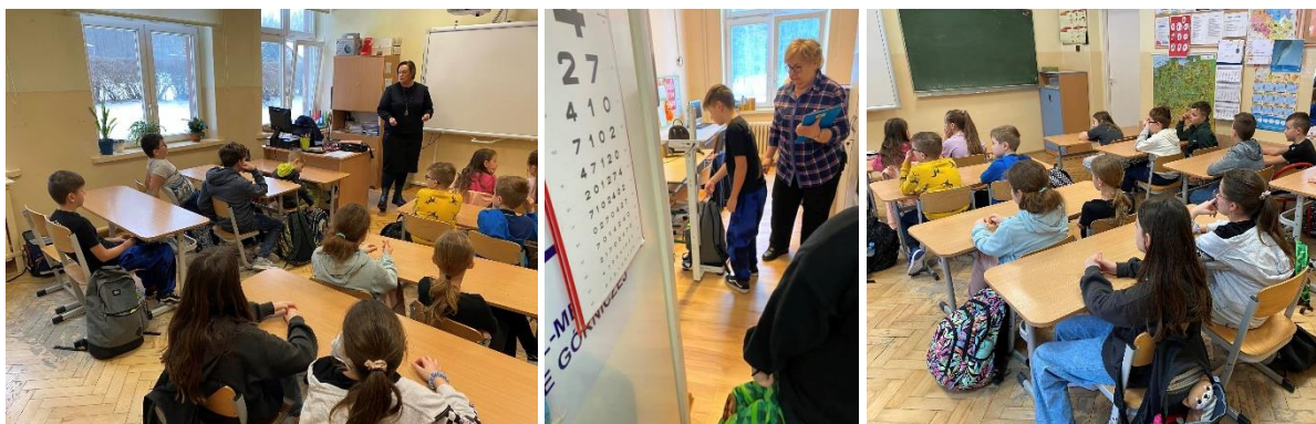
Szkoła Podstawowa nr 26 w Dąbrowie Górniczej – spotkanie w klasach I–III