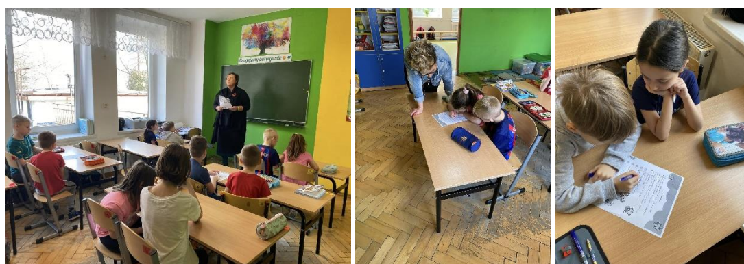
Fundacja „Serce Szkole”- Szkoła Podstawowa w Dąbrowie Górniczej- dzieci uczestniczące w zajęciach z klasy I–III