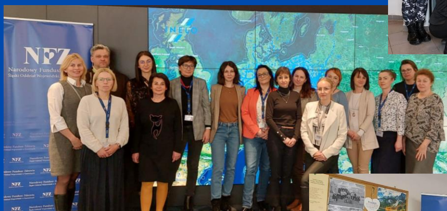
Spotkanie w Bielsku-Białej, 17.02.2023 r.