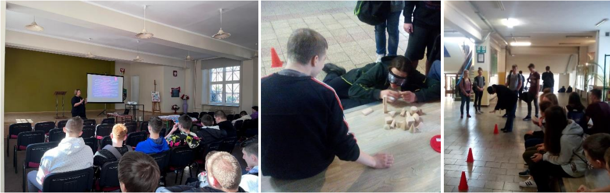
Prelekcja i warsztaty edukacyjne dla młodzieży