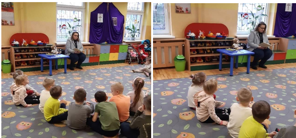
Przedszkole Miejskie Integracyjne nr 8 w Bytomiu