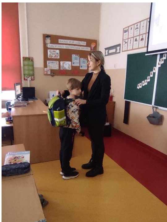
Szkoła Podstawowa nr 5 w Jaworznie