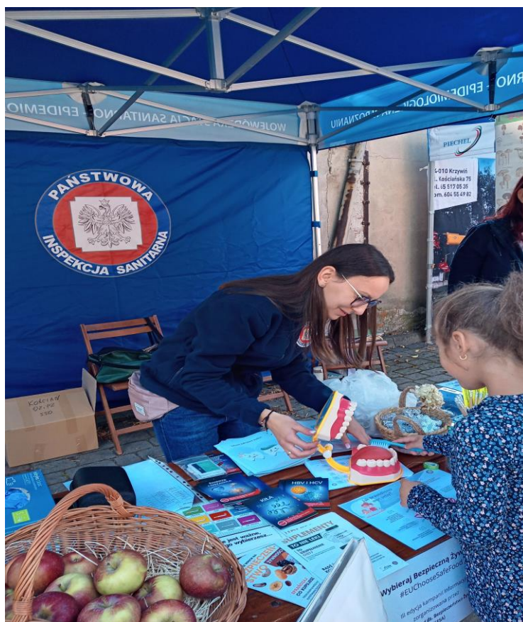
Zdjęcie nr 22 - „Dzień zdrowia i bezpieczeństwa”

Podczas festynu Starostwa Powiatowego w Kościanie pt.: „Dzień zdrowia i bezpieczeństwa” Powiatowa Stacja Sanitarno-Epidemiologiczna w Kościanie zorganizowała stoisko informacyjno-educacyjne gdzie udzielano informacji o zasadach higieny, suplementów diety, porad grzybowych oraz chorób zakaźnych. Zainteresowani mogli zaopatrzyć się w tematyczne ulotki.