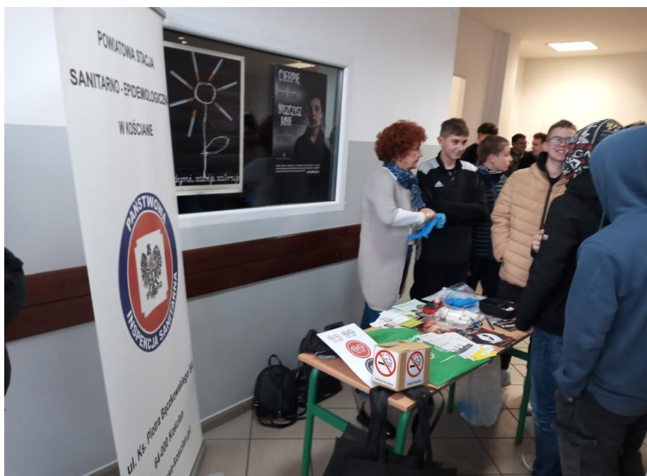
Zdjęcie nr 14 - Punkt informacyjno – edukacyjny w Ośrodku Kształcenia Zawodowego w Kościanie