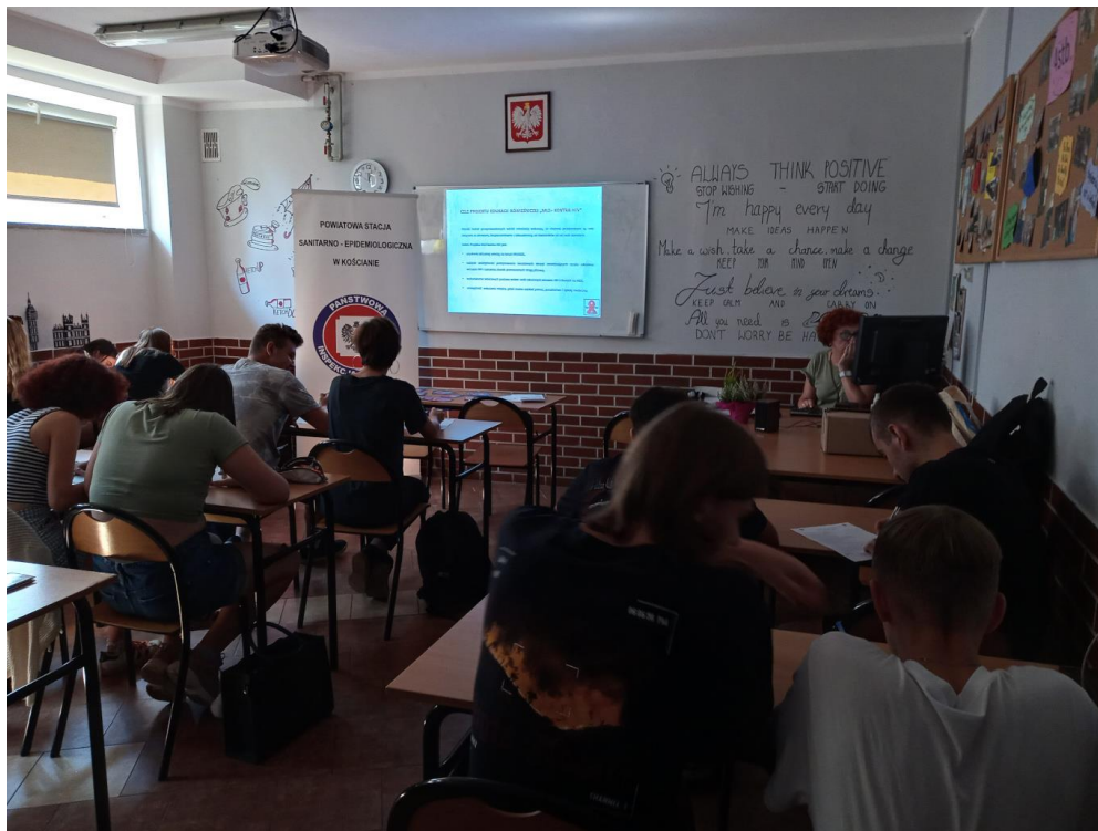
Zdjęcie nr 9. Szkolenie dla Młodzieżowych Liderów Zdrowia nt. HIV/AIDS

Na bieżąco w mediach społecznościowych zamieszczane są tematyczne informacje.