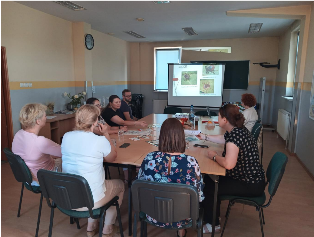
Zdjęcie nr 16 - Szkolenie dla kadry Hufca Pracy w Kościanie