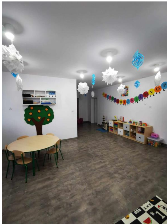
Zdjęcie nr 7. Sala zajęć w Punkcie Przedszkolnym „Terapeutyczne Senso-Szkraby” w Kościanie