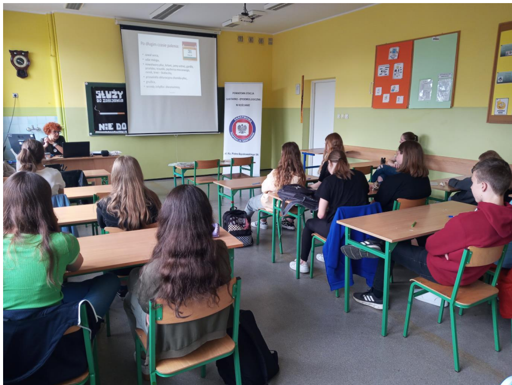
Zdjęcie nr 12 - Szkolenie dla „Młodzieżowych Liderów Zdrowia – kontra tytoń”

- szkolenie i warsztaty w ramach Młodzieżowych Liderów Zdrowia dla uczniów VIII klasy szkoły podstawowej nt.: szkodliwości palenia, w szkoleniu uczestniczyło 17 uczniów.