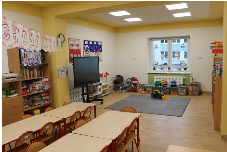
Zdjęcie nr 2. Nowa sala przedszkolna w Zespole Szkół Gminy Kościan Przedszkole i Szkoła Podstawowa w Racocie