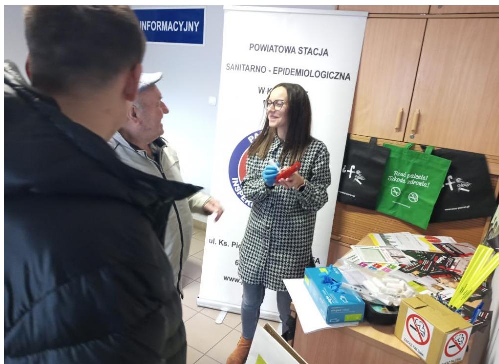
Zdjęcie nr 15 - Punkt informacyjno – edukacyjny w siedzibie PSSE w Kościanie