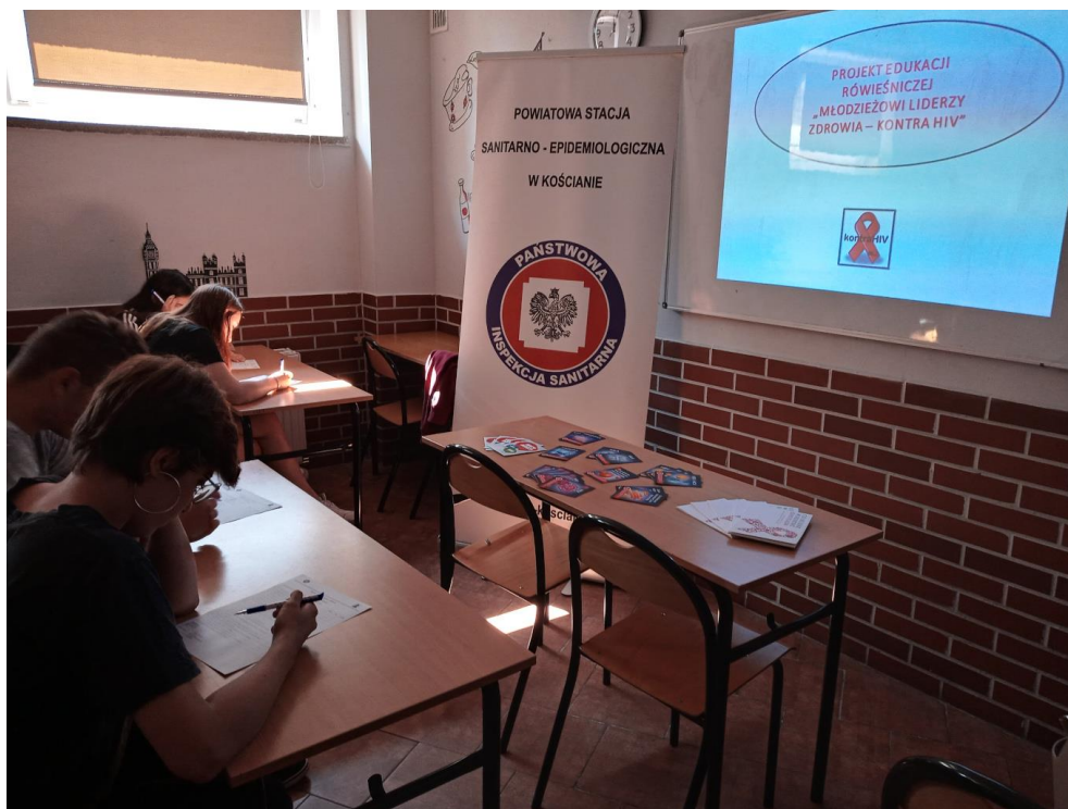
Zdjęcie nr 10. „Trzymaj Formę”.

Celem działań w ramach programu jest edukacja w zakresie trwałego kształtowania prozdrowotnych nawyków wśród młodzieży, poprzez promocję zasad aktywnego stylu życia i zbilansowanej diety w oparciu o indywidualną odpowiedzialność i wolny wybór jednostki.