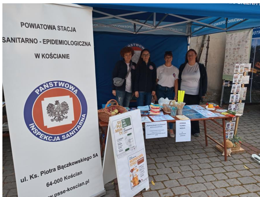
Zdjęcie nr 23 - „Dzień zdrowia i bezpieczeństwa”