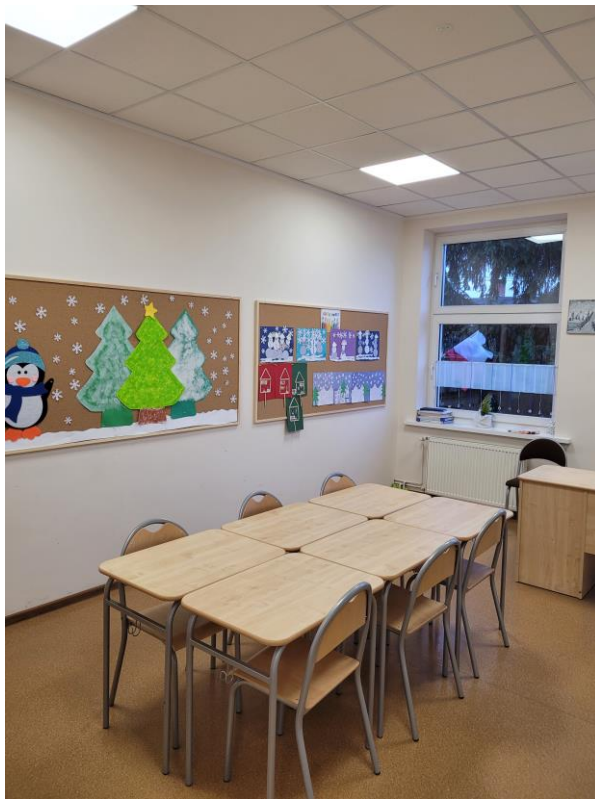
Zdjęcie nr 5. Sala zajęć w wyremontowanym budynku szkoły w Kielczewie