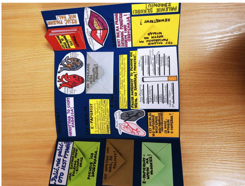
Zdjęcie nr 11. - Nagrodzona praca konkursowa w konkursie „Palić, nie palić – oto jest pytanie?”

- we współpracy ze Starostwem Powiatowym konkurs na etapie powiatowym pod hasłem „Palić, nie palić – oto jest pytanie?” na lapbooka o tematyce antytytoniowej, skierowany do uczniów klas V. W konkursie wzięło udział 12 szkół podstawowych na terenie powiatu, na konkurs wpłynęło 12 prac. Nagrodzono 3 prace oraz przyznano 2 wyróżnienia. Nagrody ufundowało Starostwo Powiatowe w Kościanie. Praca która zajęła I miejsce na etapie powiatowym została przesłana na etap wojewódzki gdzie zajęła III miejsce.