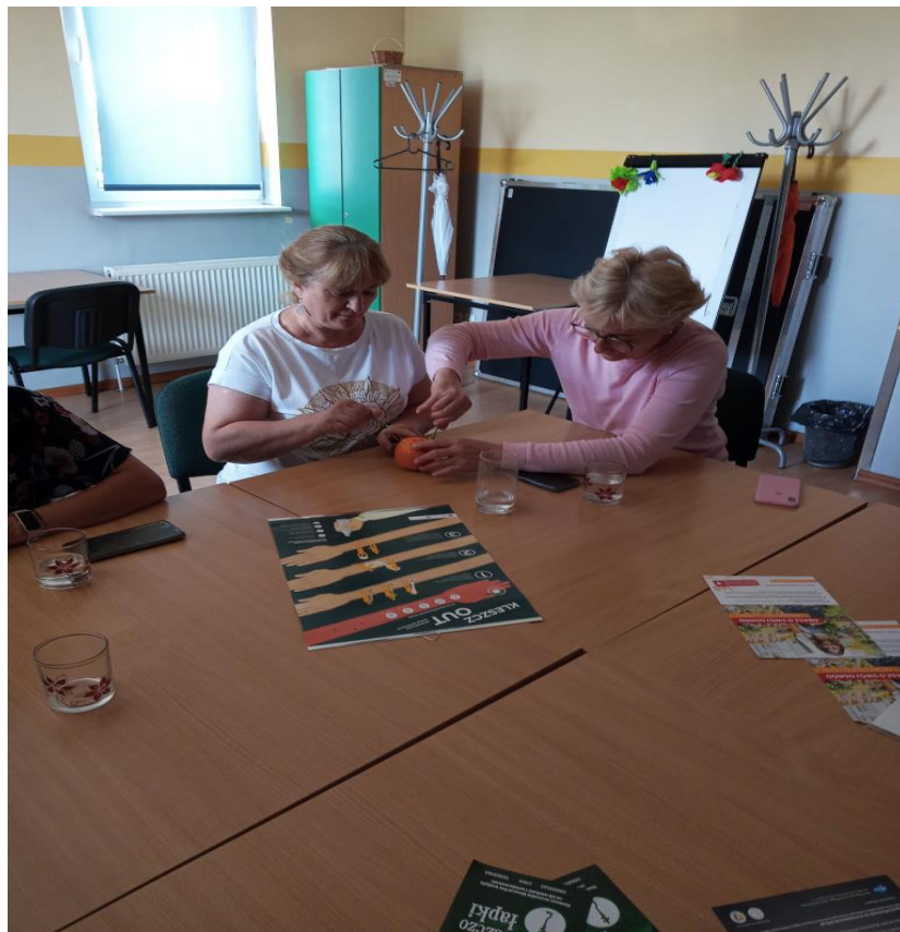
Zdjęcie nr 17 - Szkolenie dla kadry Hufca Pracy w Kościanie