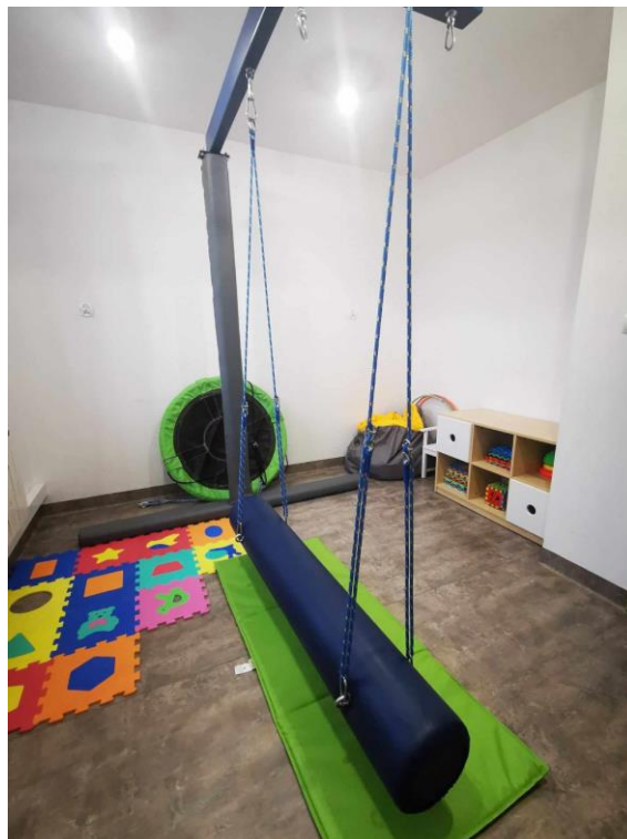
Zdjęcie nr 8. Sala z urządzeniami do zajęć terapeutycznych w Punkcie Przedszkolnym „Terapeutyczne Senso-Szkraby” w Kościanie