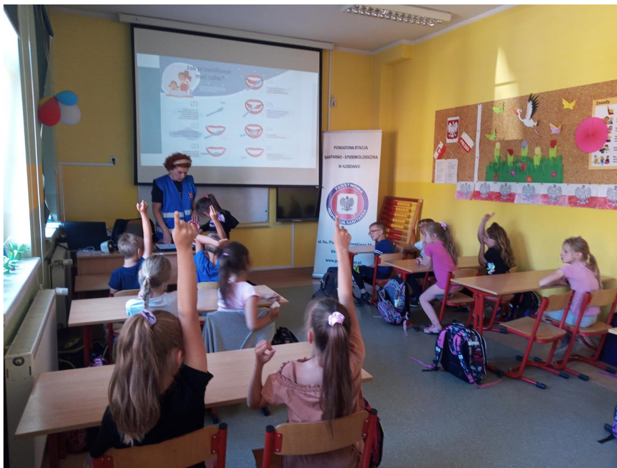
Zdjęcie nr 21 - Pogadanka w Szkole Podstawowej w Kokorzynie