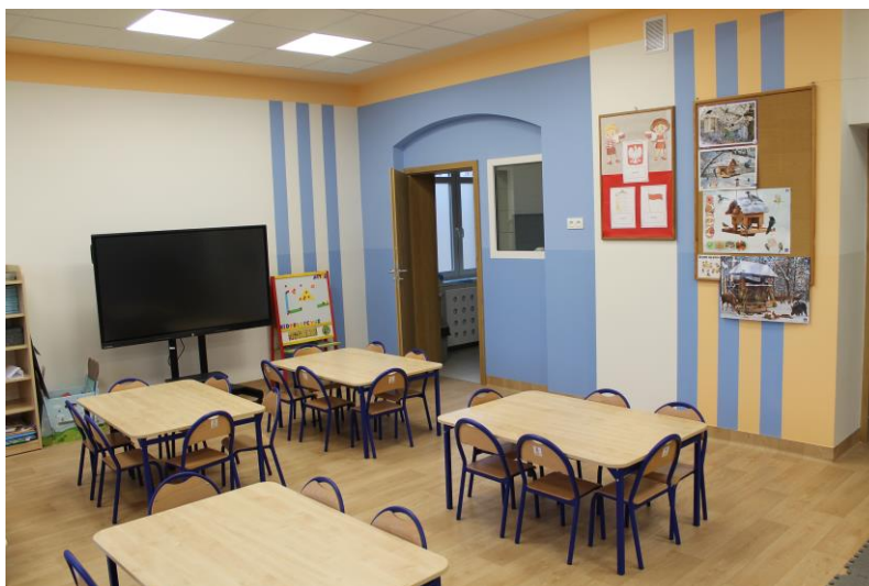
Zdjęcie nr 1. Nowa sala przedszkolna w Zespole Szkół Gminy Kościan Przedszkole i Szkoła Podstawowa w Racocie