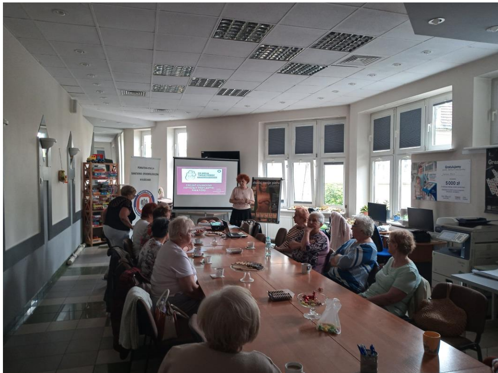
Zdjęcie nr 18 - Szkolenie dla uczestniczek Klubu Integracji Społecznej