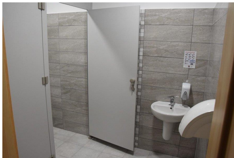
Zdjęcie nr 6. Wyremontowane pomieszczenie sanitariatu w budynku szkoły w Kielczewie

Dodatkowo, w 2023 roku, na terenie miasta Kościana powstał nowy obiekt – punkt przedszkolny „Terapeutyczne Senso – Szkraby” ukierunkowany na wsparcie dla dzieci posiadających orzeczenie o potrzebie kształcenia specjalnego. Obiekt funkcjonuje przy ul. Naclawskiej i jest placówką niepubliczną.