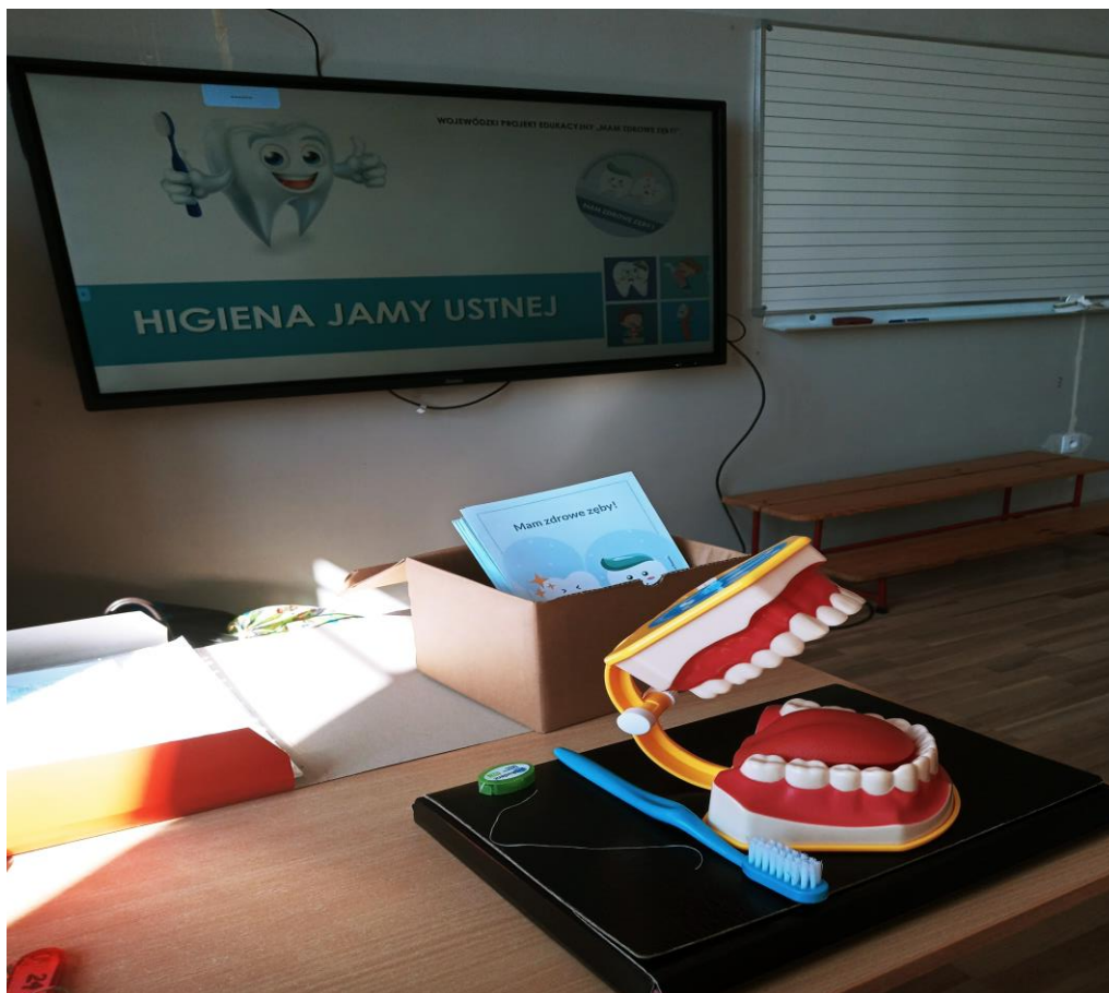
Zdjęcie nr 20 - Materiały dydaktyczne do realizacji projektu

Wszyscy uczestnicy zajęć otrzymali tematyczne broszurki, magnesy z logo projektu, kalendarzyki mycia zębów.