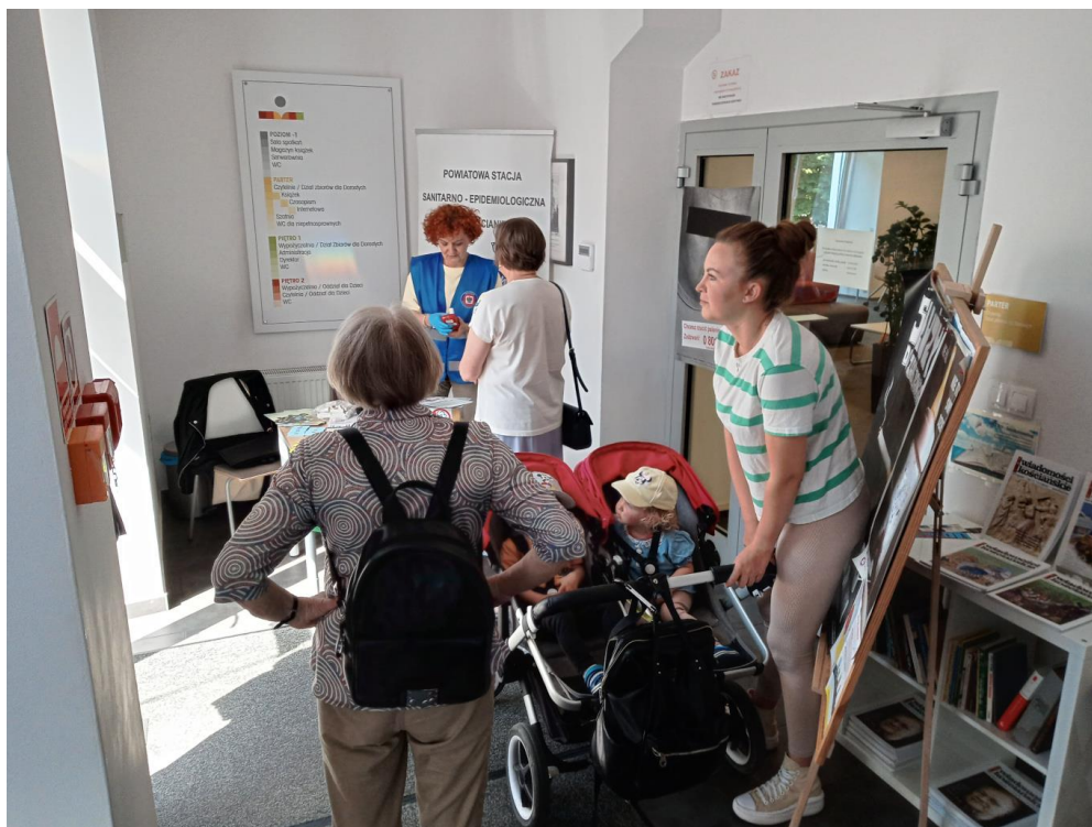
Zdjęcie nr 13 - Punkt informacyjno- edukacyjny w Miejskiej Bibliotece Publicznej

- w ramach obchodów Światowego Dnia Rzucania Palenia utworzono 2 punkty informacyjno – edukacyjne jeden dla pacjentów Stacji, drugi dla słuchaczy Ośrodka Doskonalenia Zawodowego w Kościanie. Z edukacji w punktach skorzystały razem 53 osoby, natomiast z badania Smokelyzerem 30 osób