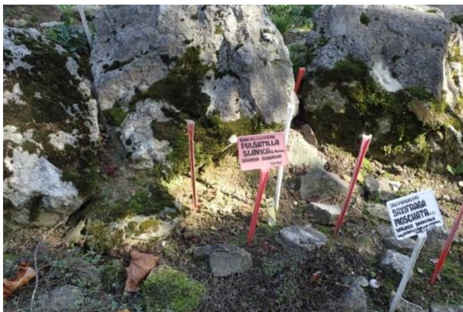
Fot. 8. Miejsce uprawy Pulsatilla slavica w Ogrodzie Botanicznym UMCS w Lublinie

Ogród Botaniczny w Łodzi: w 2017 w uprawie, nasiona otrzymano w 2009 r. z Górskiego Ogrodu Botanicznego w Zakopanem (nasiona pochodziły ze stanowiska naturalnego), obecnie 5 roślin; uprawa i mnożenie trudne (inf. niepubl. uzyskane z ogrodu, 2017).