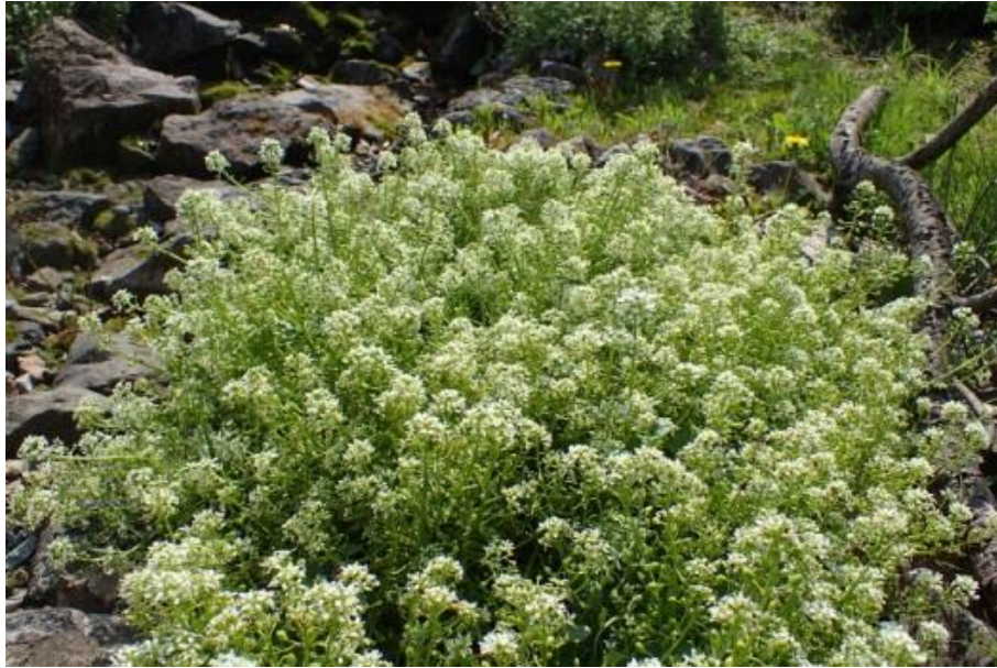
Fot. 4. Cochlearia tatrae w Ogrodzie Botanicznym-CZRB PAN Warszawa-Powisin