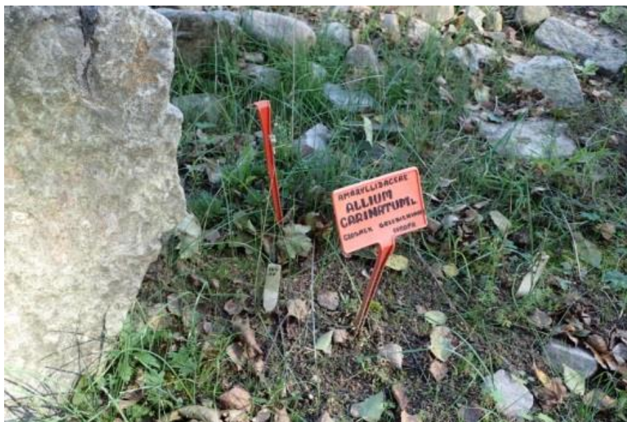
Fot. 2. Allium carinatum w Ogrodzie Botanicznym UMCS w Lublinie

Ogród Botaniczny Uniwersytetu Warszawskiego: według Index Plantarum był obecny w ogrodzie wprowadzony (nie ze stanowisk naturalnych) w 1970 ( http://www.ogrod.uw.edu.pl ).