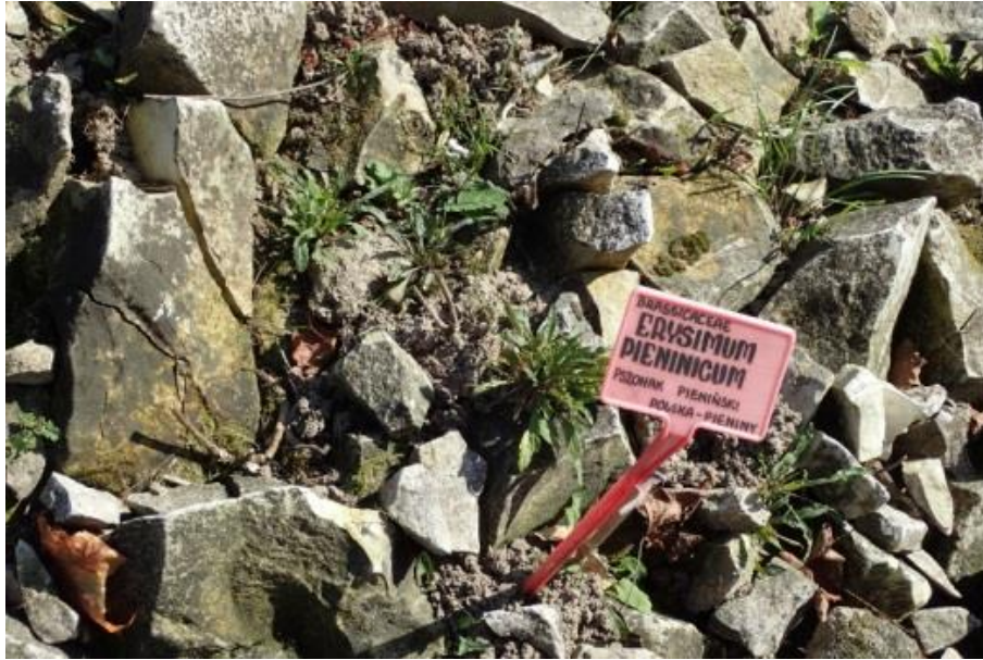
Fot. 5. Erysimum pienanicum w Ogrodzie Botanicznym UMCS w Lublinie.