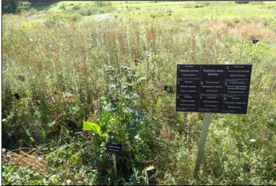
Fot. 9. Miejsce uprawy Ranunculus illyricus w Ogrodzie Botanicznym-CZRB PAN Warszawa-Powsin