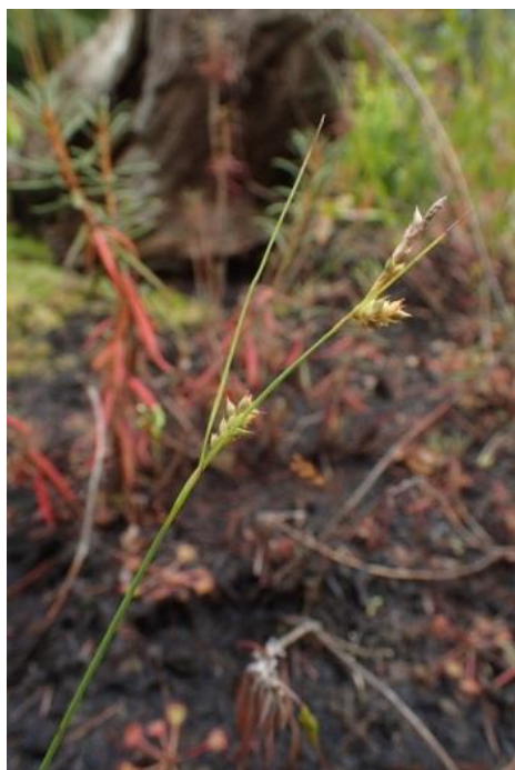
Fot. 13. Carex punctata w Ogrodzie Botanicznym Uniwersytetu Wrocławskiego

Ogród Botaniczny Uniwersytetu Wrocławskiego: pojedyncze okazy w uprawie (obs. własne z ogrodu, 2017).