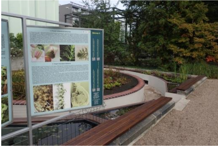
Fot. 1. Miejsce uprawy i tablica edukacyjna o Aldrovanda vesiculosa w Ogrodzie Botanicznym Uniwersytetu Wrocławskiego