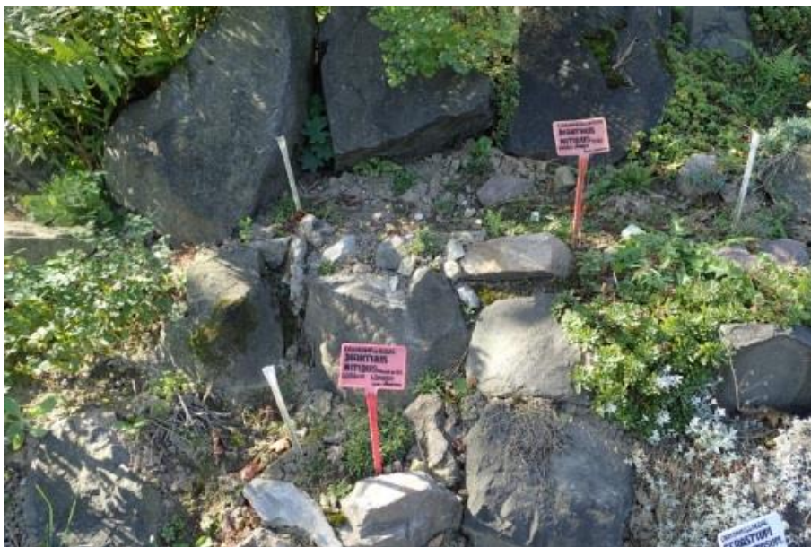
Fot. 14. Dianthus nitidus w Ogrodzie Botanicznym UMCS w Lublinie

Ogród Botaniczny Uniwersytetu Warszawskiego: według Index Plantarum wprowadzony ze stanowiska naturalnego (?) w 2007 ( http://www.ogrod.uw.edu.pl ).