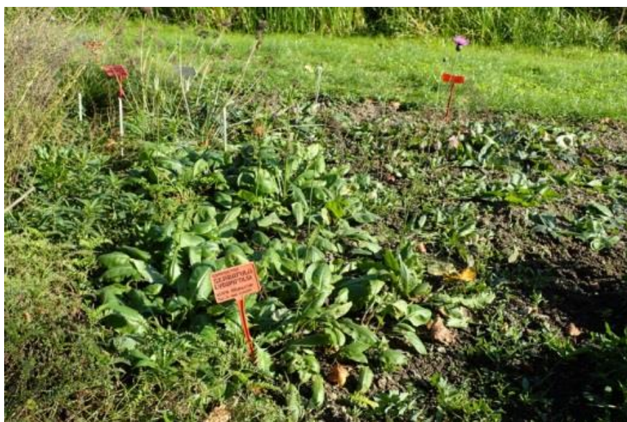
Fot. 11. Serratula lycopifolia w Ogrórze Botanicznym UMCS w Lublinie (fot. Krzysztof Ziarnek)

Ogród Botaniczny Uniwersytetu im. M. Curie-Skłodowskiej w Lublinie: w 2017 w uprawie, wprowadzony 24.05.2010 - 7 młodych roślin oraz 10.06.2015 - 5 młodych roślin z Ogródu Botanicznego-CZRB PAN w Warszawie (z Rezerwatu przyrody Skorocice, k. Buska), obecnie 12 sztuk; uprawa średnio trudna, nasiona zjadane przez bezkręgowce (inf. niepubl. uzyskane z ogrodu, 2017).