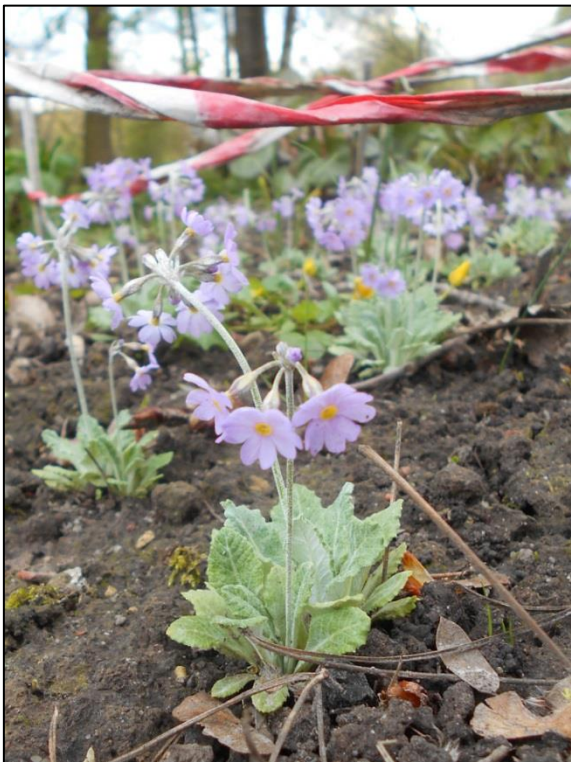
Fot. 7. Primula farinosa w Ogrodzie Botanicznym UMCS w Lublinie

Ogród Botaniczny Uniwersytetu Warszawskiego: według Index Plantarum wprowadzony w 2007 z OB Uniwersytetu Jagiellońskiego w Krakowie ( http://www.ogrod.uw.edu.pl ).