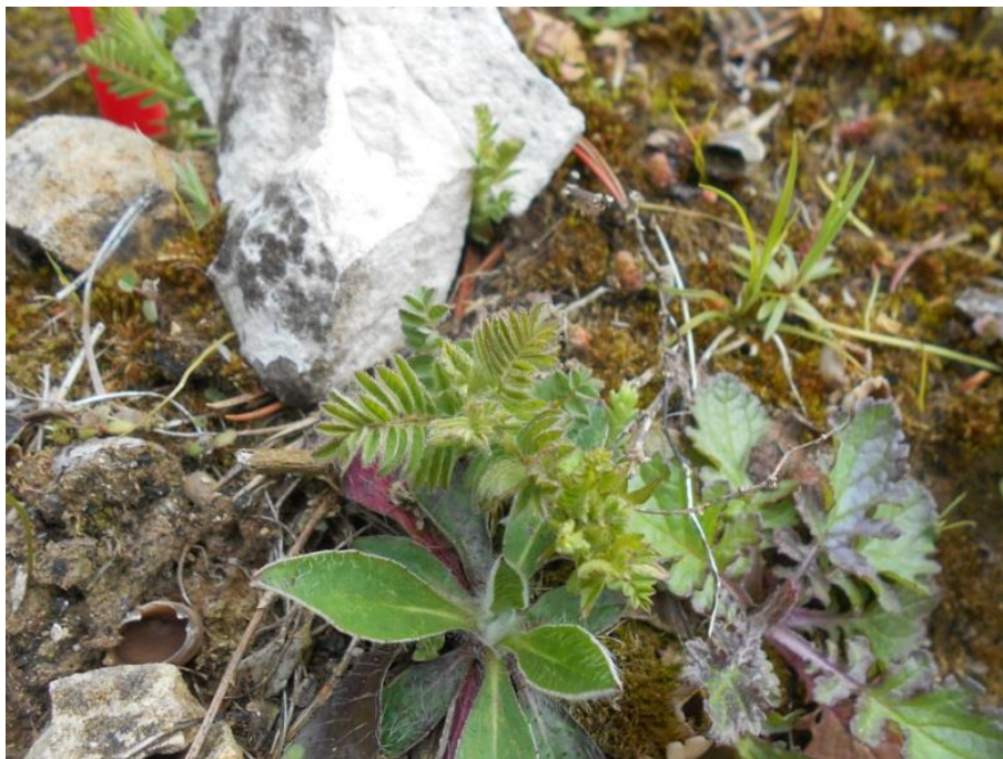
Fot. 3. Astragalus penduliflorus w Ogrodzie Botanicznym UMCS w Lublinie w kwietniu 2017

Ogród Botaniczny Uniwersytetu im. Adama Mickiewicza w Poznaniu: w 2017 w uprawie, wprowadzony w 2005 z Passo Aprica (Włochy), obecnie 5 okazów; wprowadzony w 2013 z Forni Valfura (Włochy), obecnie 1 okaz (inf. niepubl. uzyskane z ogrodu, 2017).