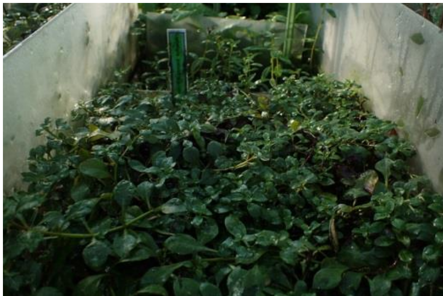
Fot. 15. Ludwigia palustris w Ogrodzie Botanicznym Uniwersytetu Wrocławskiego

Ogród Botaniczny-CZRB PAN w Warszawie: gatunek w uprawie (Puchalski i in. 2014-2015).