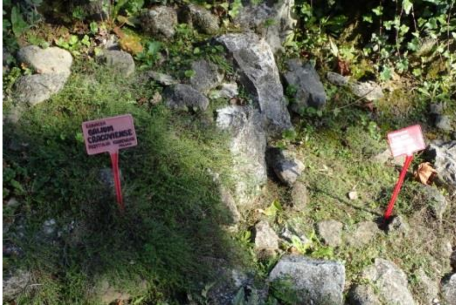
Fot. 6. Galium cracoviense w Ogrodzie Botanicznym UMCS w Lublinie

Ogród Botaniczny Uniwersytetu im. M. Curie-Skłodowskiej w Lublinie: w 2017 w uprawie, wprowadzony w 2012 - kilkanaście młodych osobników (ok. 5 cm wysokości) z Ogródu Botanicznego-CZRB PAN w Warszawie, obecnie zwarta powierzchnia ok. 1 m 2 ; uprawa średnio trudna (inf. niepubl. uzyskane z ogrodu, 2017).