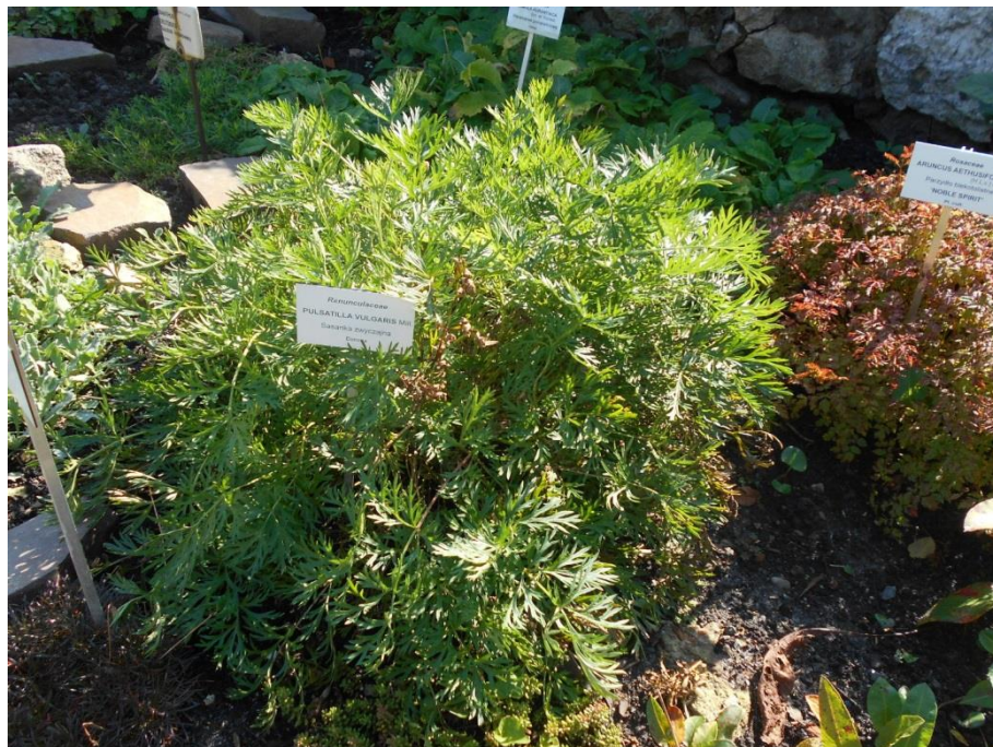
Fot. 16. Pulsatilla vulgaris w Ogrodzie Botanicznym Uniwersytetu Jagiellońskiego

Ogród Botaniczny Uniwersytetu im. M. Curie-Skłodowskiej w Lublinie: w 2017 w uprawie, wprowadzony w 1966 lub 1969 z Miasteczka UMCS w Lublinie ("Stary Botanik") - pochodzenie pierwotnie niewiadome, obecnie 20 sztuk; uprawa średnio trudna, korzenie zjadane przez gryzonie, w warunkach uprawy krzyżuje się z innymi gatunkami (inf. niepubl. uzyskane z ogrodu, 2017).