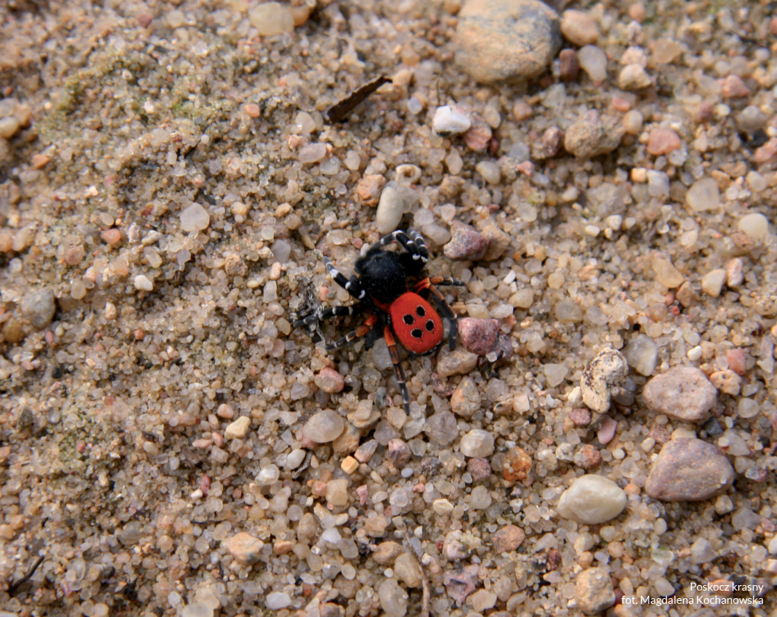
Poskoczek krasny