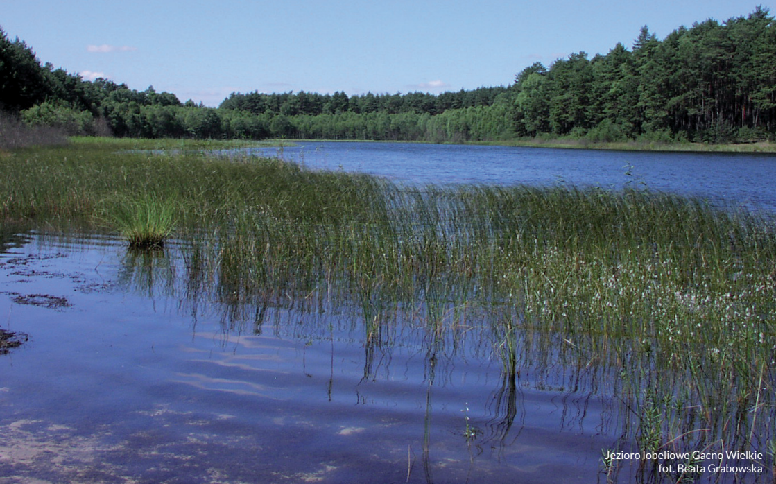
Jezioro lobeliowe Gacno Wielkie