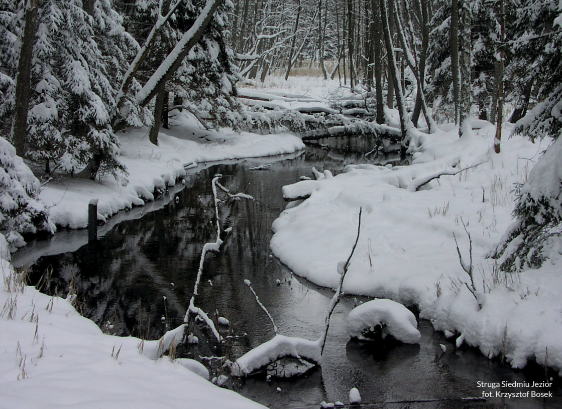
Struga Siedmiu Jezior