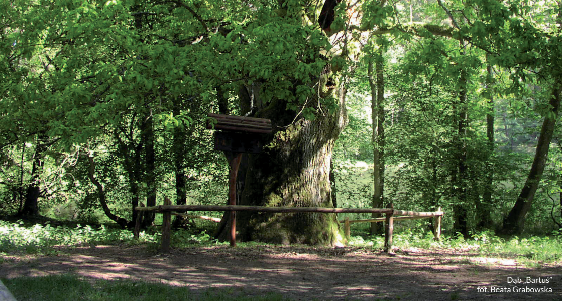
Dąb „Bartuś”