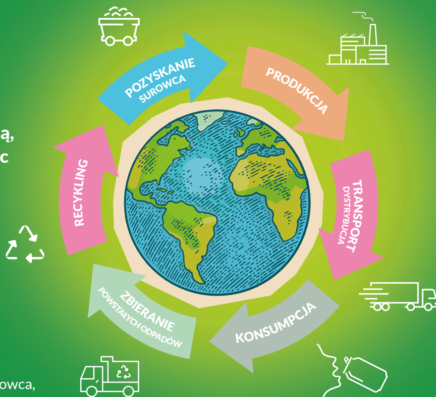
Cykl życia produktu na przykładzie puszki aluminiowej

Cykl życia produktu stanowią kolejne i powiązane ze sobą etapy istnienia produktu, począwszy od pozyskania lub wytworzenia surowca, poprzez produkcję, dystrybucję, użytkowanie po zagospodarowanie odpadów powstałych z produktu po zakończeniu jego użytkowania.