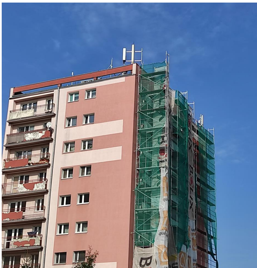
Fot. 1: Widoki anten stacji bazowej: ID: BT32748, zlokalizowanej: os. Lotnictwa Polskiego 10, Poznań