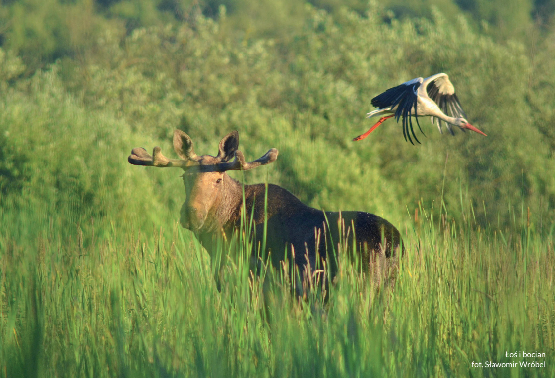
Łoś i bocian