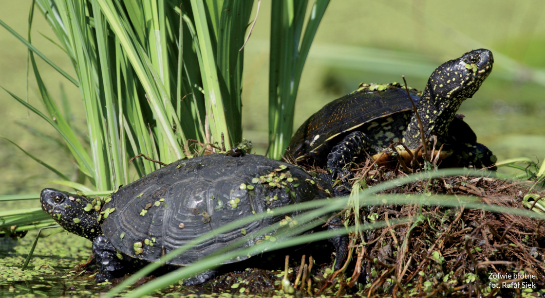
Żółwie błotne