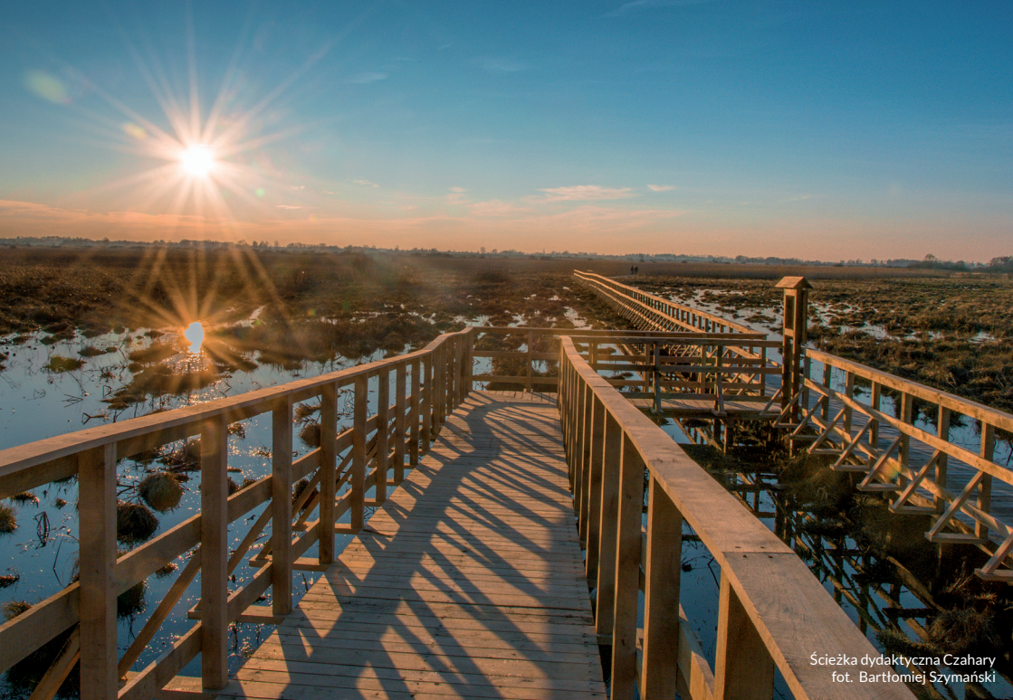
Ścieżka dydaktyczna Czahary