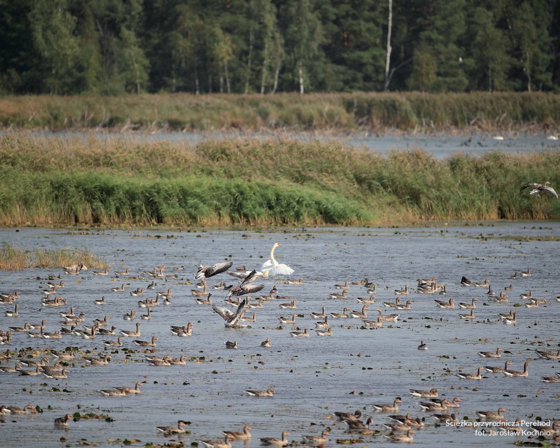
Ścieżka przyrodnicza Perehod