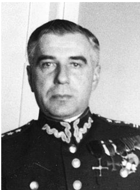
Pułkownik Teofil Karol Maresch.

Źródło: Narodowe Archiwum Cyfrowe, 3/1/0/7/323.