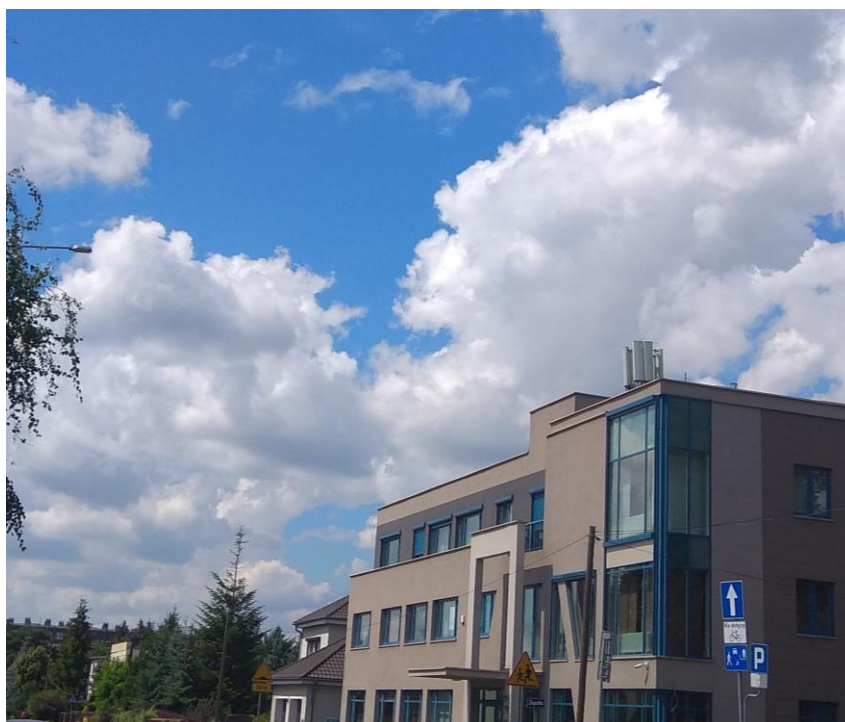
Fot. 1: Widok anten stacji bazowej ID: POZ0113, zlokalizowanej pod adresem: ul. Leszka 44, 61-062 Poznań