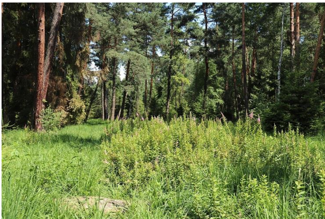
Fot.1. Zwarty płat tawuły porastający brzegi cieku w obszarze objętym pracami.