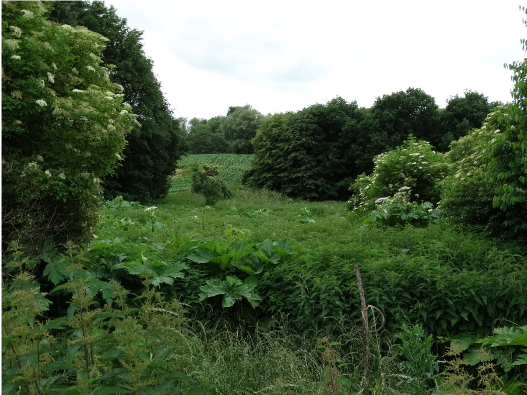
Fot. 3. Barszcz Sosnowskiego na obrzeżach terenów użytkowanych rolniczo.