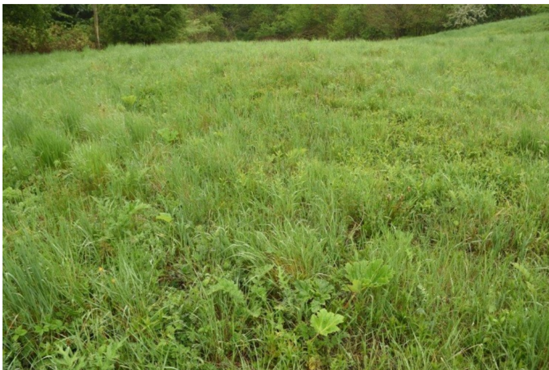
Fot. 1. Płat barszczu Sosnowskiego na siedlisku muraw kserotermicznych