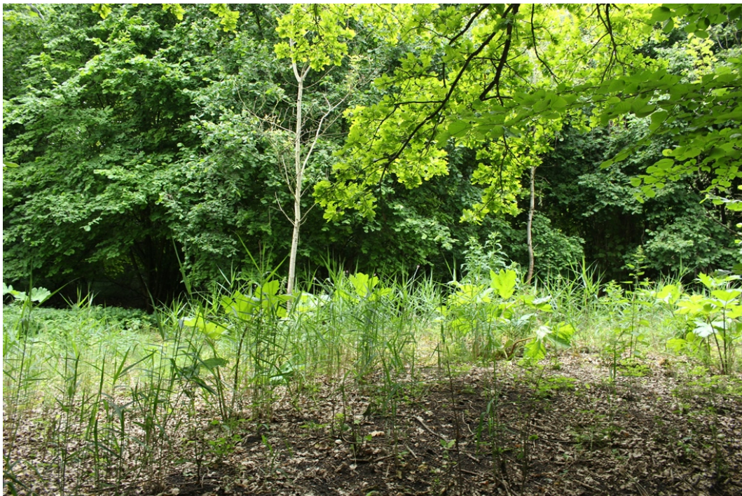
Fot. 4. Płat barszczu Sosnowskiego na terenie zadrzewionym.