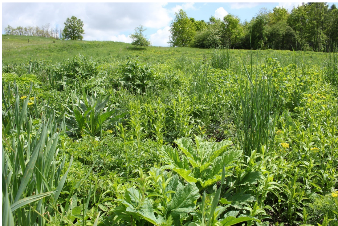
Fot. 2. Barszcz na powierzchni murawy odtwarzanej.