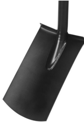
Ryc. 2. Przykładowy wygląd szpadła o prostym ostrzu.

Rośliny będą wykopywane przy użyciu szpadła prostego lub ostrego (Ryc. 2), co ma na celu wykopywanie/przecinanie korzeni na możliwie największej głębokości.