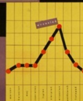
W LECIE I JEŚNI NARATWIJ ZACHOROWAĆ