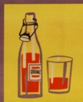
ZADAJ CZYSTEGO NACZYNIA