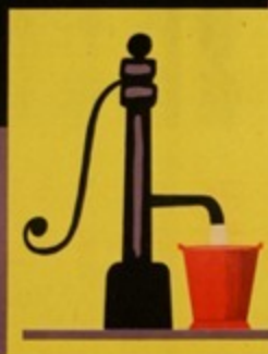
UZYWAJ WODY Z CZYSTEJ STUDNI